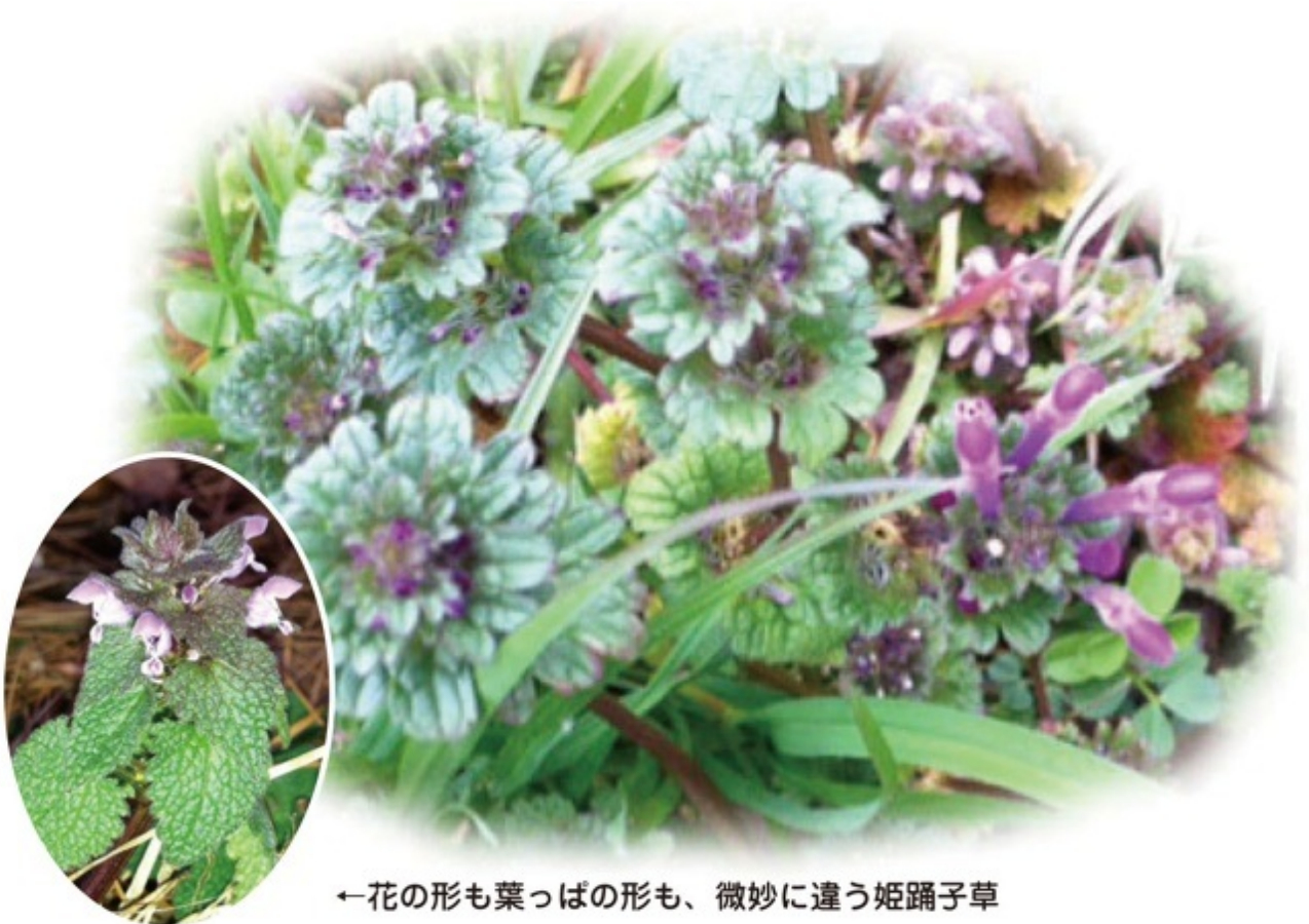
←花の形も葉っぱの形も、微妙に違う 姫踊子草