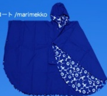
レインコート / marimekko

ここ数年レインブーツに始まり、レインコートなどの心躍るような様々なレイングッズが数多く販売されている。 お気に入りのレイングッズをお供にのんびりと歩けば更に楽しくなる事間違いない。