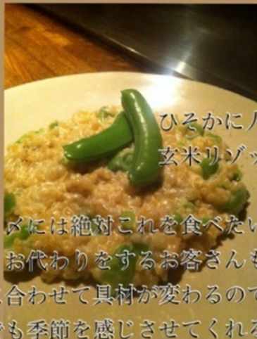
ひそかに人気 玄米リゾット

メには絶対これを食べたい。 お代わりをするお客さんも。 季節に合わせて具材が変わるので、 味覚でも季節を感じさせてくれる。