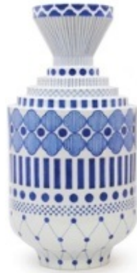
花器（大） 幾何学文様 ¥1,500,000

どの作品もハイメ・アジョンの世界から溢れる色と九谷焼の綺麗な色で 心をキュンとさせてくれるものになっております。 ユーモアがあってそしてなんだか親しみが湧く。和ませてくれるペットみたい。 大切な時間を過ごす家にもcolorfulを。