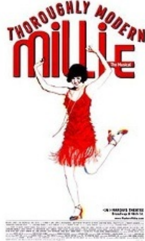
ブロードウェイ版モダンミリーの看板 ♪おしゃれ♪

音楽はアカデミー賞を受賞しているし、 2002年にブロードウェイでミュージカルにもなった作品なので、見やすいと思います。