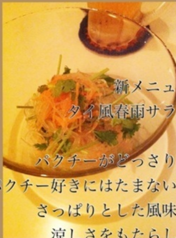
新メニュー タイ風春雨サラダ

メには絶対これを食べたい。 お代わりをするお客さんも。 季節に合わせて具材が変わるので、 味覚でも季節を感じさせてくれる。