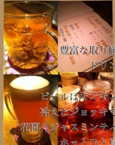
豊富な取り揃え ドリンク

パクチーがどっさりで パクチー好きにはたまない。 さっぱりとした風味が 涼しさをもたらし、 食欲も増す。