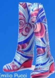
レインブーツ / Emilio Pucci

広く緑が多い公園は勿論ですが、近所の住宅街や小さな公園を歩いてみるのもいいかと。 新緑が溢れるこの時期、どの木々も恵みの雨に包まれている幸せが伝わってくる。 雨と緑の匂いが爽やかに身体中に広がるのを感じられる。