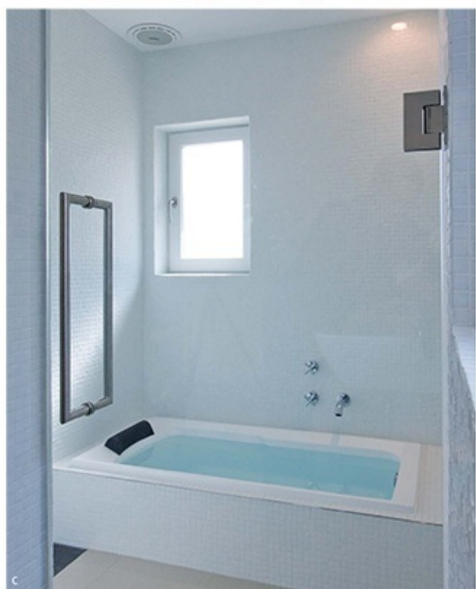
a. プライベートな場所だからこそ、より開放的に。真っ白なタイルが心落ち着かせてくれます。b. 小窓からの優しい自然光が、ほっとさせる最大の秘密。 c. お気に入りの音楽とともに過ごすバスタイムは、至福のひとつ。