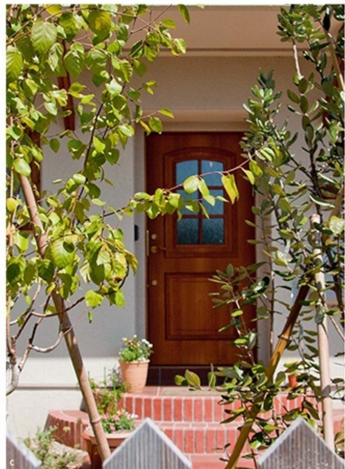
a. 陽当たりが良すぎる！という賛沢なお庭。水やりは日課です。b. アプローチのタイルの小径が、ほっとさせてくれる空間に。 c. あたたかな木製ドアは、まるで素敵な童話の表紙のよう。