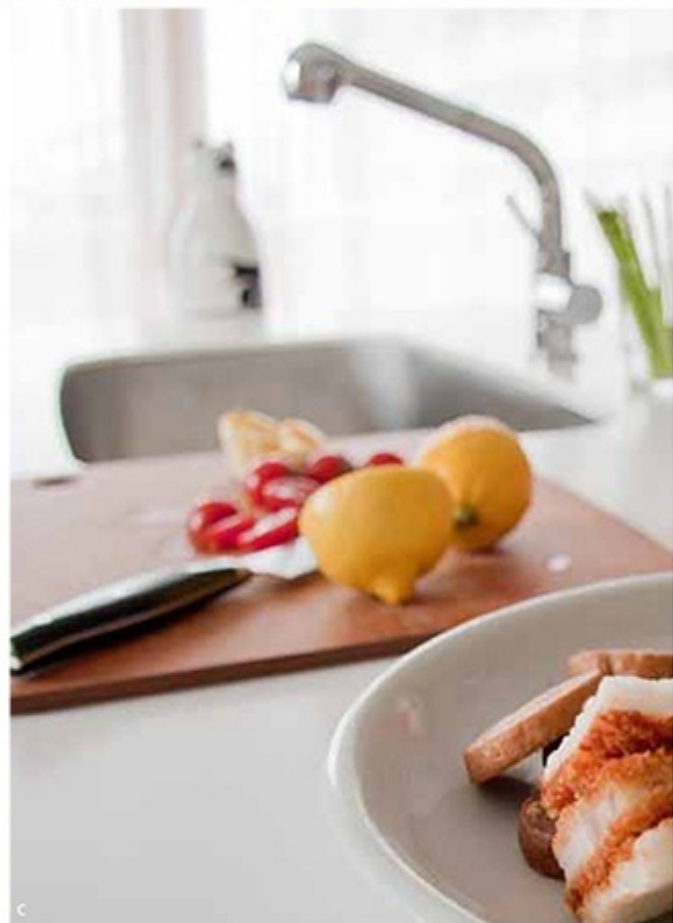
a. お互いの時間が重なったら、それがお茶の合図です。b. キッチンのおには、ワークスペース兼パントリーが。c. 毎日のお料理時間が、ぐっと楽しくなりました。