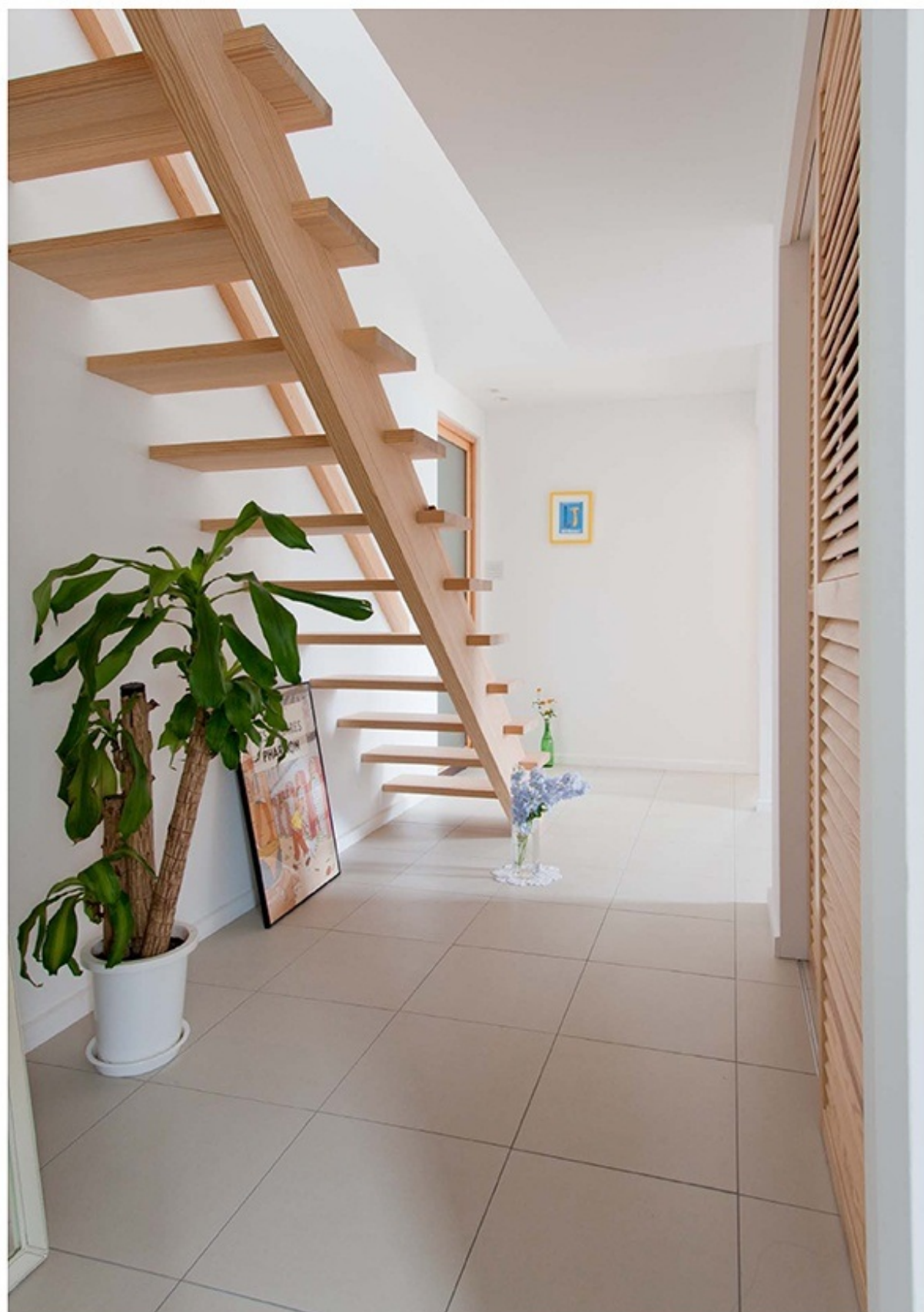
玄関アプローチから、2階のリビングへと続く階段。光がずっと差し込めば、とっておきのギャラリーへと表情を変えます。お気に入りの絵も、花たちも、ちょっと嬉しそう。