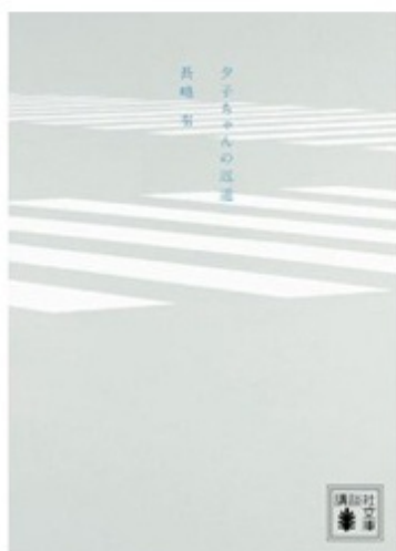
講談社文庫 「夕子ちゃんの近道」より