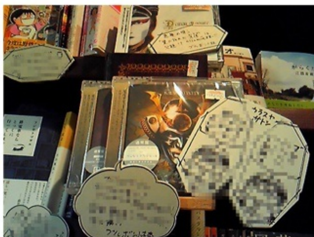
ヴィレッジヴァンガードイオンモール川口前川店フェア限定公開の カラスヤさん直筆ポップはなんとあのお方風カラスヤサトシ!?