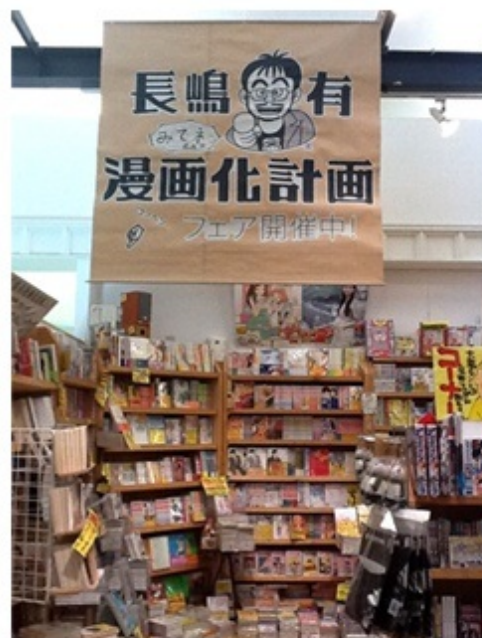
横浜では特大の看板が天井からお出迎え！