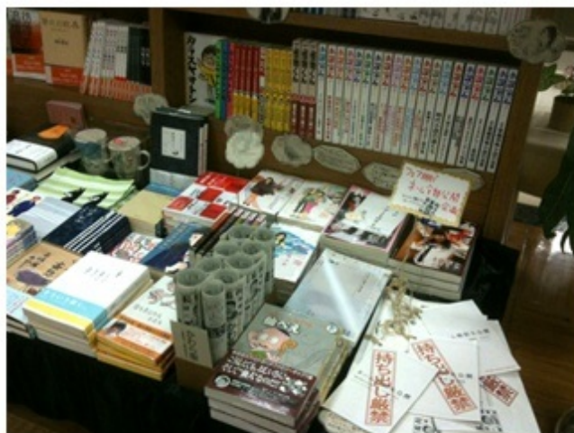
オリオン書房ノルテ店の様子 ノルテは漫画化掲載号のバックナンバーが全冊そろっています