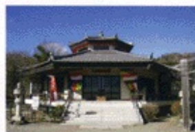
心通院 〈寿老人／長寿・富禄・招福〉 本城1丁目1742 0284-41-3202