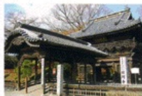
鍔阿寺 〈大黒天／五穀豊穰・諸願成就〉 家富町2220 0284-41-2627