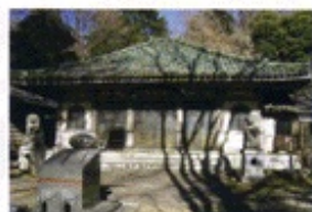
西宮・長林寺 〈福祿寿尊／幸福・福祿・長寿〉 西宮町2884 0284-21-5636