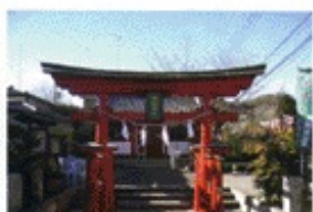
通6丁目巖島神社(長尾弁天) 〈弁財天／福德財宝・家内和合〉 通6丁目3177 0284-21-0215