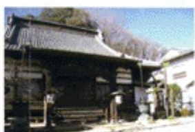
福巖寺 〈布袋尊／福德円満・家内安全〉 緑町1丁目3270 0284-21-6990