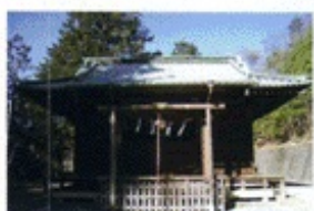
西宮神社 〈恵比寿神／除災招福・商光繁盛〉 西宮町3129 0284-21-6790