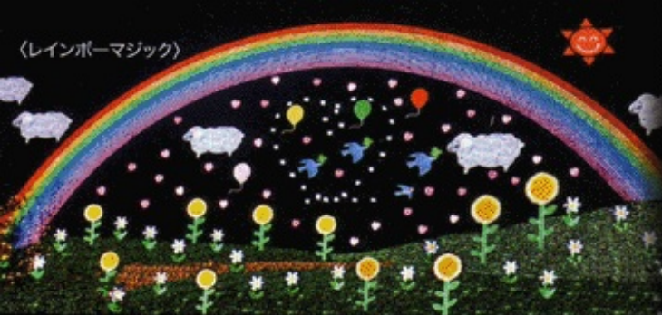
〈レインボーマジック〉