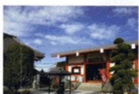
徳蔵寺 〈大黒天／五穀豊穰・諸願成就〉 猿田町9-3 0284-41-8621