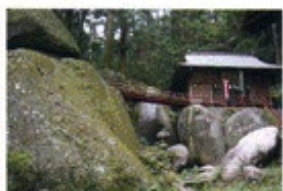
名草巖島神社(名草弁天) 〈弁財天／福德財宝・家内和合〉 名草上町4990 0284-41-9977(名草公民館)