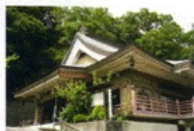
常念寺 〈毘沙門天／開運厄除・学業成就〉 通7丁目3094 0284-21-2016