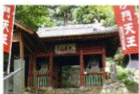
最勝寺 〈毘沙門天／開運厄除・学業成就〉 大岩町264 0284-21-8885