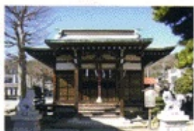
本城巖島神社(明石弁天) 〈弁財天／福德財宝・家内和合〉 本城2丁目1805 0284-42-0525