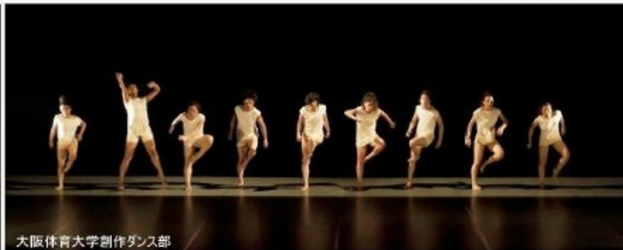
大阪体育大学創作ダンス部