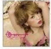
Hope or Pain (1997) MY STORY 収録 浜崎あゆみ

私の恋愛ソングは、浜崎あゆみのHope or Painです! 私は高校の時彼女がいる人のこと好きになっちゃって、探めようとしても何とかが繋がってたくて、辛い時期がありました。そんな時、この曲の「一歩を期待してるといふ? 振り解めてる縁話が舞えるくらいに心が焦っててもうぐに 海を越えてもう何歳も経ちました」の歌詞がまさに私の姿でした。結局気持ちを伝えることも