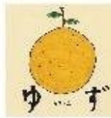
地下街 (1997) ゆずの東成録 ゆず

この曲は、高校の頃3年間片思いしていた女が好きだった由です。当時の自分はかなりシャイで、その子にメールアドレスを聞くことさえ思い立ってから行動に移すまで1週間かかりました。そんな性格だったので、当然告白なんて簡単にはできるはずもなく、少ない会話の中で知ることでできた彼女の好きな曲を聴き、日々思いを募らせていました。そんなある日、彼女に返信ができたという噂を