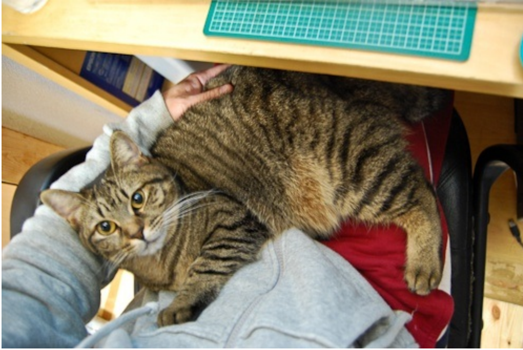
冬はずっと膝の上