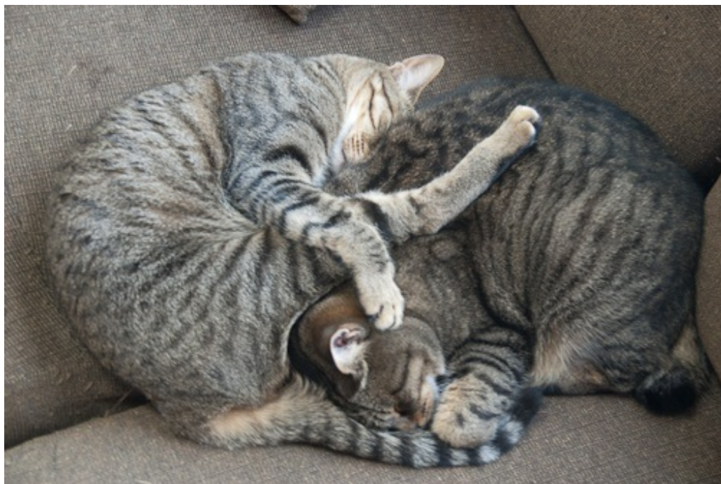
からみあって寝ています。