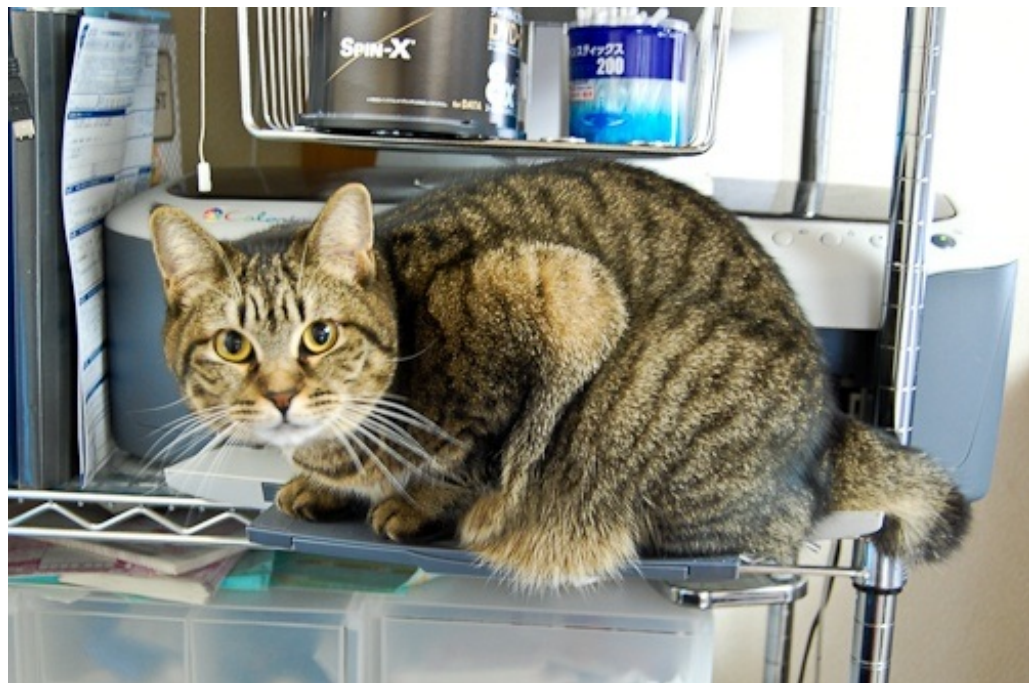
そこはプリンターのトレイ