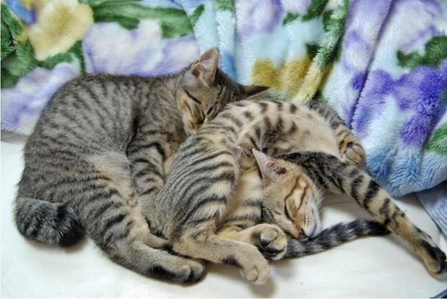
寝相と体型が違う2匹