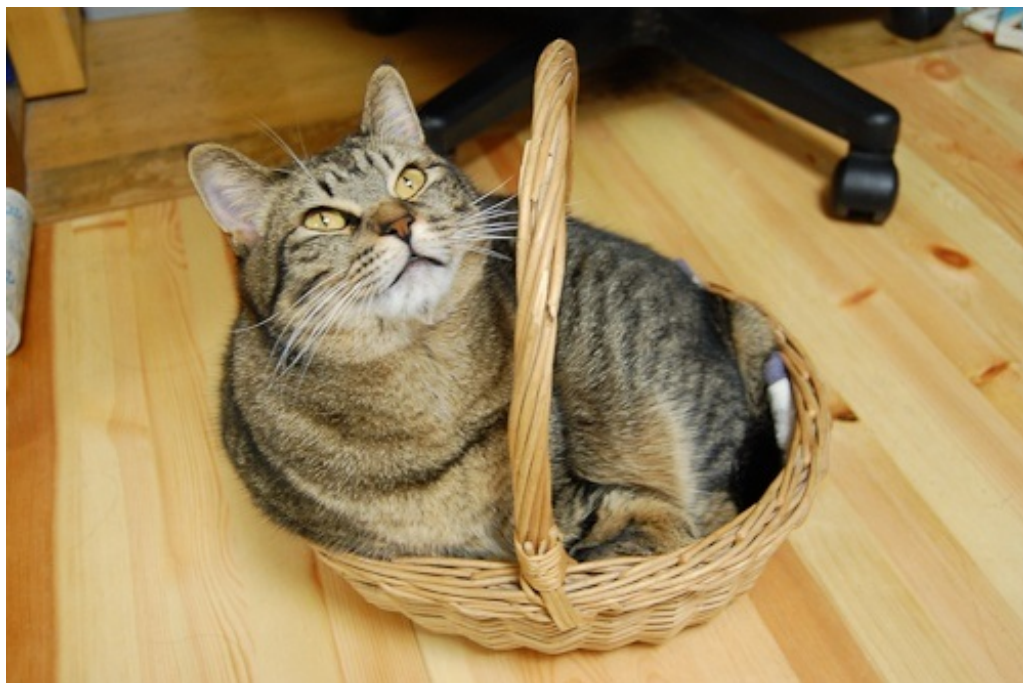
さくらは、カゴ好き