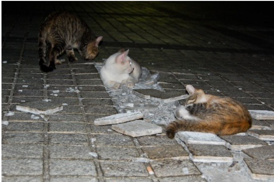
瓦礫のくぼみでくつろぐネコ