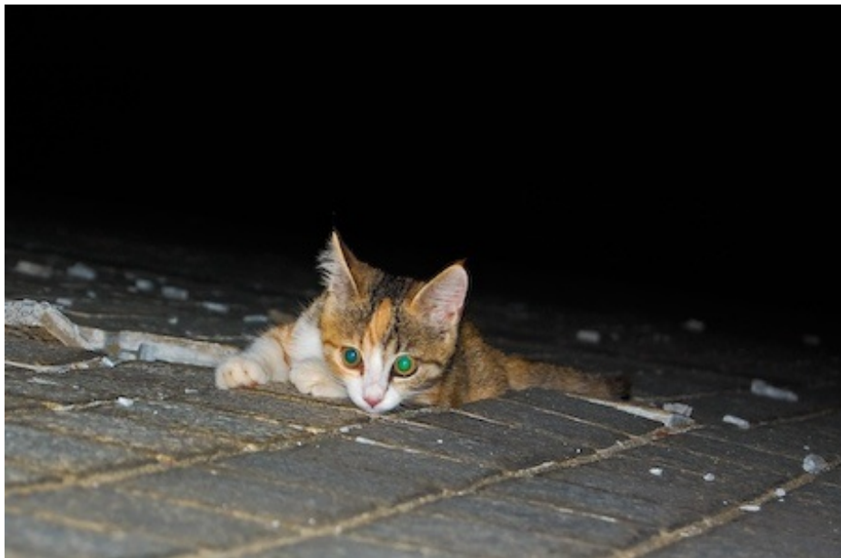
瓦礫（くぼみ）に身を埋めるのが気持ちよい