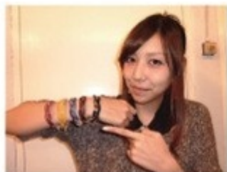
カラーが豊富。連ねて巻いても◎

70坪のショップ内に並ぶ色とりどりの古着に圧倒される中城村にある古着屋さん。レディース、メンズだけではなく、ベビー・キッズ古着の品数も豊富なので、家族連れのお客様も多いそうです。オーナーは音楽好きな友人も多く、インディーズアーティストのオリジナルTシャツも取り扱っています。