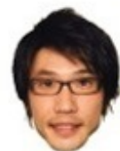
モグコザ団 シマタケ