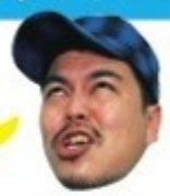
モグコザ団 マエダ