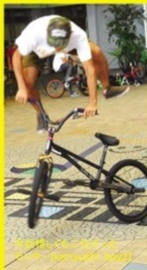
大会で使ったBMXバイク、RIDE HOTの「RIDE HOT」