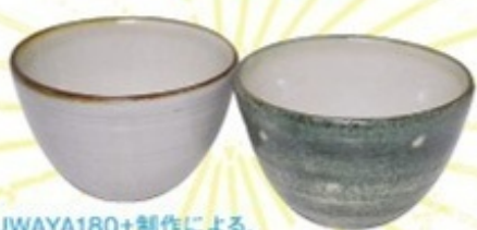
UTSUWAYA180+制作による、 KGAロゴ入りカフェオレポウル

※スタンプの押印はこのモグコザの8ページに ※スタンプがたまった際の景品の受け渡しはKGAで行います。