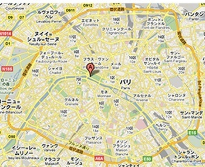
ぶらりパリ市内 Flâner dans Paris, France