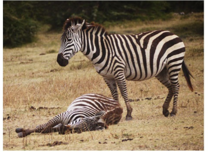
草なら食べるのに（しょんぼり）。