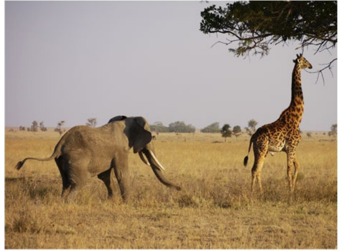
好きな子をいじめる心理。