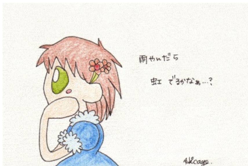
雨やんだら 虹でるかなあ？