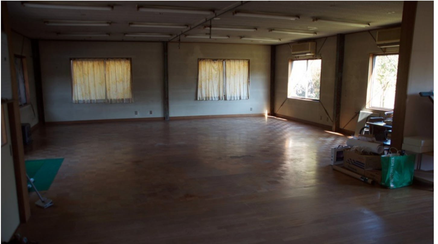
仕事を引っ越すことになりました。