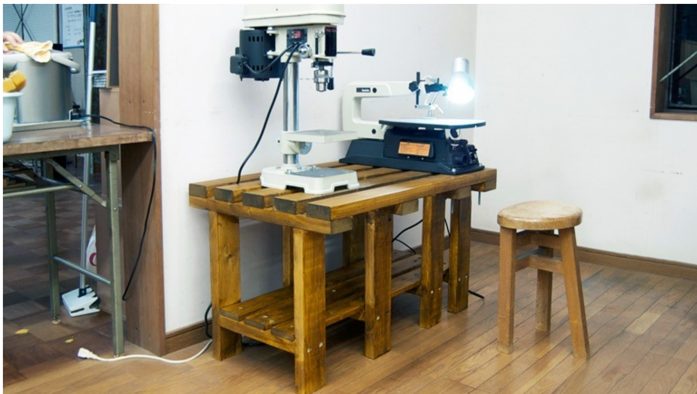
電動糸鋸盤とボール盤がきました。