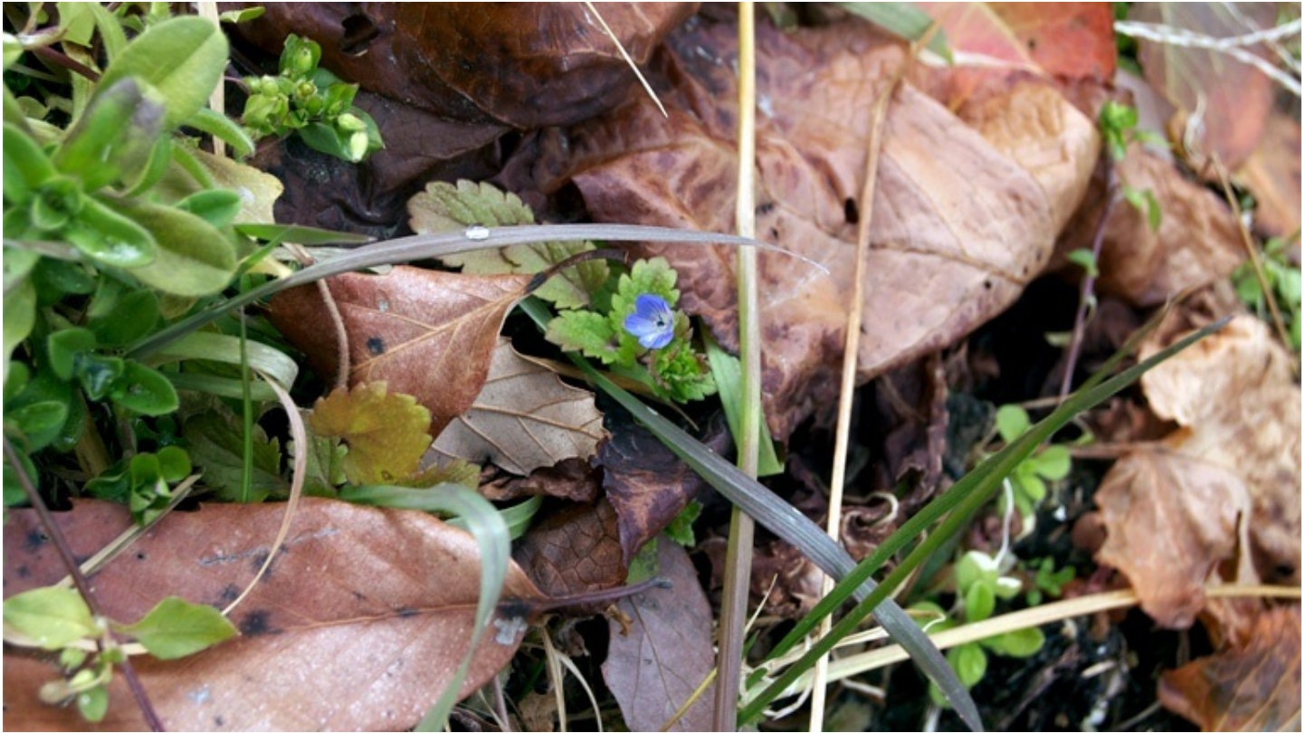
2月だというのに、オオイヌノフグリがもう咲いていた。