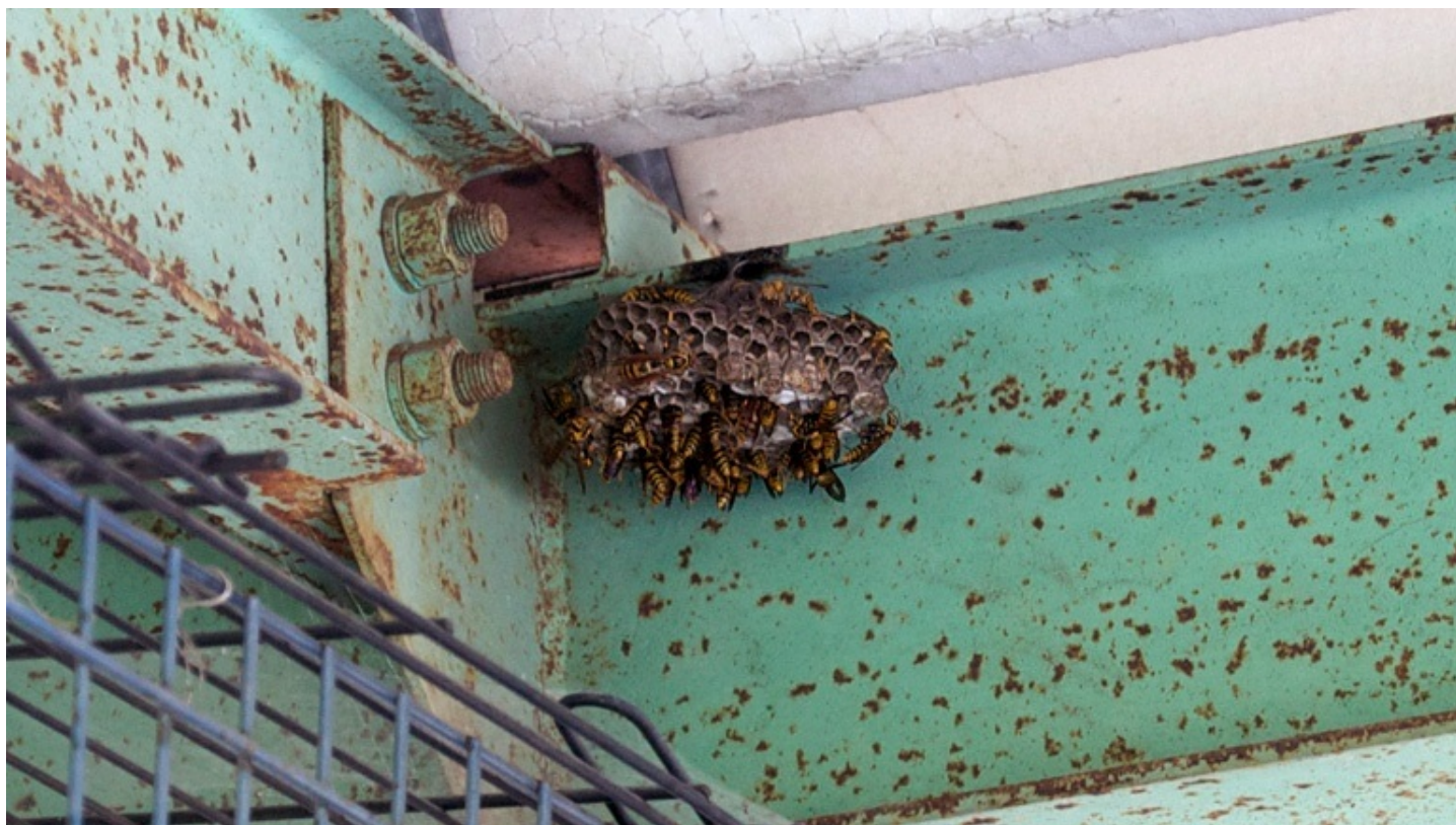
がんばって巣作りしていたスズメバチたち。冬は越せなかった。