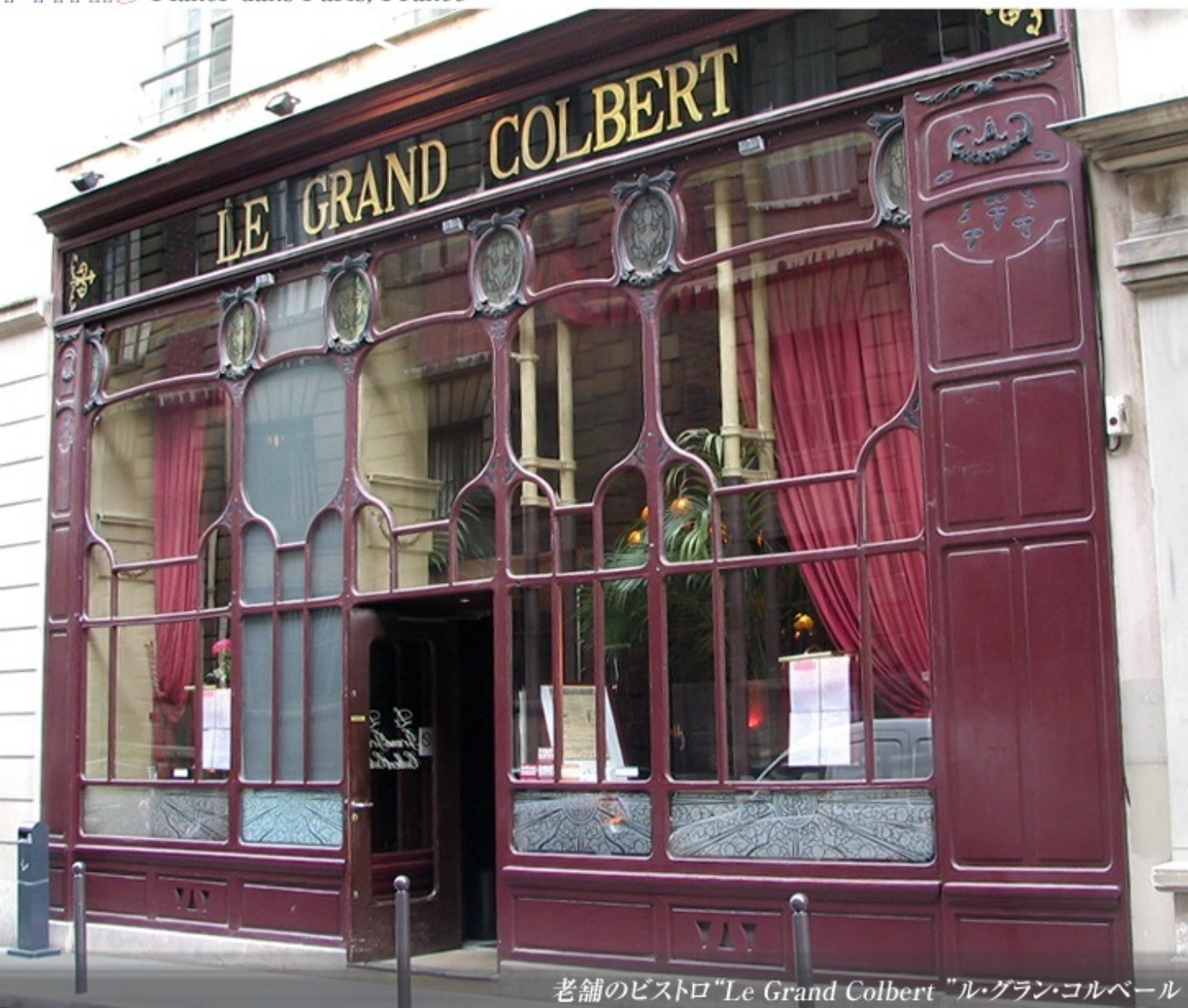
老舗のビストロ "Le Grand Colbert" ル・グラン・コルベール

ギャルリー・コルベール Galerie Colbert [Passages couverts de Paris]