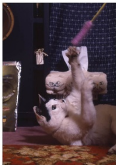
市ヶ谷亀ヶ岡八幡宮境内で見かけた元気いっぱいの仔猫とのんびり母猫。