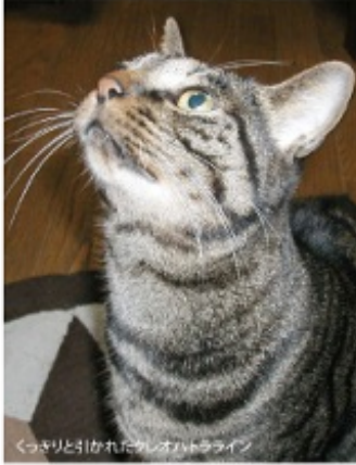
くさりと呼ばれるレイパトライン