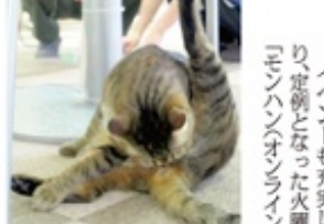
15時過ぎ、猫ちゃんたちはムクムクと起きだし、活発に動き始めた。

いざ!初の猫カフェへ 今回やってきたのは、写真版サゼさんに出演したプリンちゃんがいる猫カフェ「Cat Cafeねここび」@池袋。駅から5分くらい歩いた雑居ビルの中にある。知る人ぞ知るという評判で、初めての人はなかなか見つけられない穴場のスポットだ。