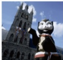
上写真の背景に映っているのが、織姫会館の鐘楼。次回のイーペル「猫祭り」は2012年開催。お問い合わせはベルギー・フランダース政府観光局 (03-3237-8031) まで。