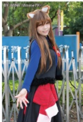
猫耳をつけて楽しむコスプレイヤー

祭りの日のほんの一瞬に けでは物足りない。そんな 人達は、猫の姿を借りて日 常の町に繰り出します。 オタクの聖地「アキバの メイドカフェ」や同人誌即 売会のコミケ(コミック・ マーケット)の略称)で有名 なコスプレイヤーが、それ アニメキャラなどのコス チュームを身につけて楽し む人のことです。 コスプレは、最近では