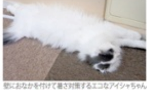
動におなかを付けて着せ対策するエコなアイシちゃん