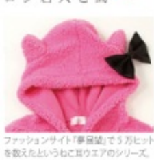
ファッションサイト「夢屋」でうわヒット を数えたというねこ耳のシリーズ

Yなネコミミは、今やお姫 のトレードマーク。など など。猫の甘え上手な可 愛らしさを女性らしさと シンクロさせている ようです。 渋谷109系ブランド 「JSG」やバンク系のア ラント「マッドガール」な どにもねこ耳パーカーを出 してしています。これは、気 まままに弄らかつてセクシ なイメージに、ねこ耳で可 愛らしいをプラスという 感じ。 また、ファッションだけ でなくメイクでも猫がモ ーティベーションです。