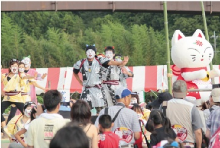
平成22年度の「かんなみ猫おどり」は8月21日(土)開催。コンテストの参加は3名以上のユニットで、プロは参加できませんが、レベルは高いとのこと。

チームによる創作ダンスコンテスト「猫じゃ猫じゃコンテスト」が行われ、優勝も出ればミニゲームも用意されていて子どもも大人も楽しめます。屋外グラウンドに1万〜1万5千人の出入を見込むという盛況ぶり。