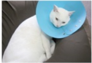
写真版サゼさんにタマで登場した「プリンちゃん」。脱走防止のケープ(エリザベスカラーというんだそう!)を付けられ、ちょっと苦しそう。