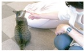
とおる君に甘える「甘太娘」