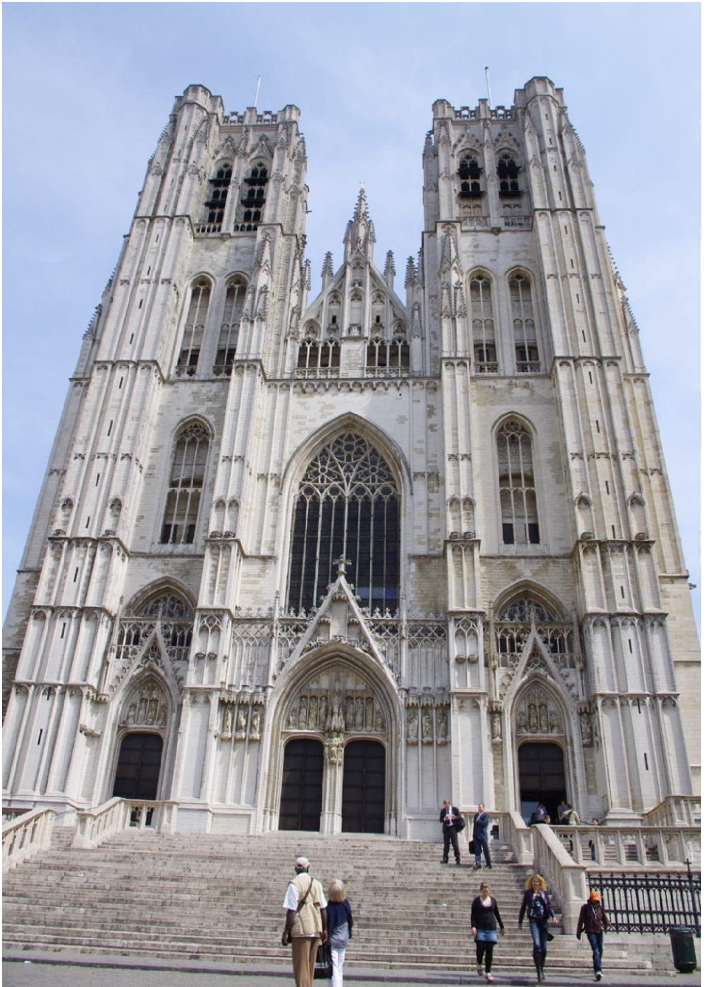
聖ミッシェル・エ・ギュデル大聖堂。