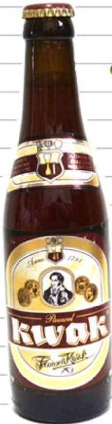
フラスコみたいな 形のグラスで飲む ベルギービール“kwak”