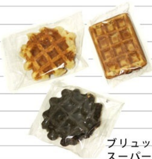
ブリュッセルの スーパーで買った ワッフルの詰め合わせ