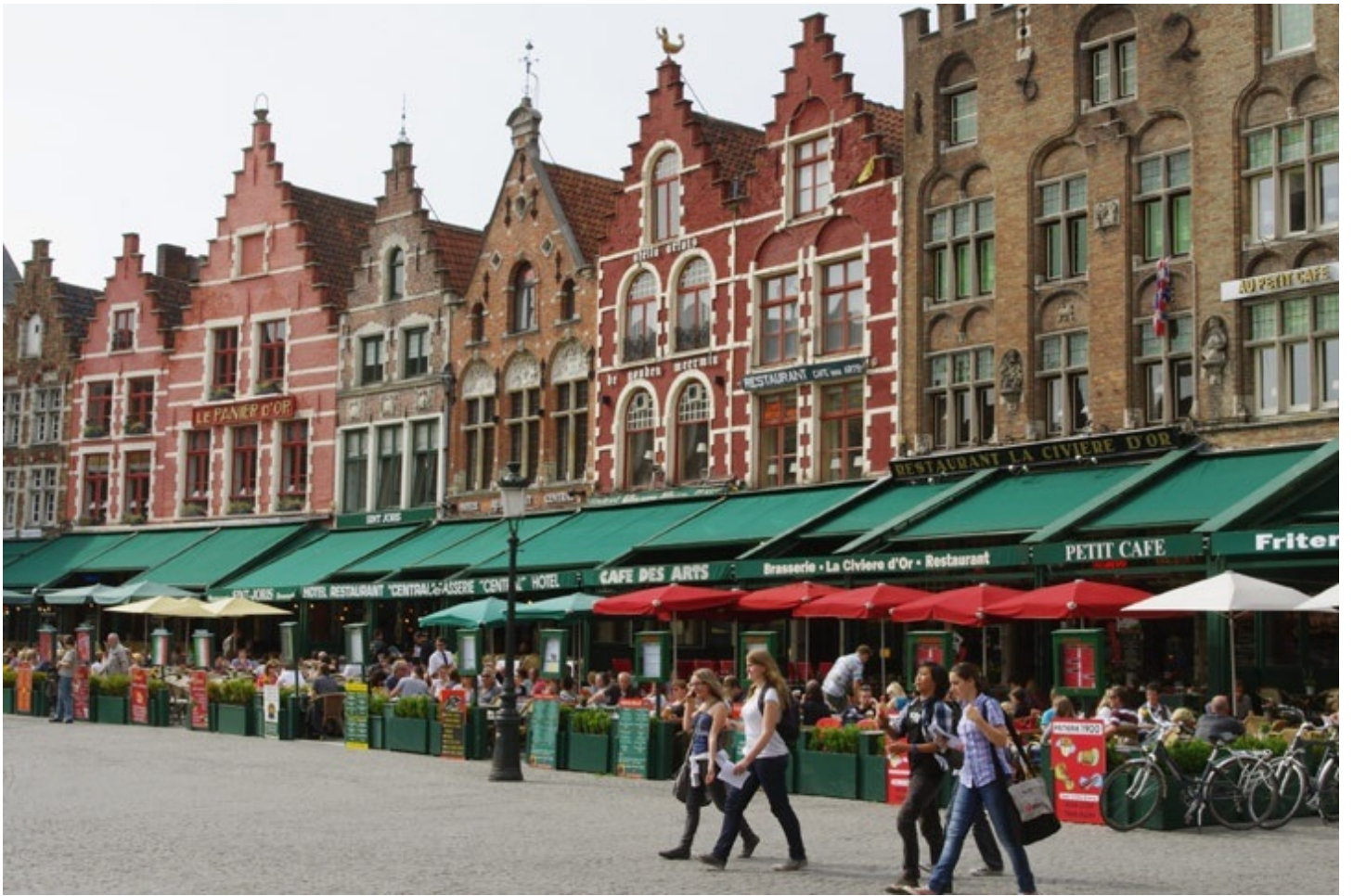
ブルージュの中心、マルクト広場。