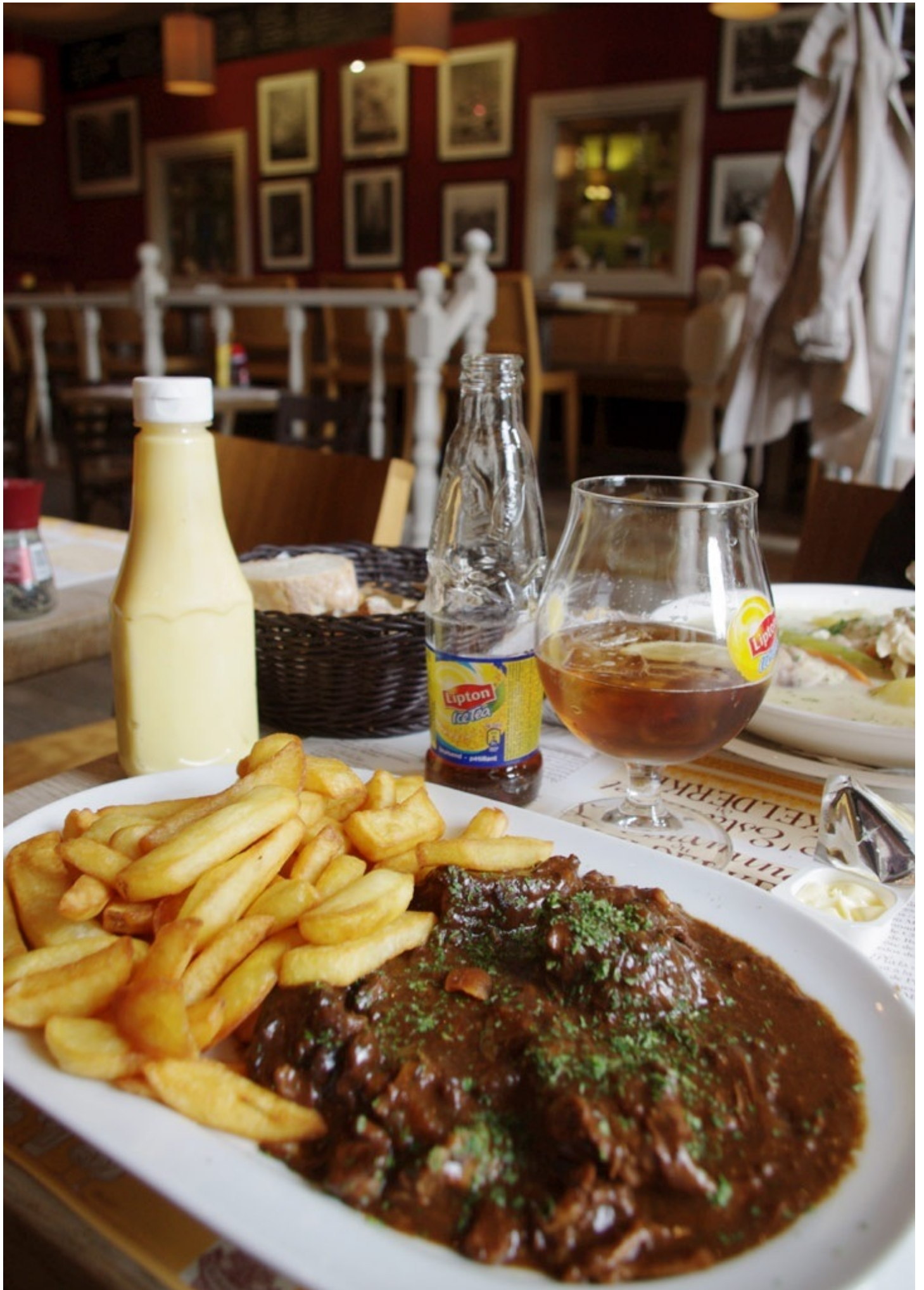
ベルギーの郷土料理「カルボナード」を頂きました。牛肉と玉葱のビール煮です。