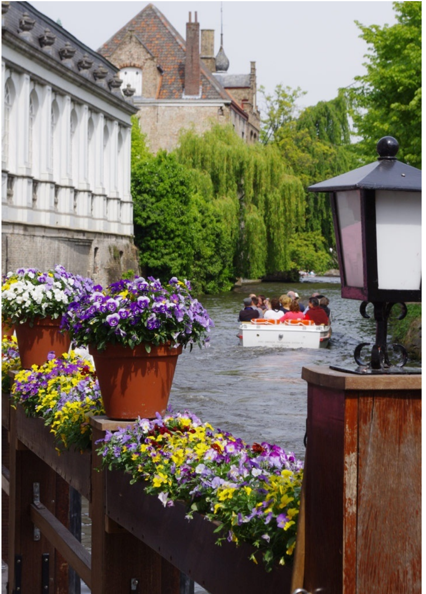
ブルージュの運河をクルージング。