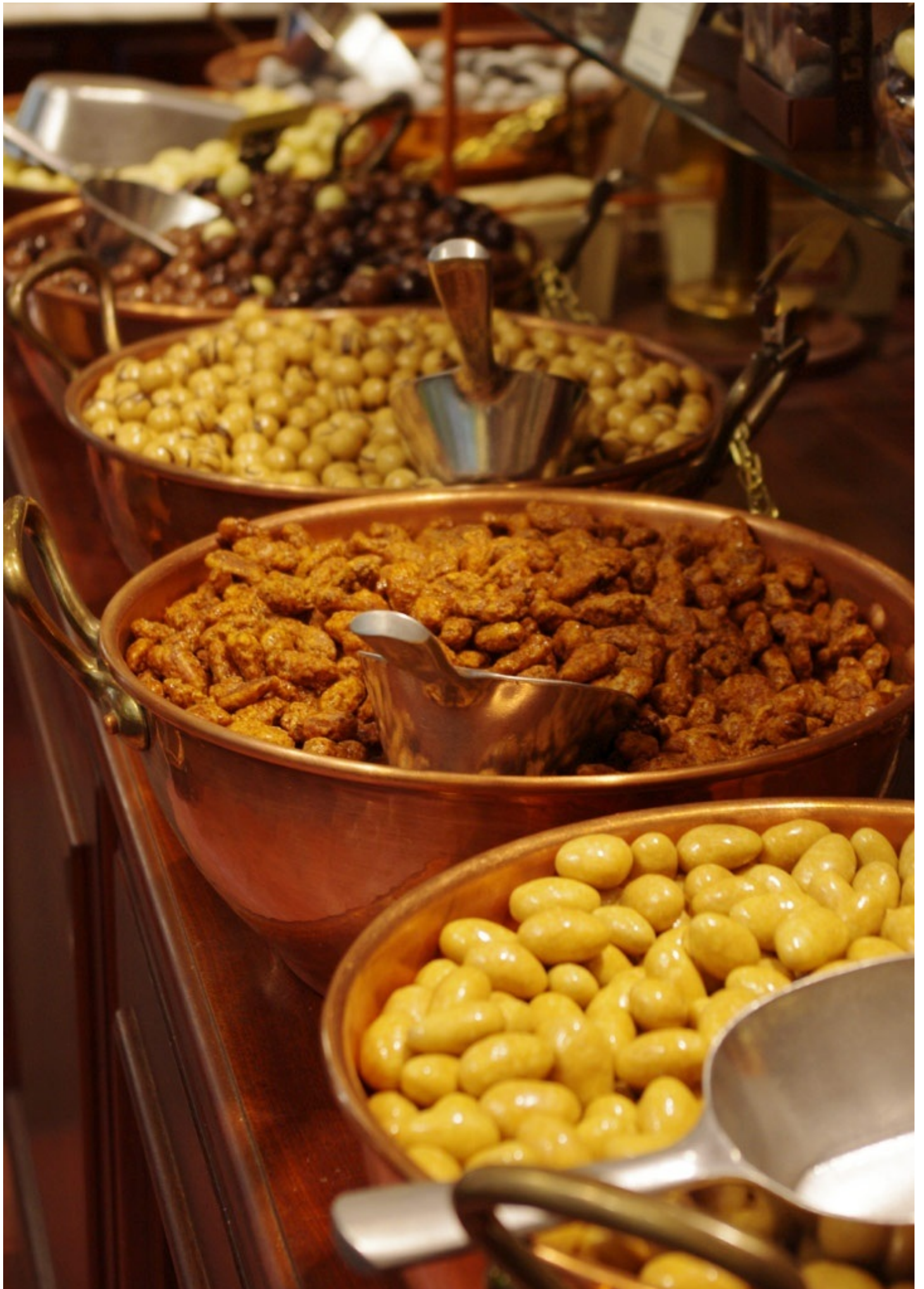
チョコレートの量り売り。店内は涼しく、甘い香りが充満しています。