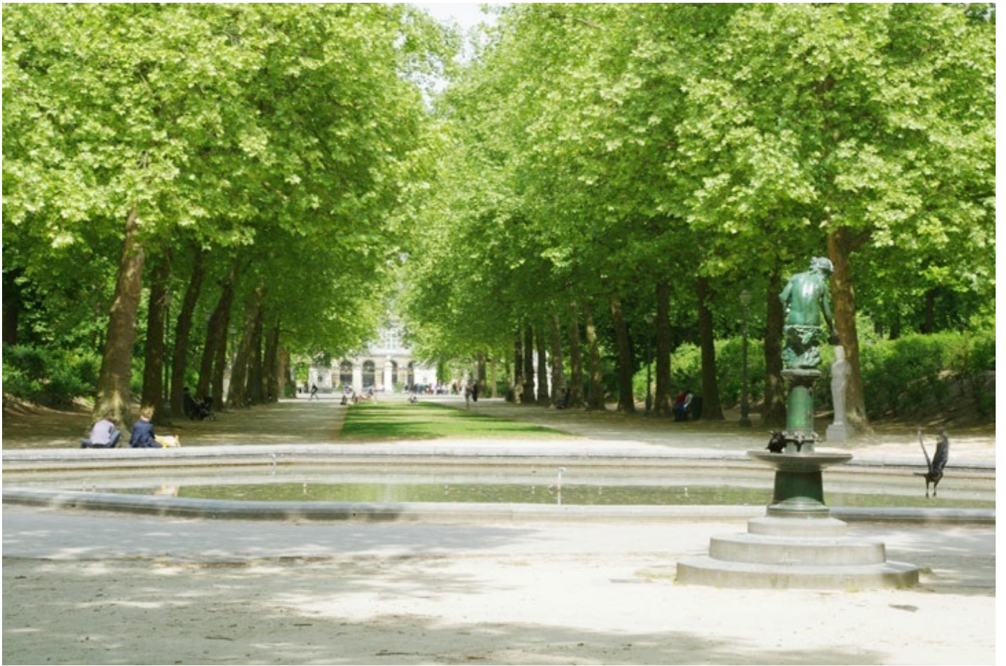
ブリュッセル公園。シンメトリーなフランス式の公園です。