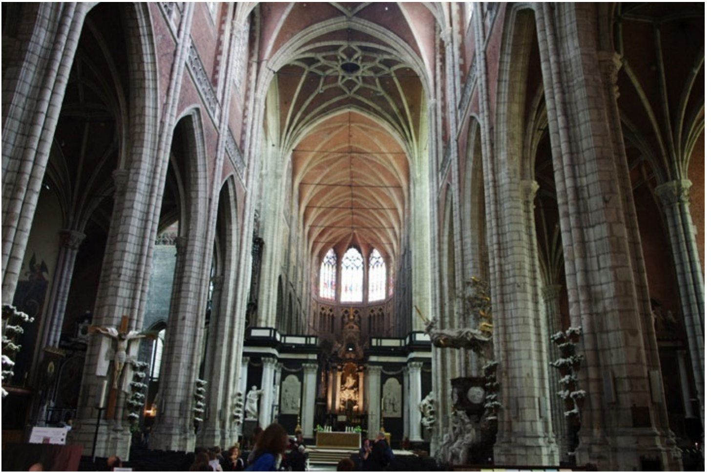
13～15世紀に建造された聖ニコラス教会。