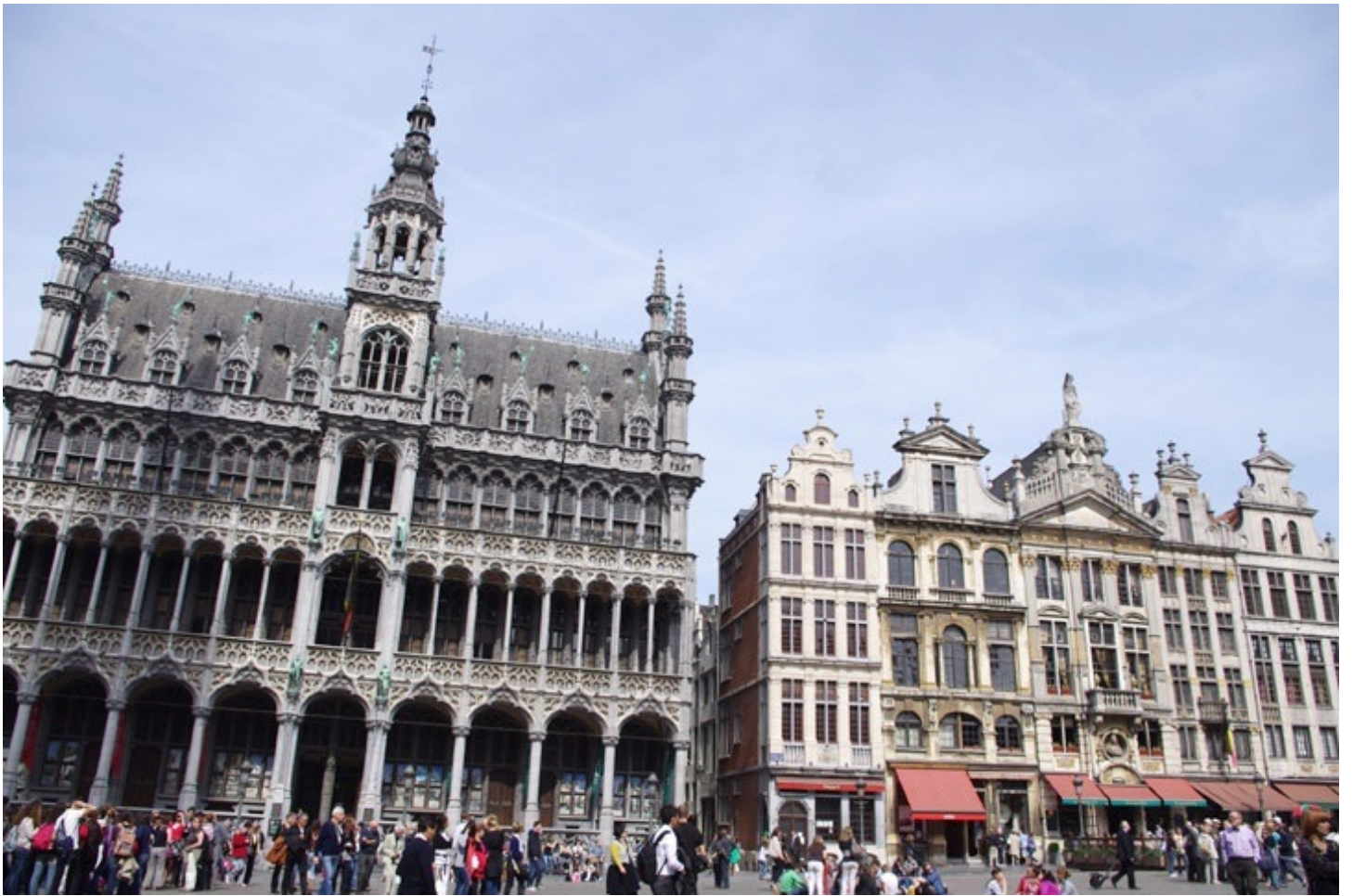
ブリュッセルの中心の広場、グランプラス。 豪華な建物で囲まれた景色は圧巻でした。