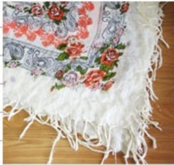
ゲントで買ったストール