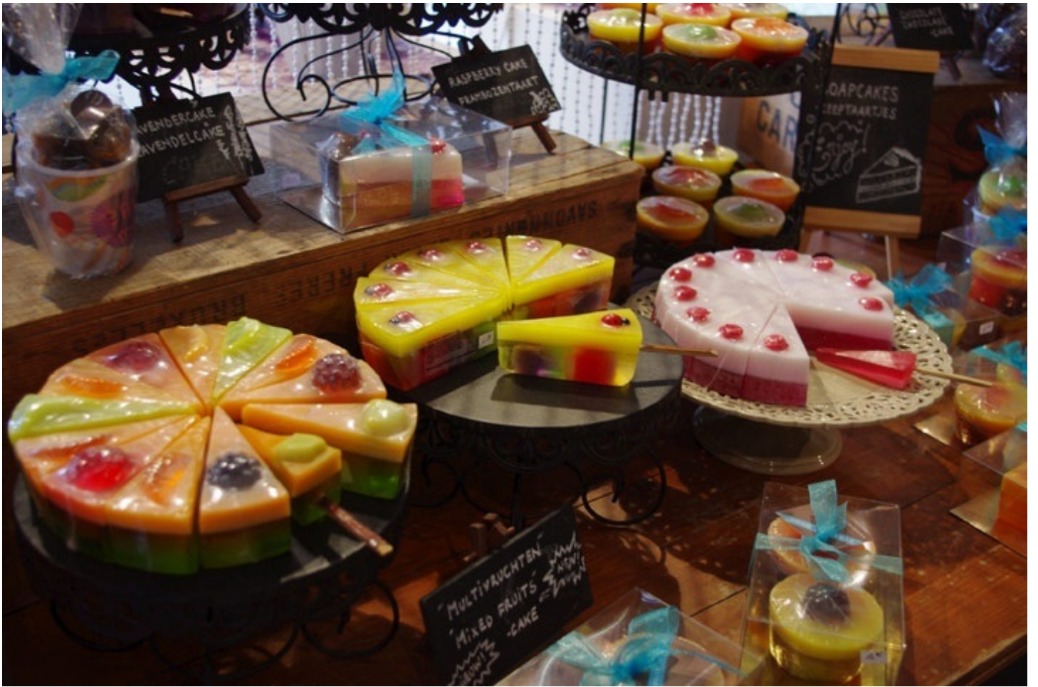
かわいい石鹸のお店がありました。おいしそう！