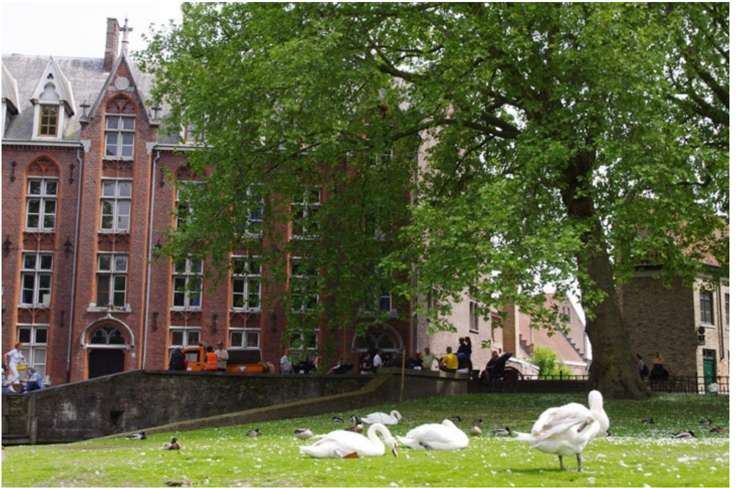
続いて、水の都ブルージュに行きました。「愛の湖公園」には白鳥がいました。