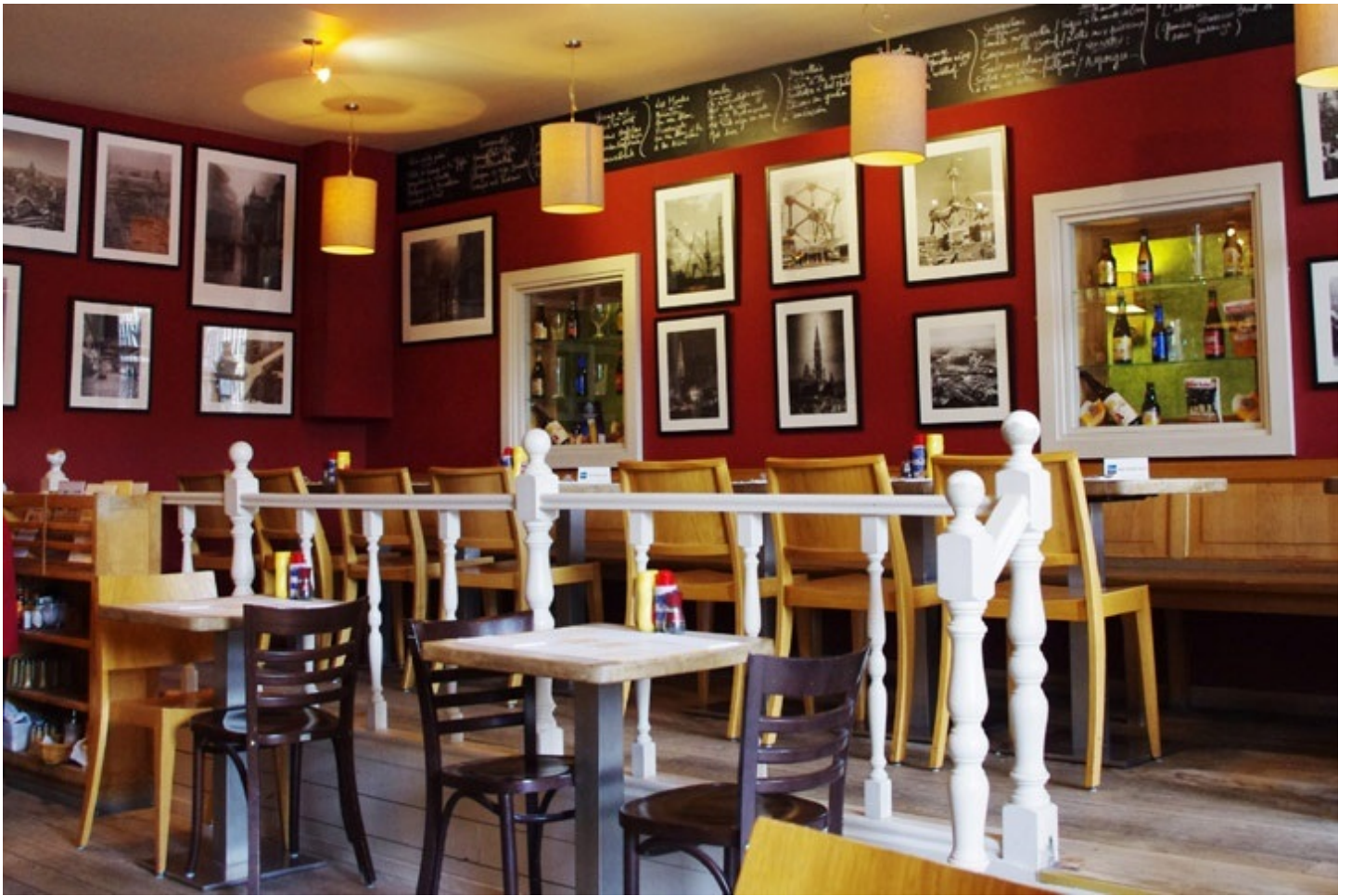
グランプラスの一角にあるレストラン「ケルデルケ」で夕食。 観光地なので、写真付きの日本語メニューもありました。