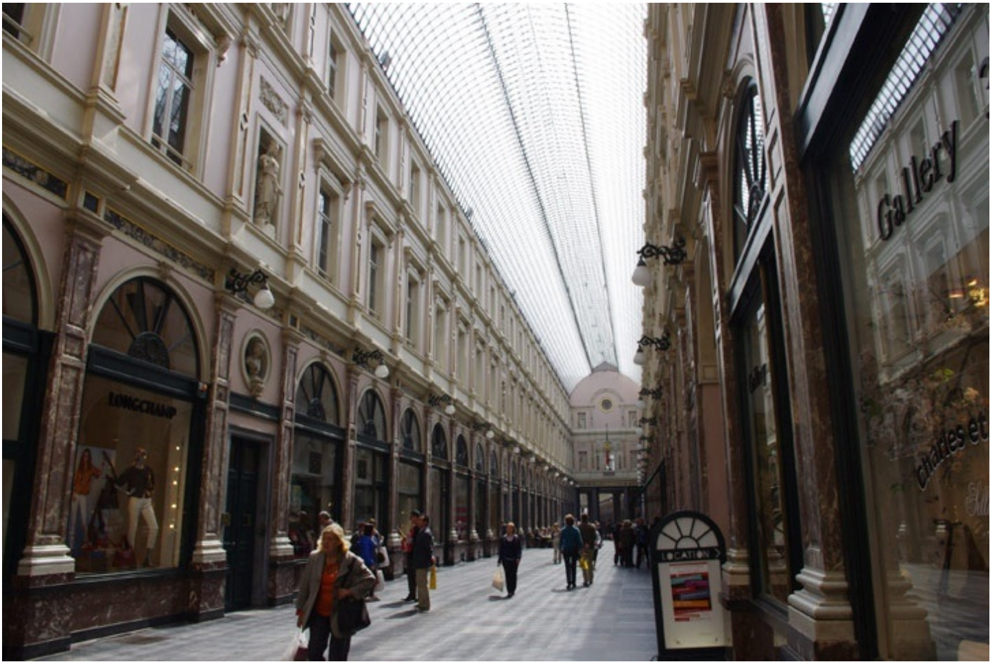
ヨーロッパ最古のアーケードの一つ、ガルリ・サンベチュール。 カフェ、土産物屋、本屋、ショコラティエなどが並びます。