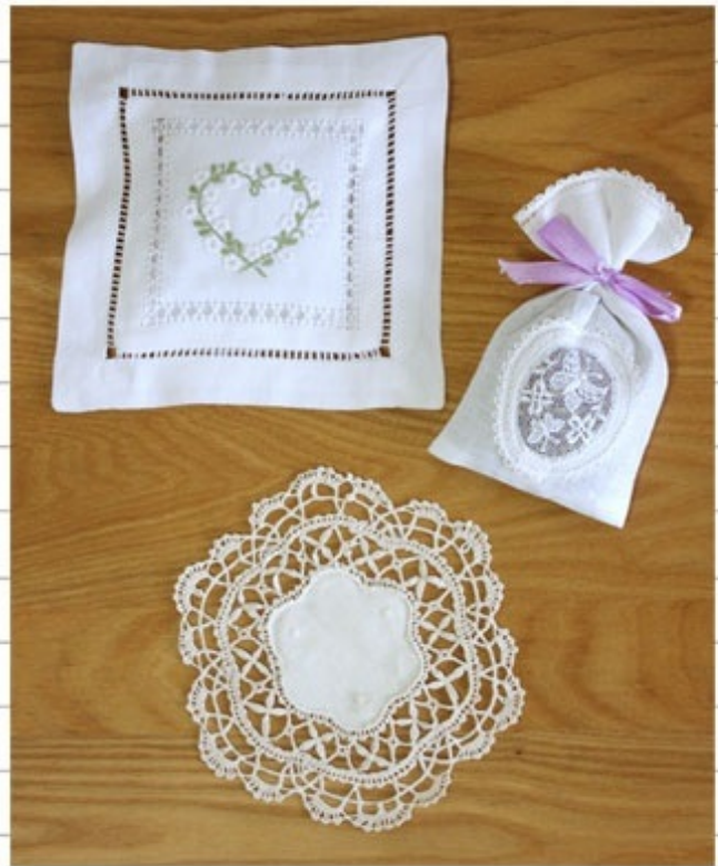
ベルギーのレースを使った ポプリとコースター