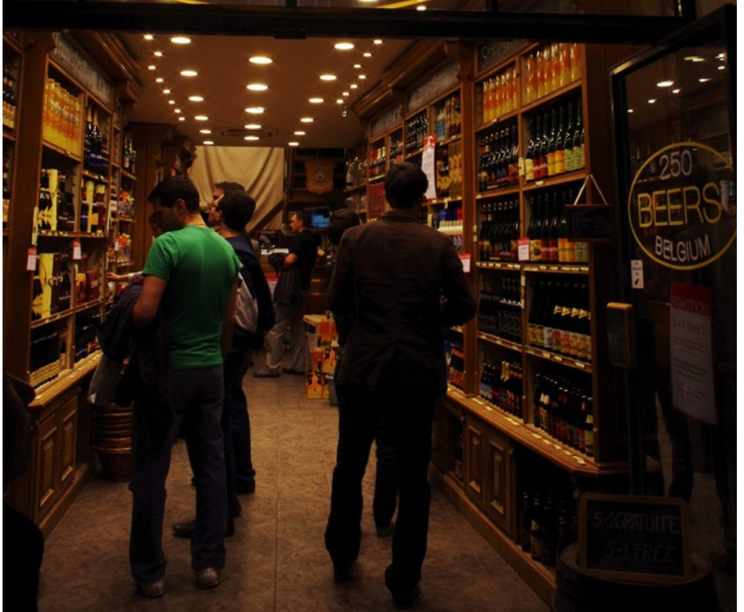
ビールの専門店でお土産のビールを選びます。