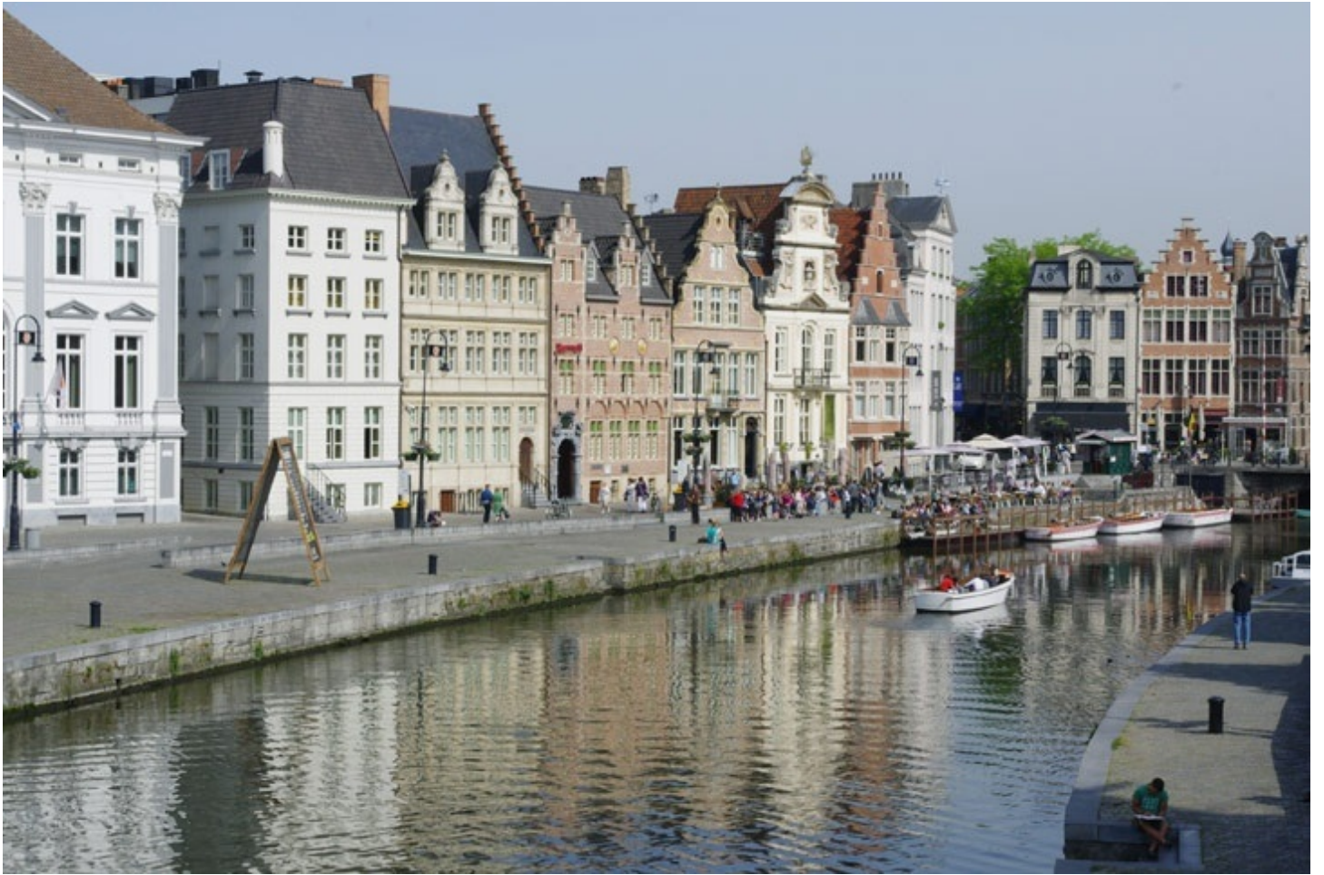
レイエ川に掛かる聖ミカエル橋からの風景。