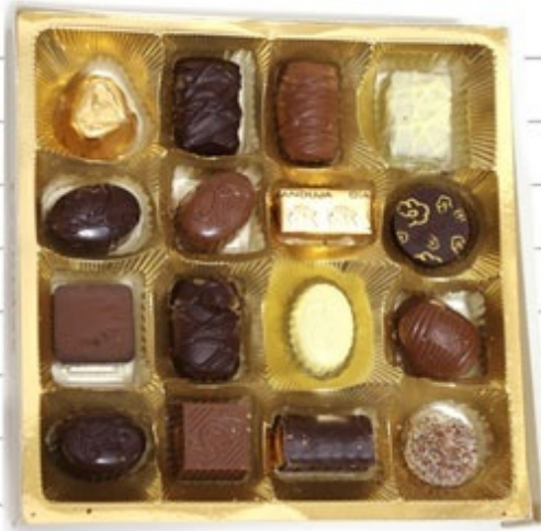
レオニダスのチョコレート