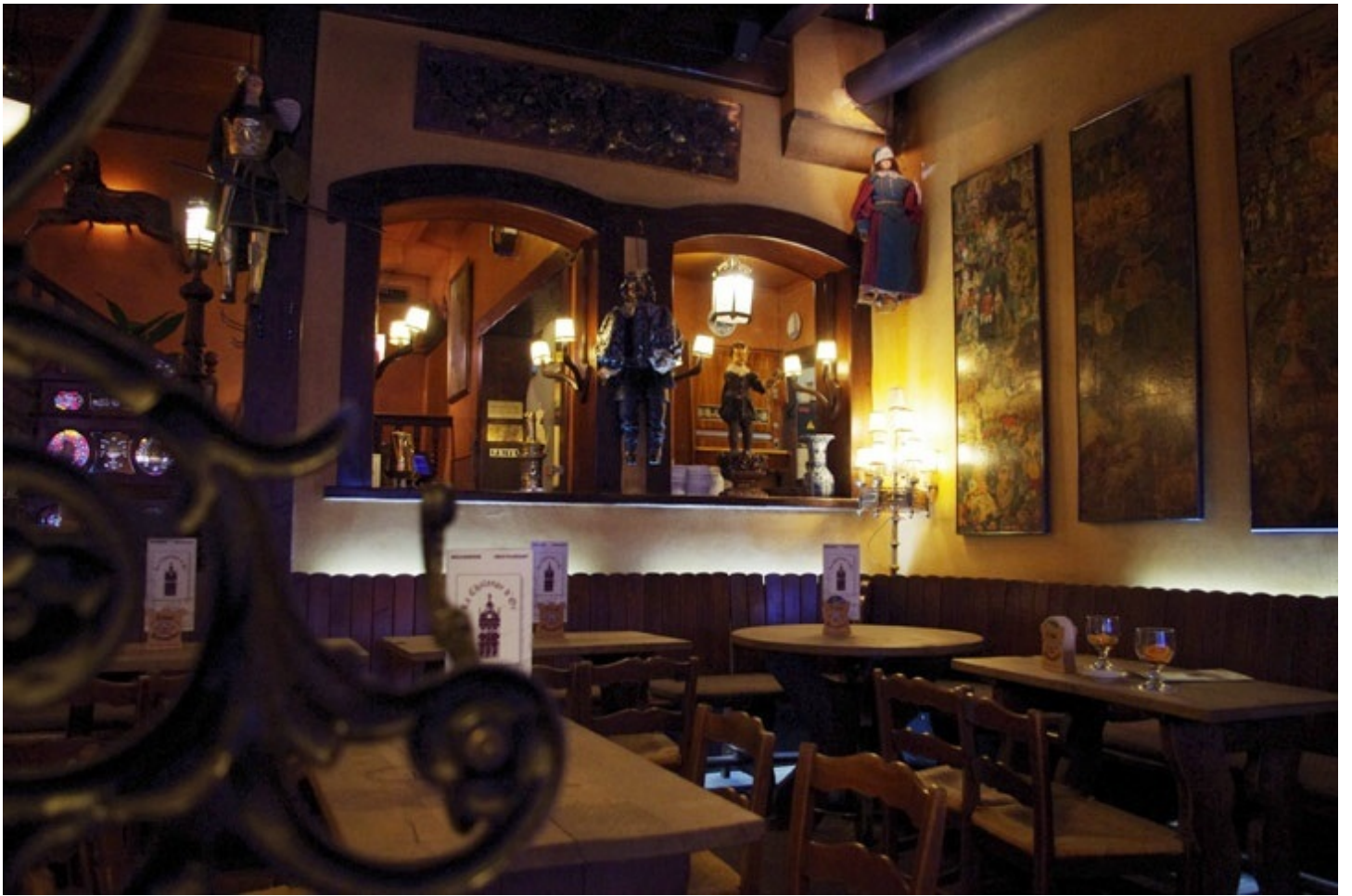
再びブルージュに戻って、ベルギービールを飲むバーに行きました。