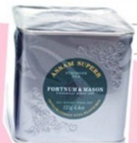
Harrods と FORTNUM&MASON の紅茶