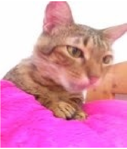
始まるよーん♪ぺろん