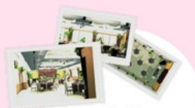
会場レイアウトの作成。CG(コンピュータグラフィック)で会場コーディネートのイメージ化を致します。

会場という箱の中だけのプランナーによる結婚式以上に、箱というかまされたものがない自由で幅広い結婚式ができ、もちろん世界でたったひとつだけのふたりの結婚式を、白紙のスケッチブックへデザインしていきます。また、しがらみがないため、費用やアイテムも、思い通りに、予算内で素敵にふたりだけの結婚式ができると確信しています。