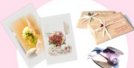
真っ白なスケッチブックにふたりの想いをデザインする。そんな自由でステキな結婚式をプロデュースしています。