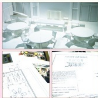
上:披露宴会場の模型。左下:レイアウト図面とイメージ台本。右下:進行台本。

結婚式のイメージをよりビジュアルにわかりやすく、立体的に表現するツール。『ウェディング・プレビュー』建築をデザインするように、ふたりの目線になって一から結婚式をつくるから、挙式・披露宴の台本をつくりBGMや照明の演出をチェック。会場レイアウトを図面や模型でチェック。トータルコーディネートでCGでチェック。など、とってわかりやすくイメージが伝わる。打合せごとに、少しずつ形となっていくふたりの結婚式を、この『ウェディングプレビュー』で確認できる。そして、プランナーもスタッフも自信を持ってサービスできる。新郎新婦も当日までイメージがわからない！なんて、不安は解消！世界にたったひとつのふたりだけの結婚式が、とっても楽しみに！