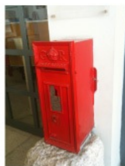
イスラエル (パレスチナ)