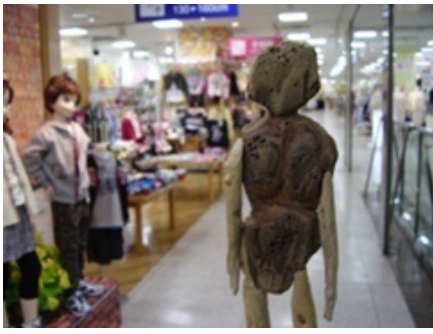
ある日 大きな音がして