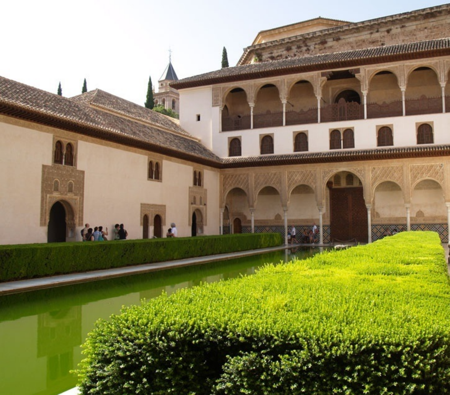
コマレス宮アラヤネスの中庭。