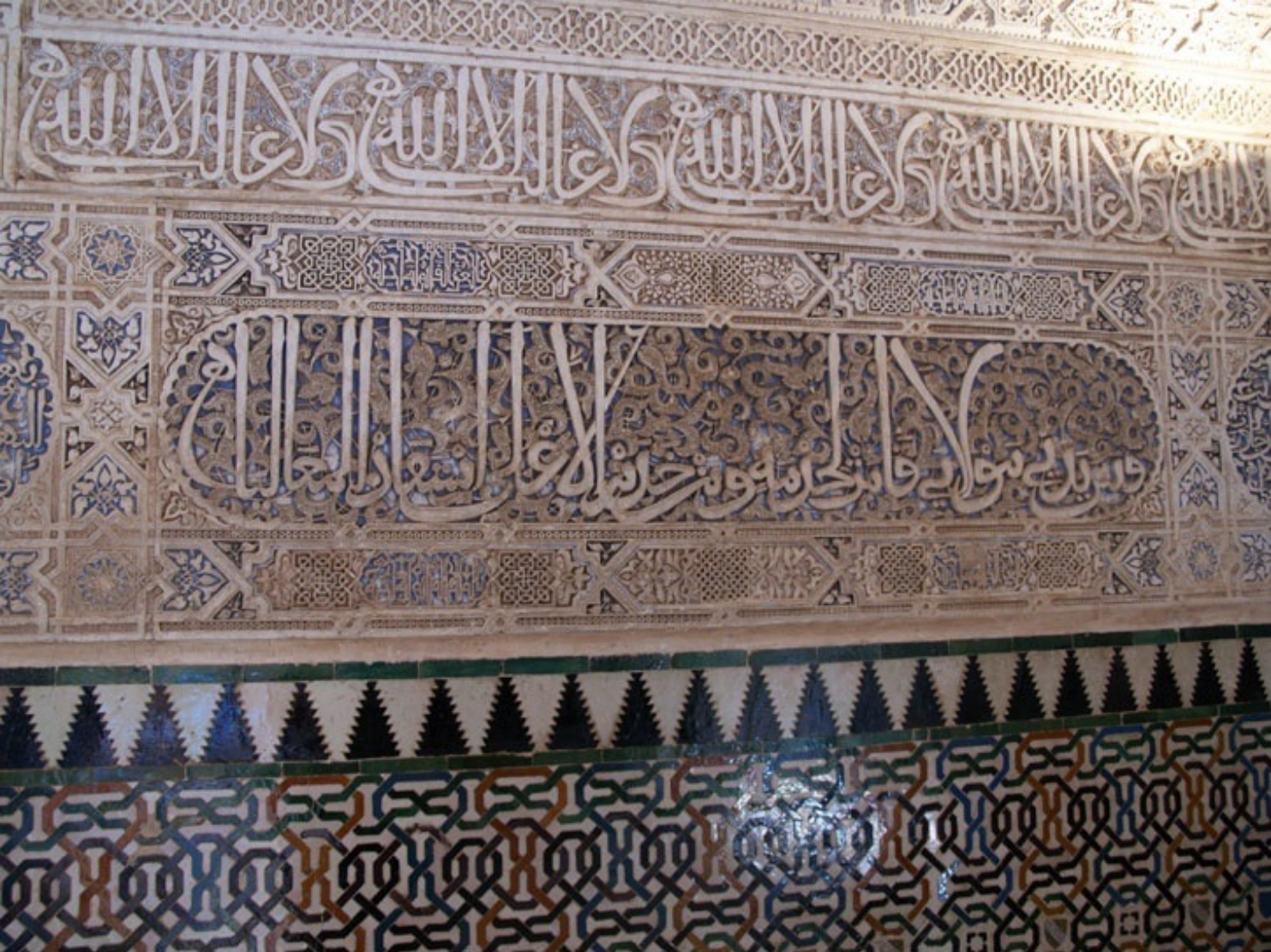
このモザイクタイルの上は、詩が書かれているらしい。