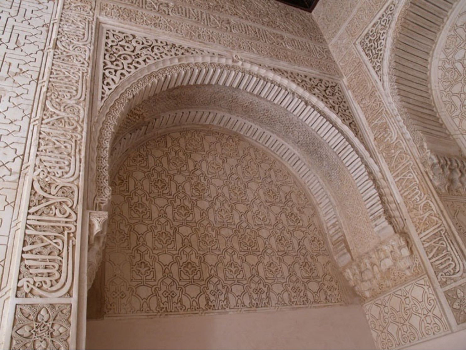
庭の周囲を取り巻く装飾。