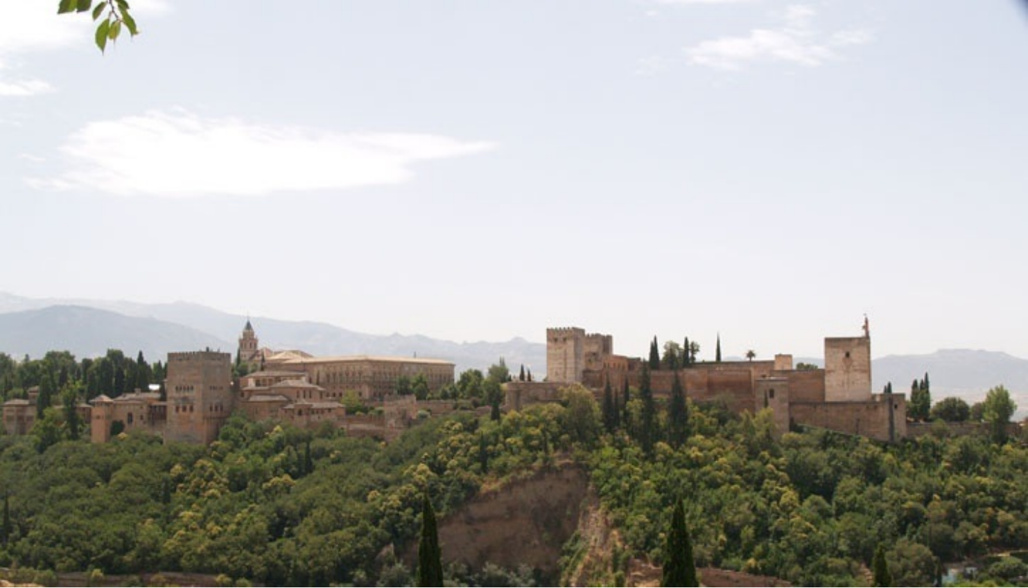
アルバイシンの丘の途中から見たアルハンブラ宮殿全景。