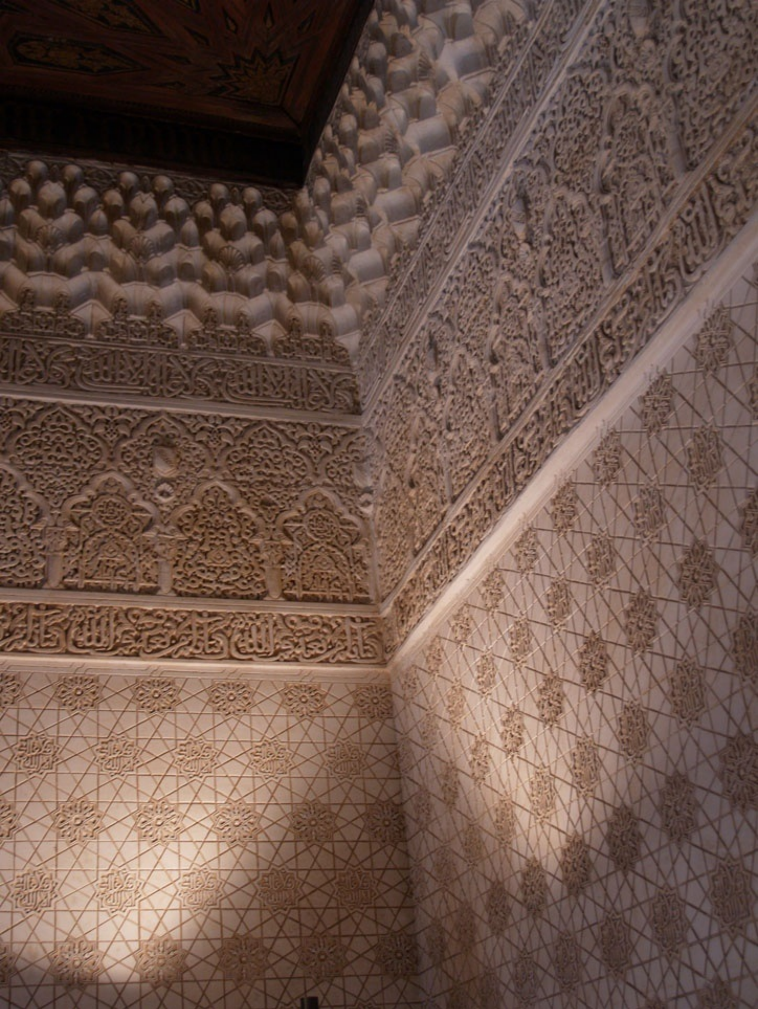
ファサードを入ったところ。暗くて見づらいが、天井は寄木細工。