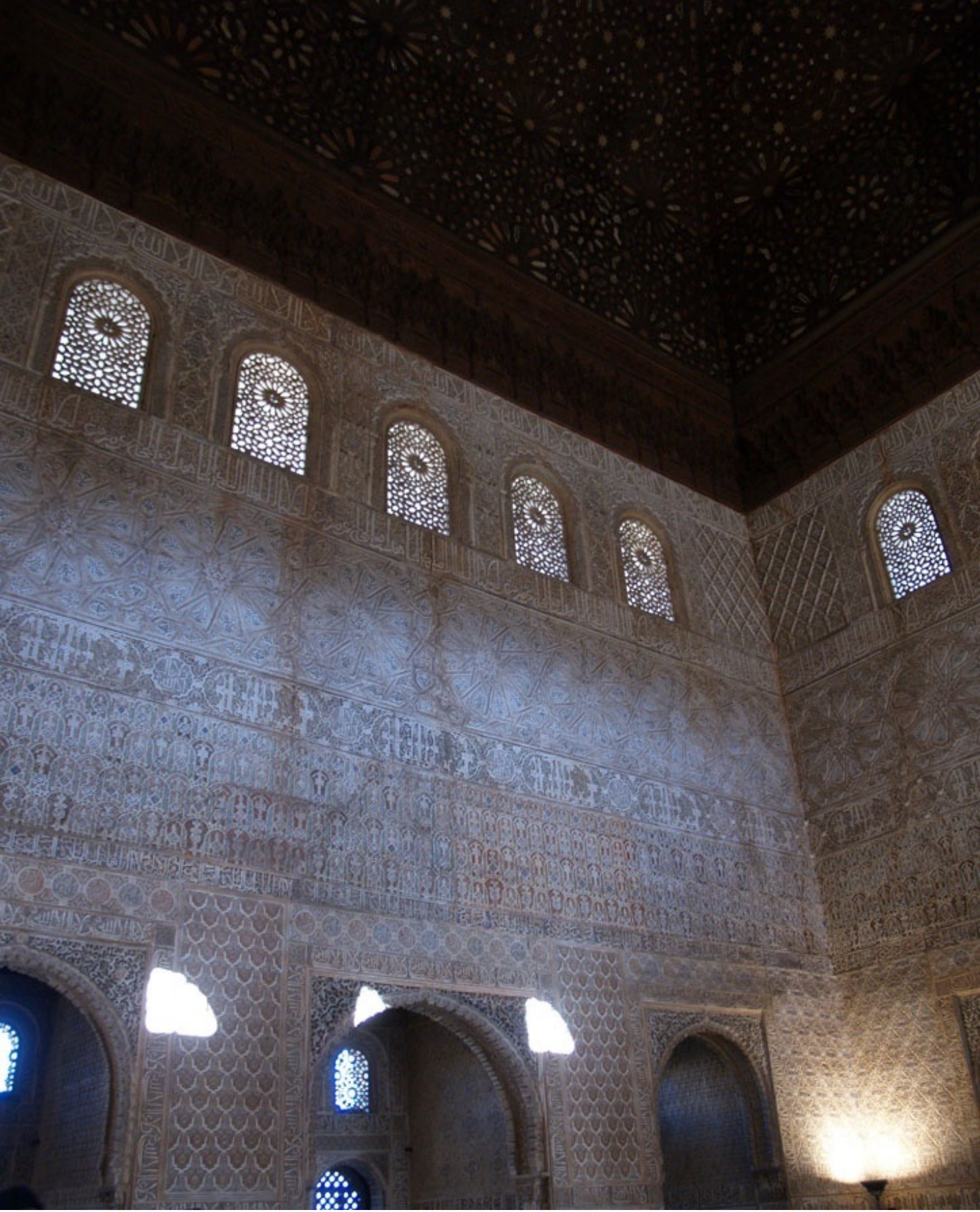
コマレス宮 大使の間。ここも天井は寄木細工。