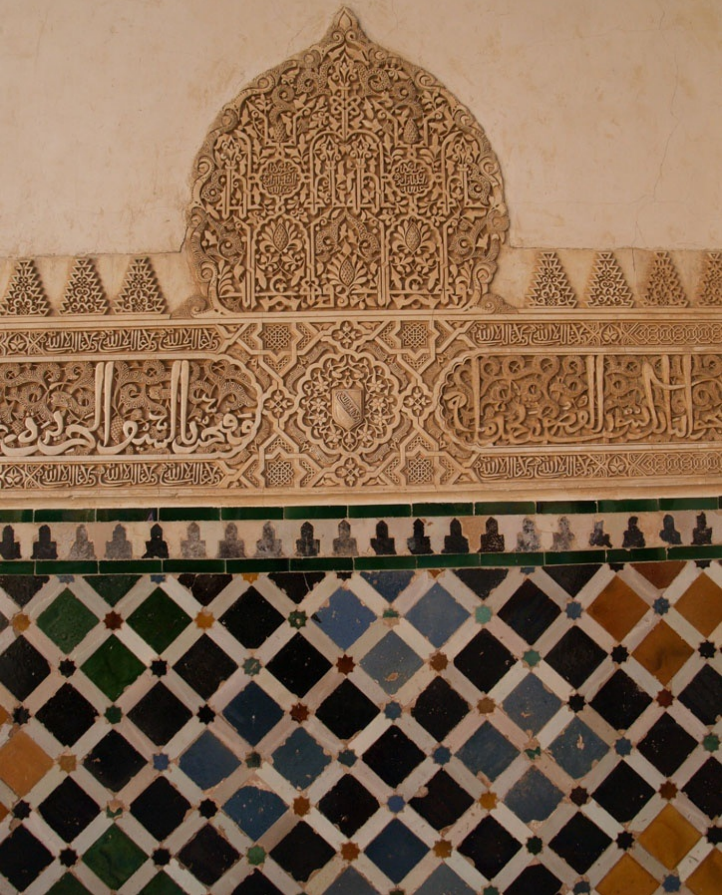
壁の下部がタイルのところも。