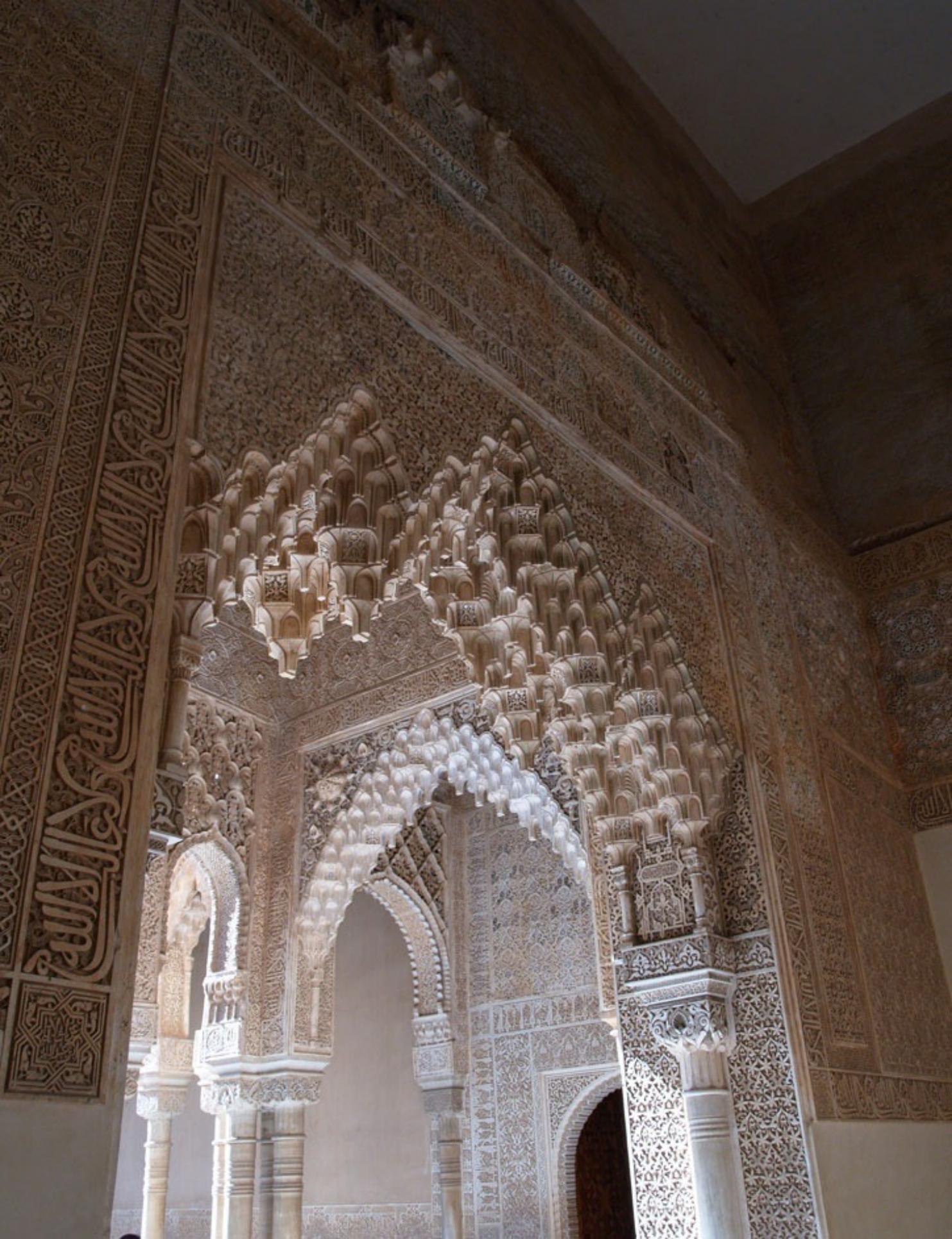
鍾乳石飾りの間から、ライオンの中庭へ続くアーチ。