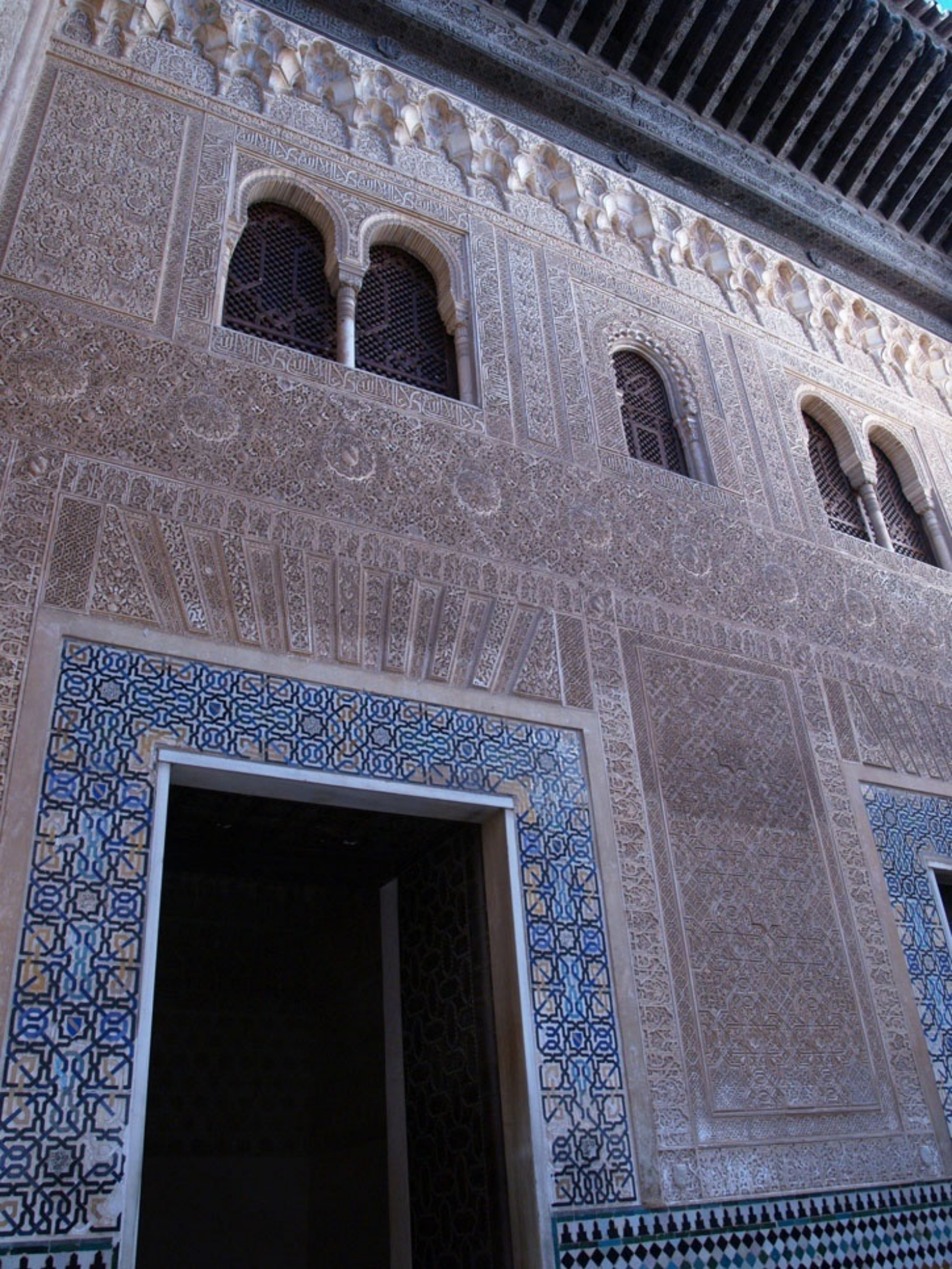
メスアールの中庭のコマレス宮ファサード。ここから、コマレス宮へ。