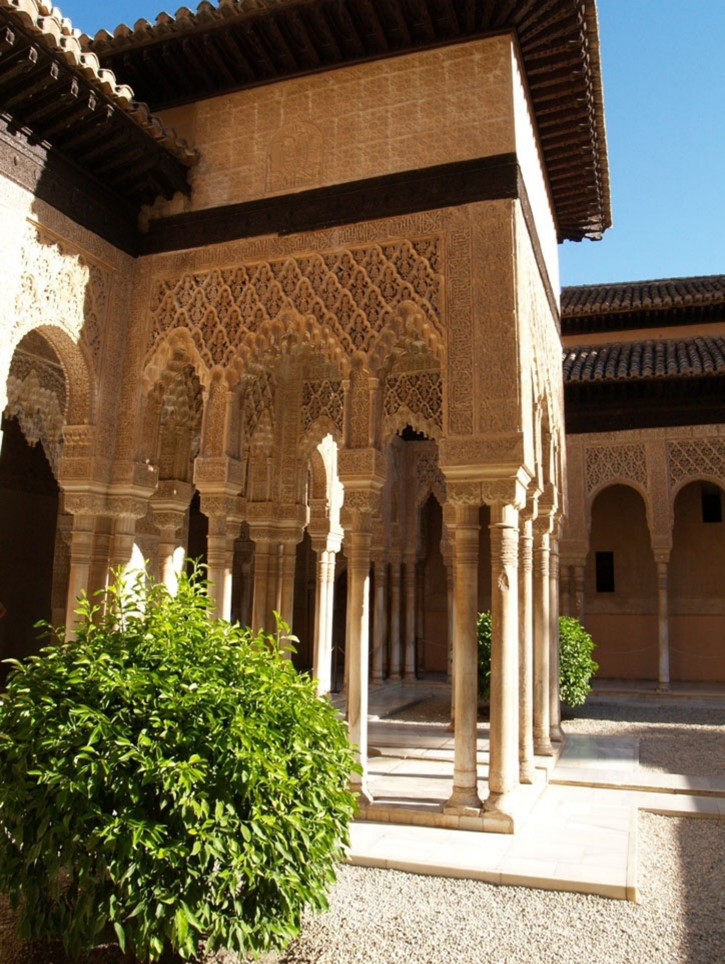
ライオンの中庭を囲む回廊の張り出し部分。