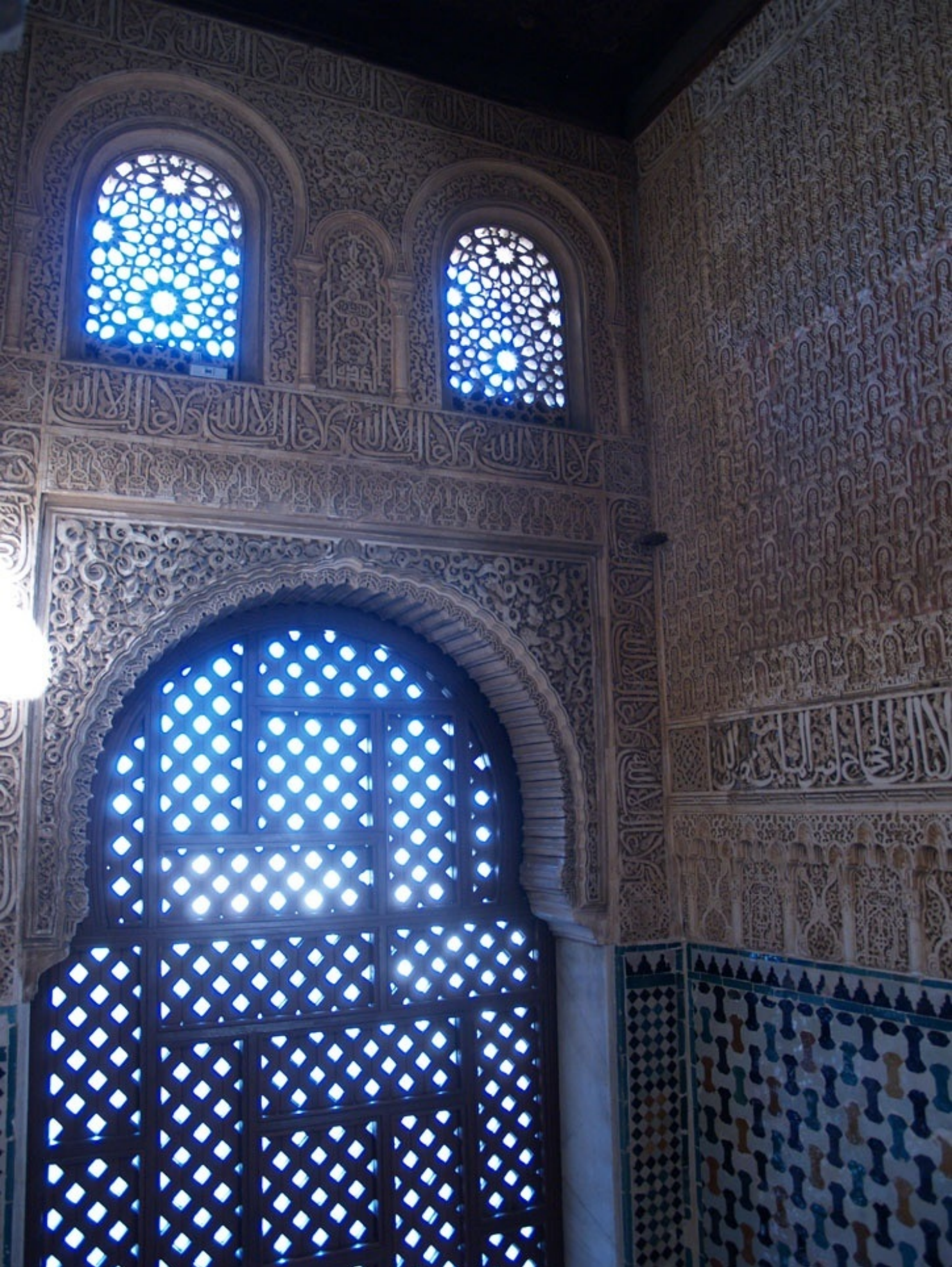
寄木細工の窓から差し込む光。