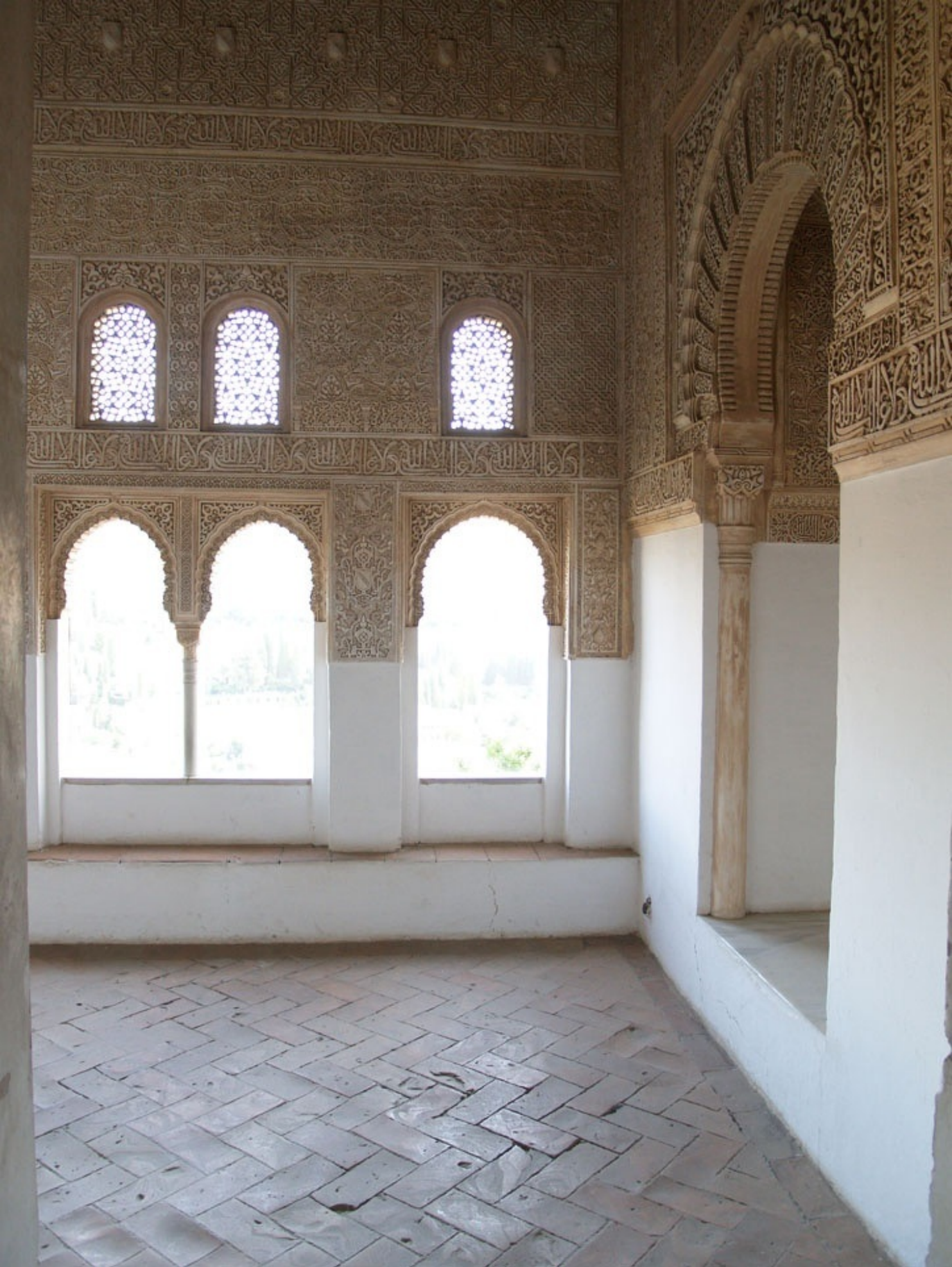
ナスル朝宮殿 メスアールの祈禱室。