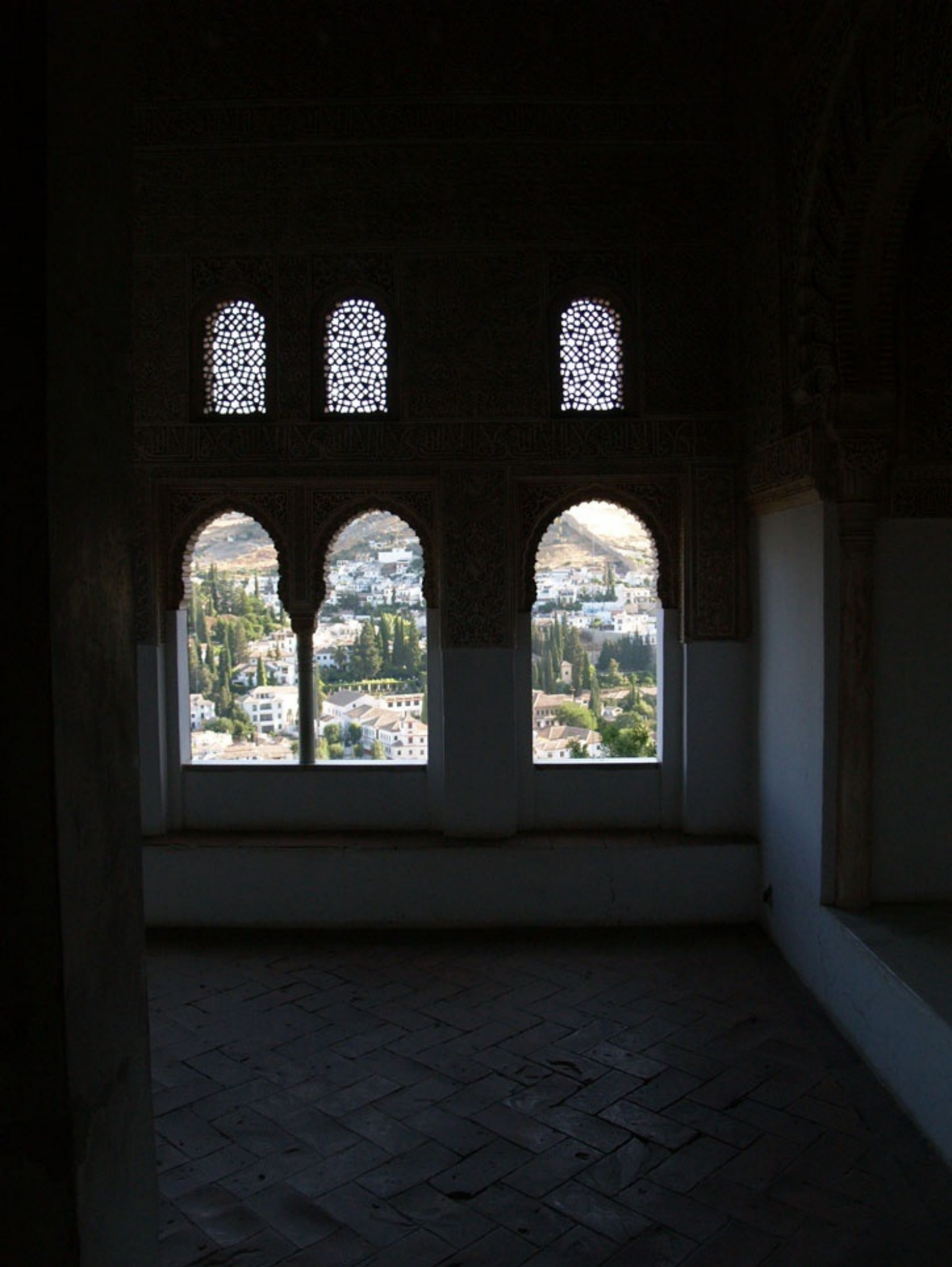
祈祷室の窓からアルバイシンを望む。