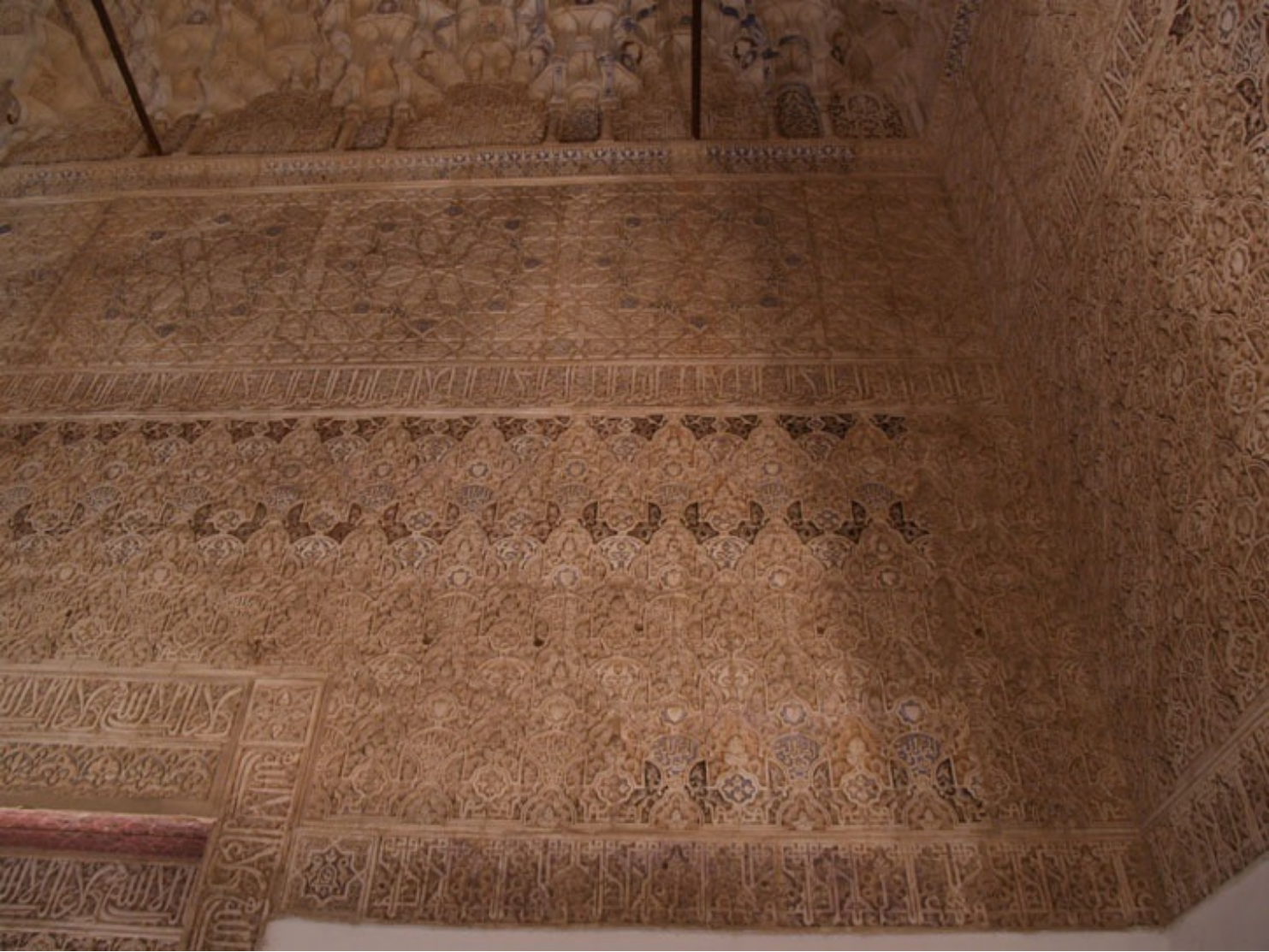
壁から天井まで、途切れることのない装飾。