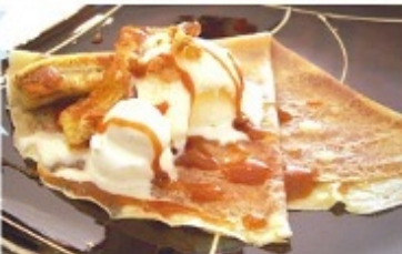
キャラメルバナナスペシャル 500円