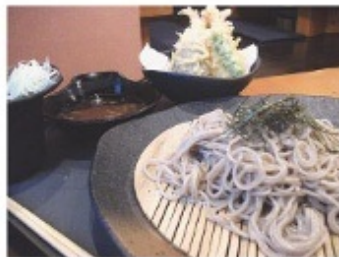
海老天ザルそば 850円

注文してからそばを延ばし、一つ一つ茹でるのでコシのあるしっかりした十割そばが味わえます。ザルたれは「福寿の国産丸大豆醤油」を、かけそばのつゆには比内地鶏のガラを使用した鶏ダシです。