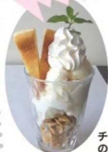
チーズケーキのパフェ 650円 和風抹茶と黒ゴマのパフェ 550円

住所/大館市向町20 TEL/0186-59-7822 営業時間/11:30~14:30(L014:00) 定休日/月曜日