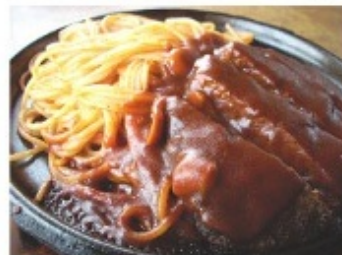
ハンバーグスパゲッティ(ナポリタン) 840円 ※ミートソースもあります。

ナポリタンとデミグラスソースがかかったハンバーグが熱々の鉄板にジュウジュウ音を立てながら運ばれて来ます。ハンバーグはカットされていて食べやすく、とってもフワフワで柔らかくてソースとの相性バッチリ。