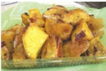
大学芋 100g 100円

硬くなく冷めてもおいしい50年前からの味を作り続けている、サービスのいいお話し好きなおばあちゃんのお店です。