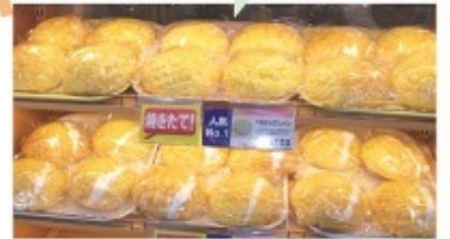
ホイップメロンパン 160円

ふわふわのパン生地とたっぷりの生クリームがとっても相性がよく、土日ともなると予約で殺到!!