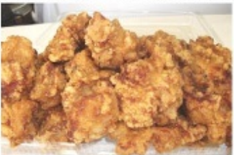
からあげ 5個入り 200円~