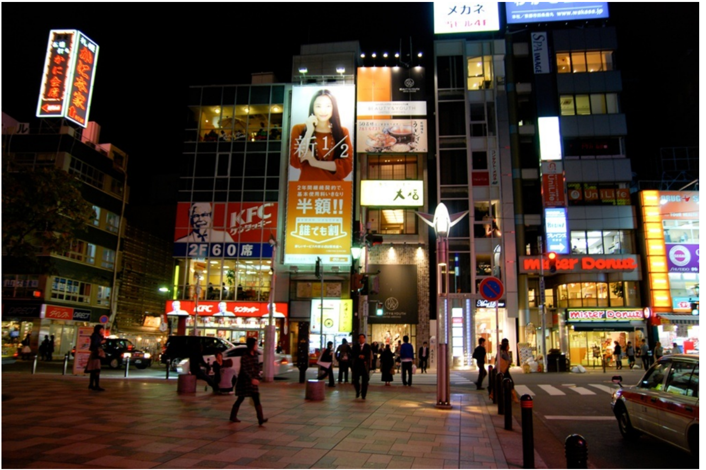
待ち合わせは、ここ岩田屋前が有名らしい。