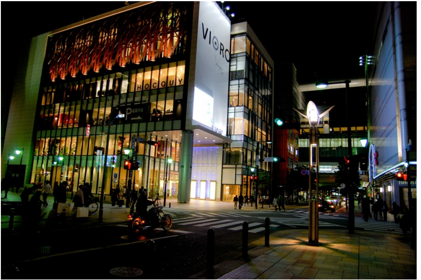
おしゃれで綺麗な街、天神。 九州一という名は誇大でない。