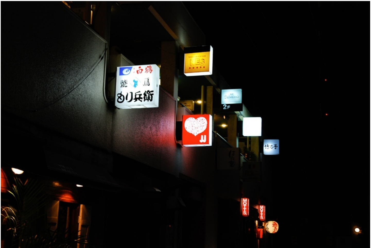
味わい深い看板たち。