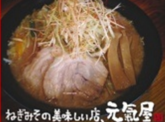
ねぎみその美味しい店、元氣屋