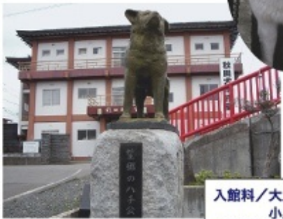
名犬シロが お出迎え。