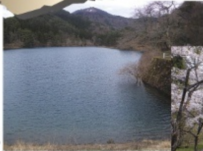
3,000本の桜が咲き乱れます!!