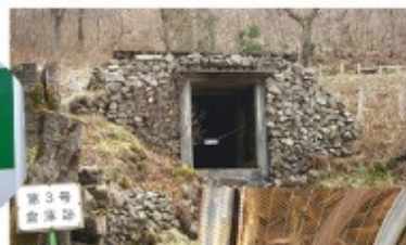
夏は涼みにぎわいま