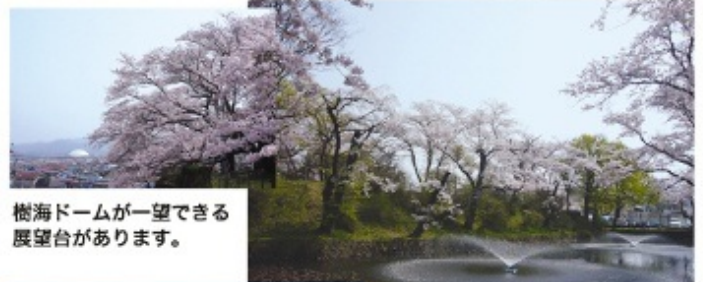
樹海ドームが一望できる 展望台があります。