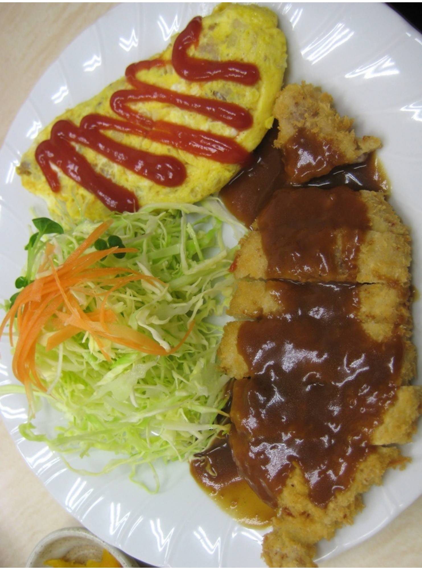
大阪市中央卸売市場の食堂の日替わり定食