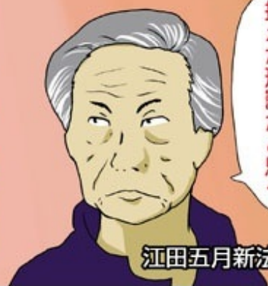
江田五月新法務大臣