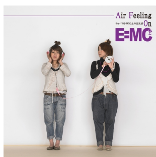
発色！ ひと繋がり Ties