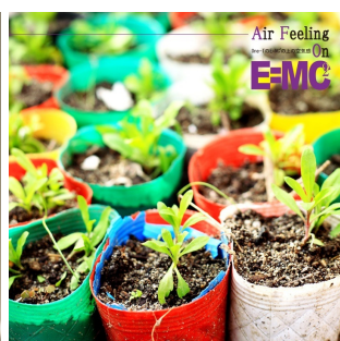
E=MC 2 の上の空気感 ～人という字は支え合っているVer.～