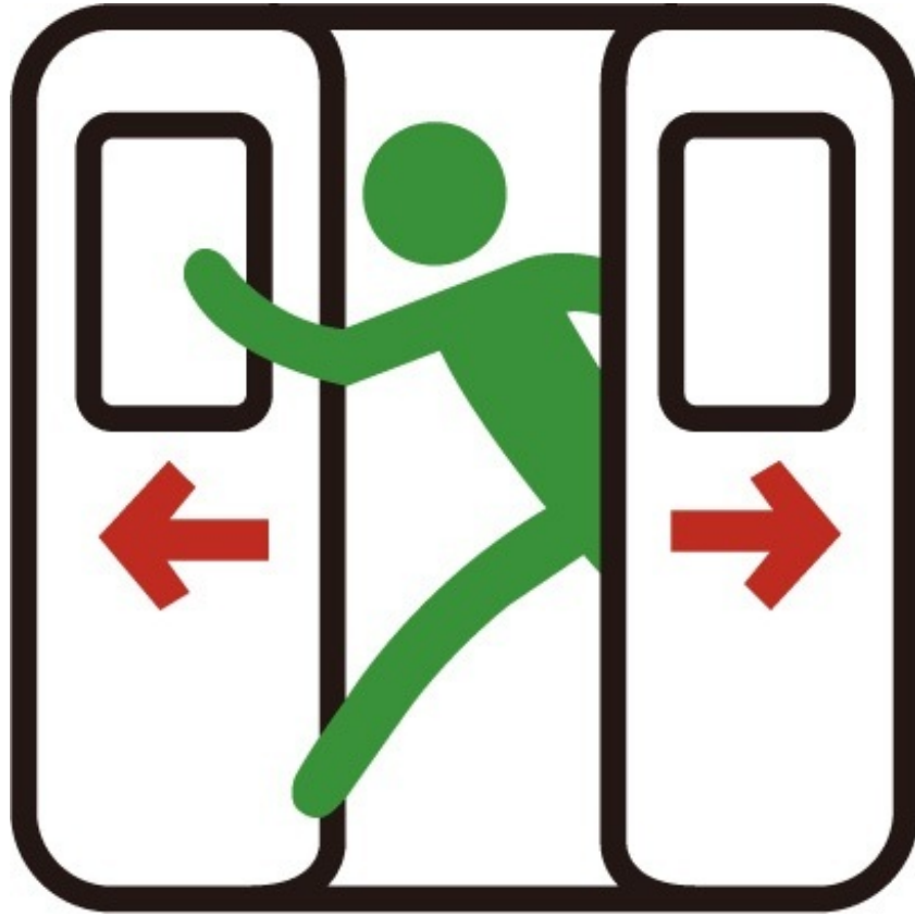
no.6 かけこみ降車禁止

急いで電車から降りるのはやめよう、もうすぐだから、大丈夫だから、 トイレに行きたいと思ってることがバレないようにしよう、 という思いやりの気持ちをカタチにしてみました。