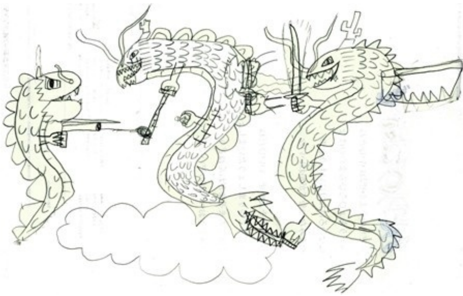
コドモリュウとオッサンリュウとフシンシャリュウ