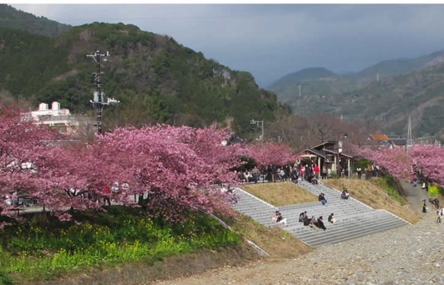
河津桜の春一番 Kawazuzakura 2011, Sizuoka