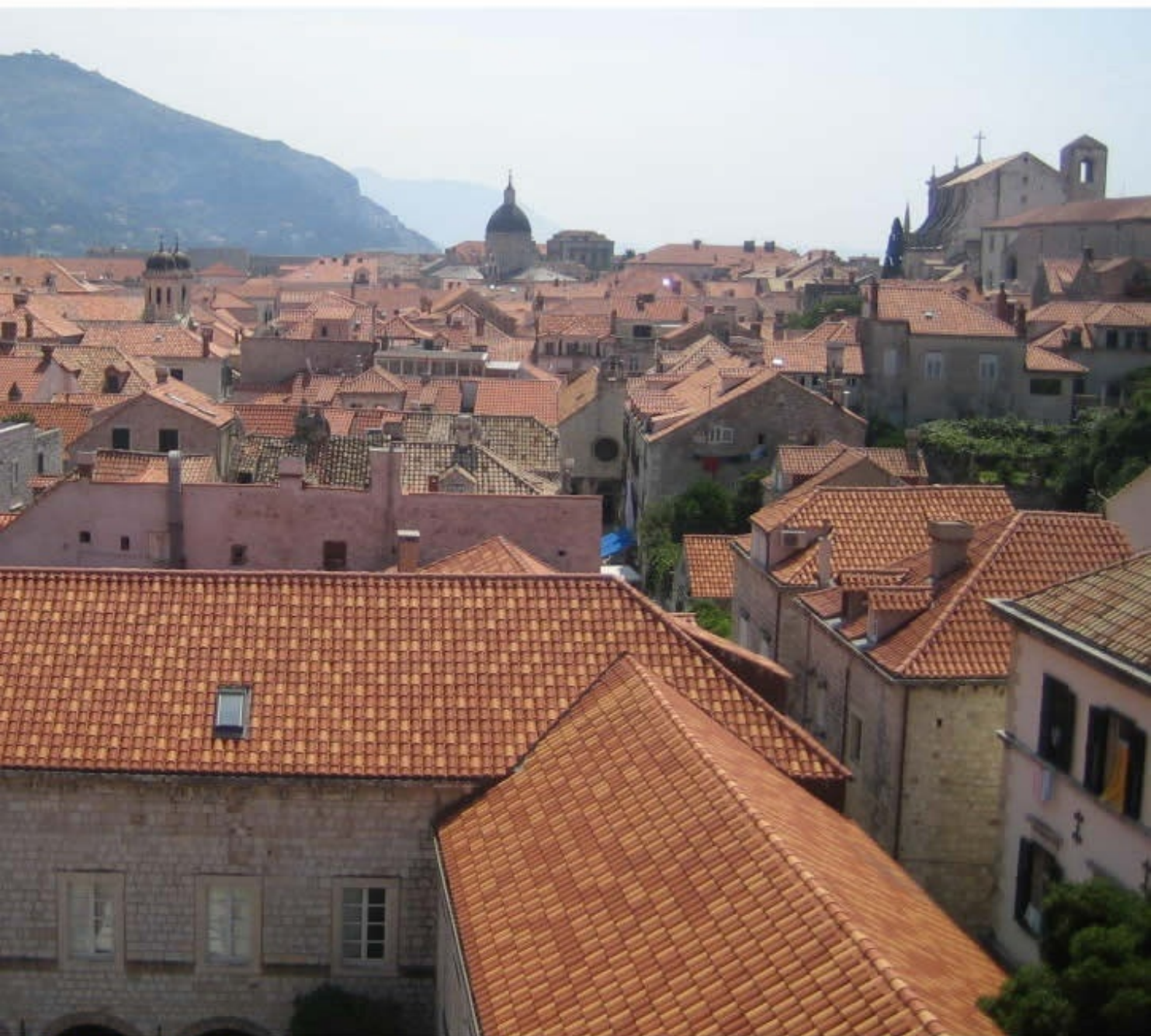
自由都市「ドブロブニク」 Old City of Dubrovnik, Croatia