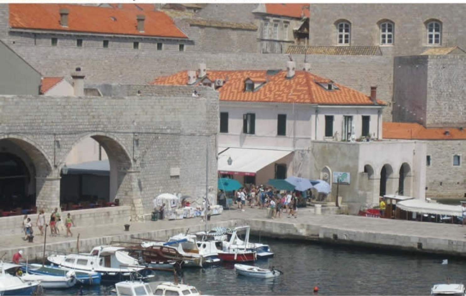
Dubrovnik Old City of Dubrovnik, Croatia