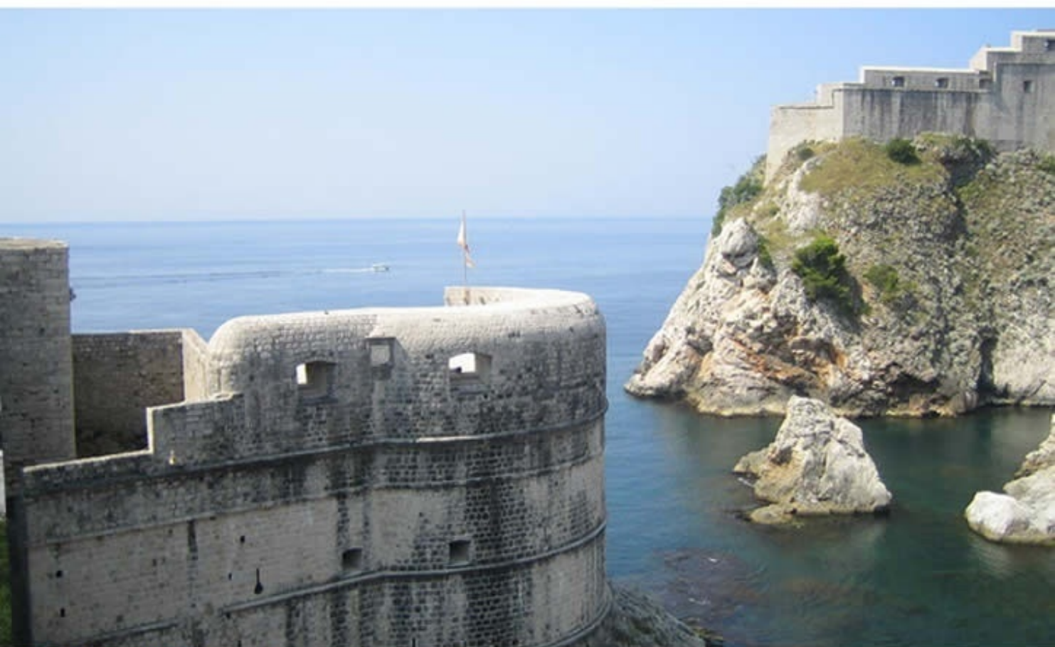
自由都市「ドブロブニク」 Old City of Dubrovnik, Croatia