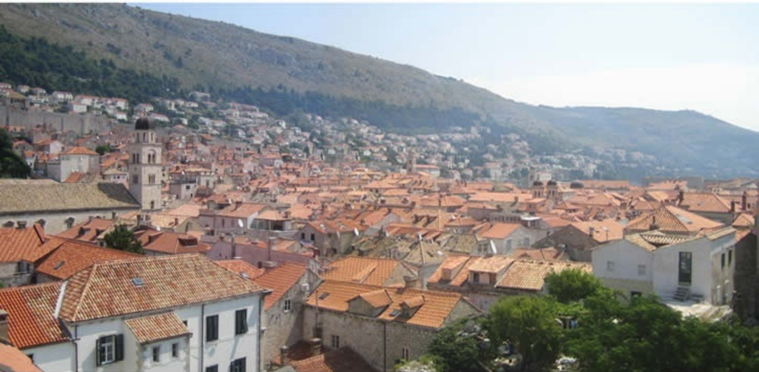
Dubrovnik Old City of Dubrovnik, Croatia