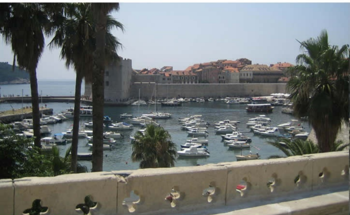
自由都市「ドブロブニク」 Old City of Dubrovnik, Croatia