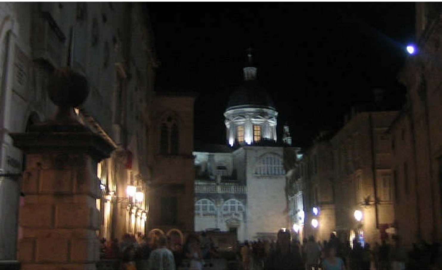
自由都市「ドブロブニク」 Old City of Dubrovnik, Croatia