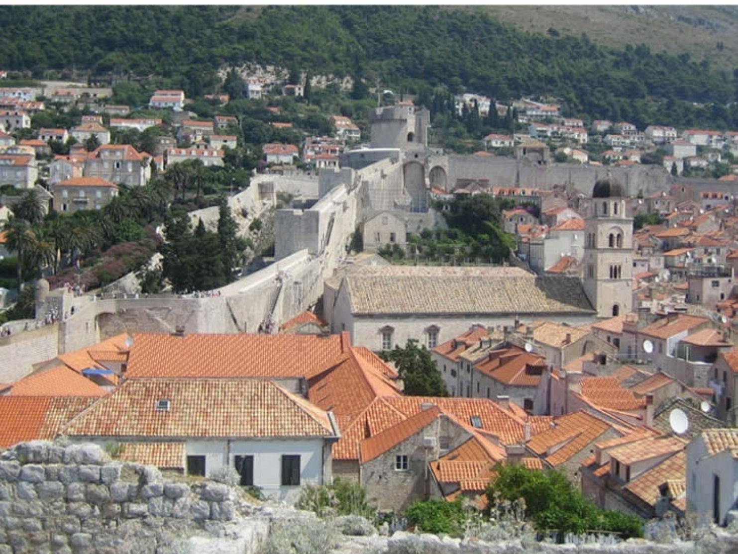
自由都市「ドブロブニク」 Old City of Dubrovnik, Croatia