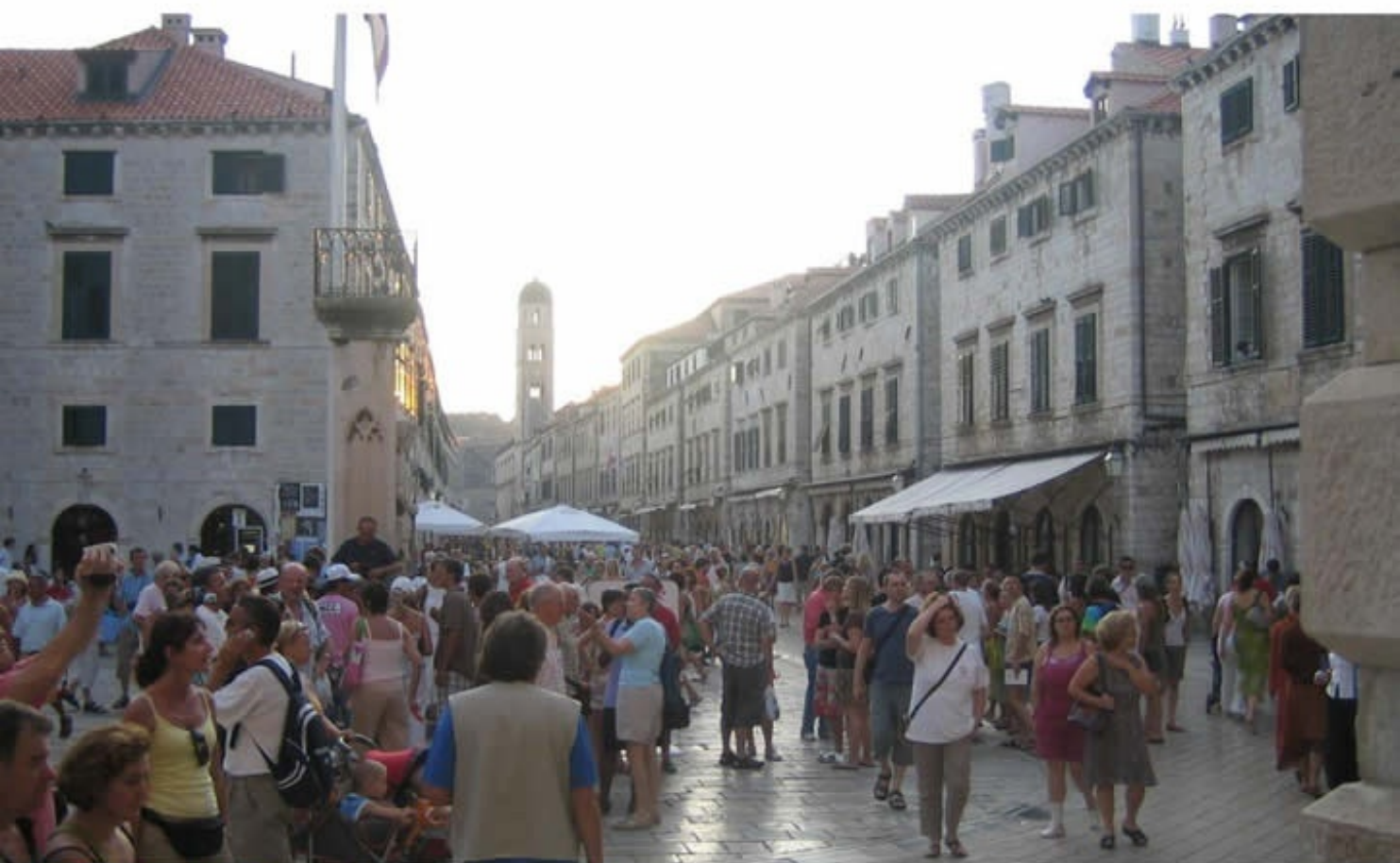
自由都市「ドブロブニク」 Old City of Dubrovnik, Croatia