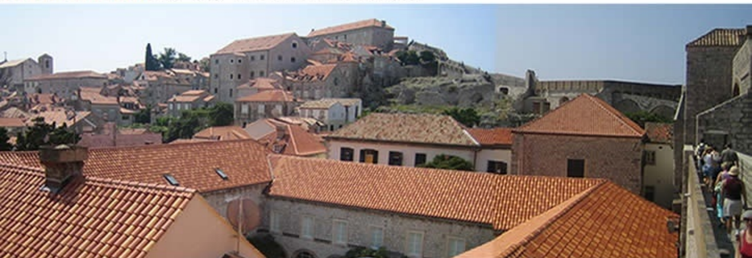
Dubrovnik Old City of Dubrovnik, Croatia