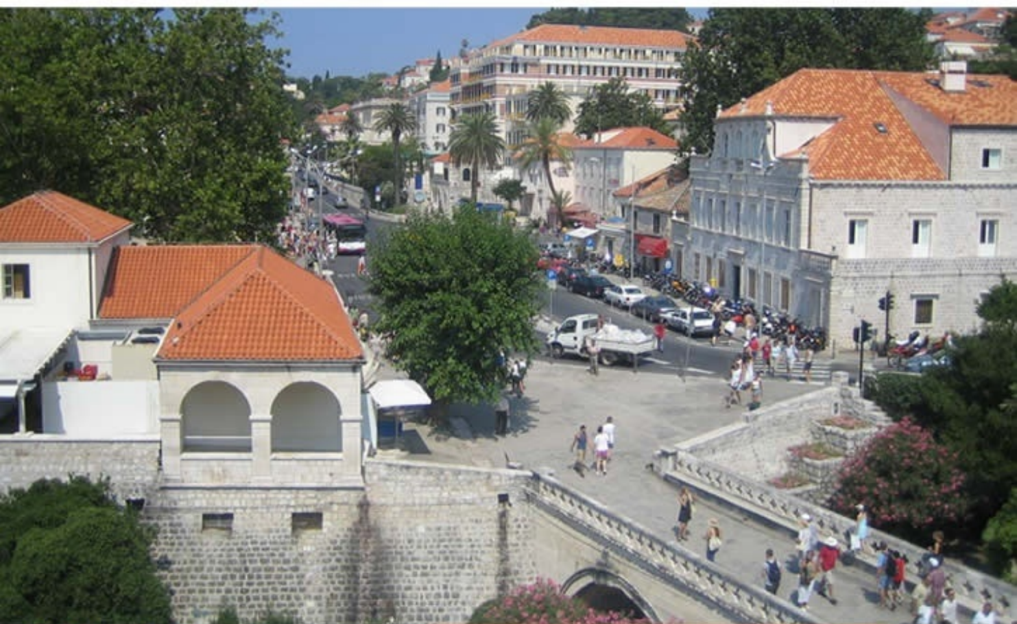
自由都市「ドブロブニク」 Old City of Dubrovnik, Croatia