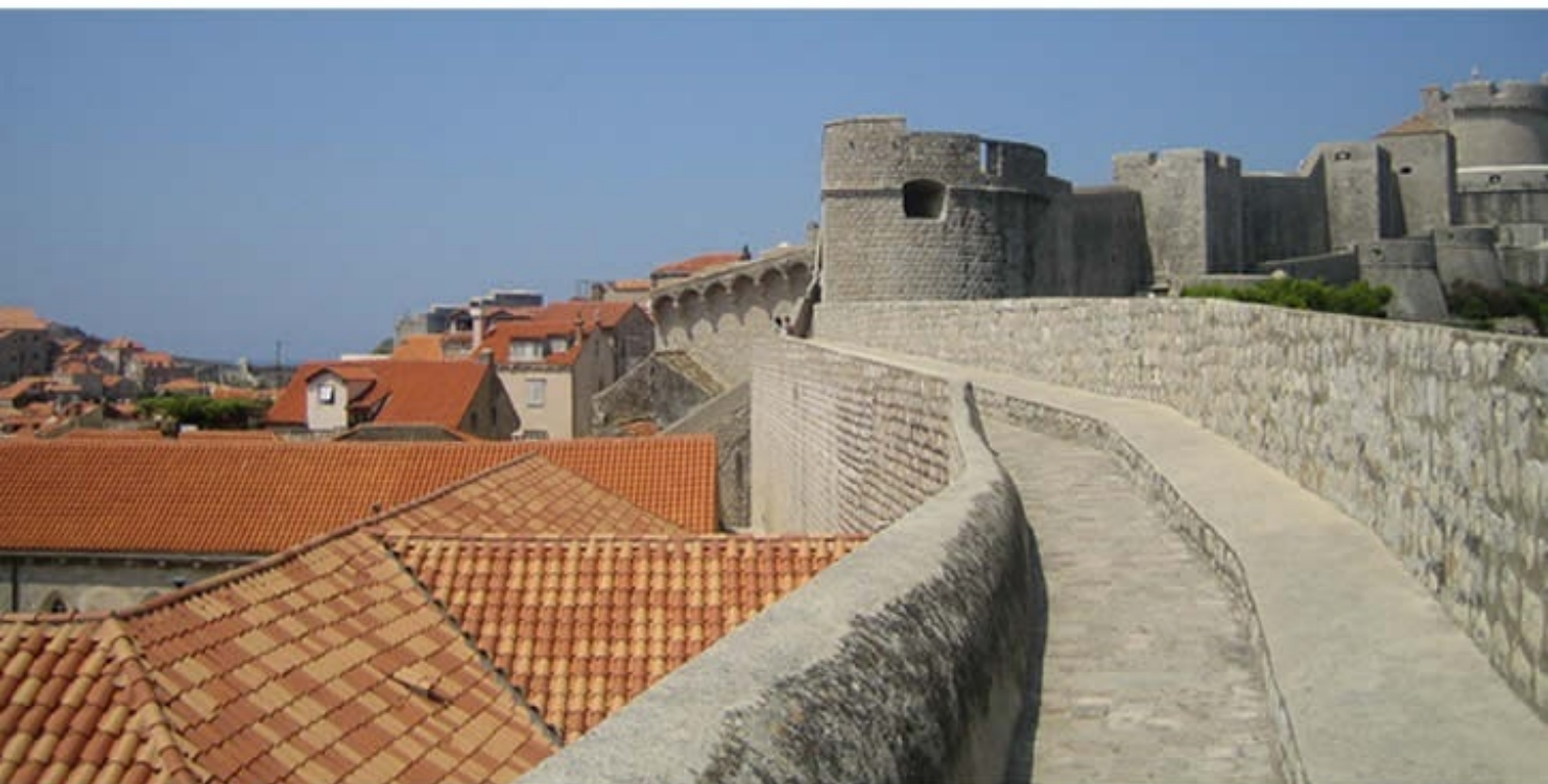
自由都市「ドブロブニク」 Old City of Dubrovnik, Croatia