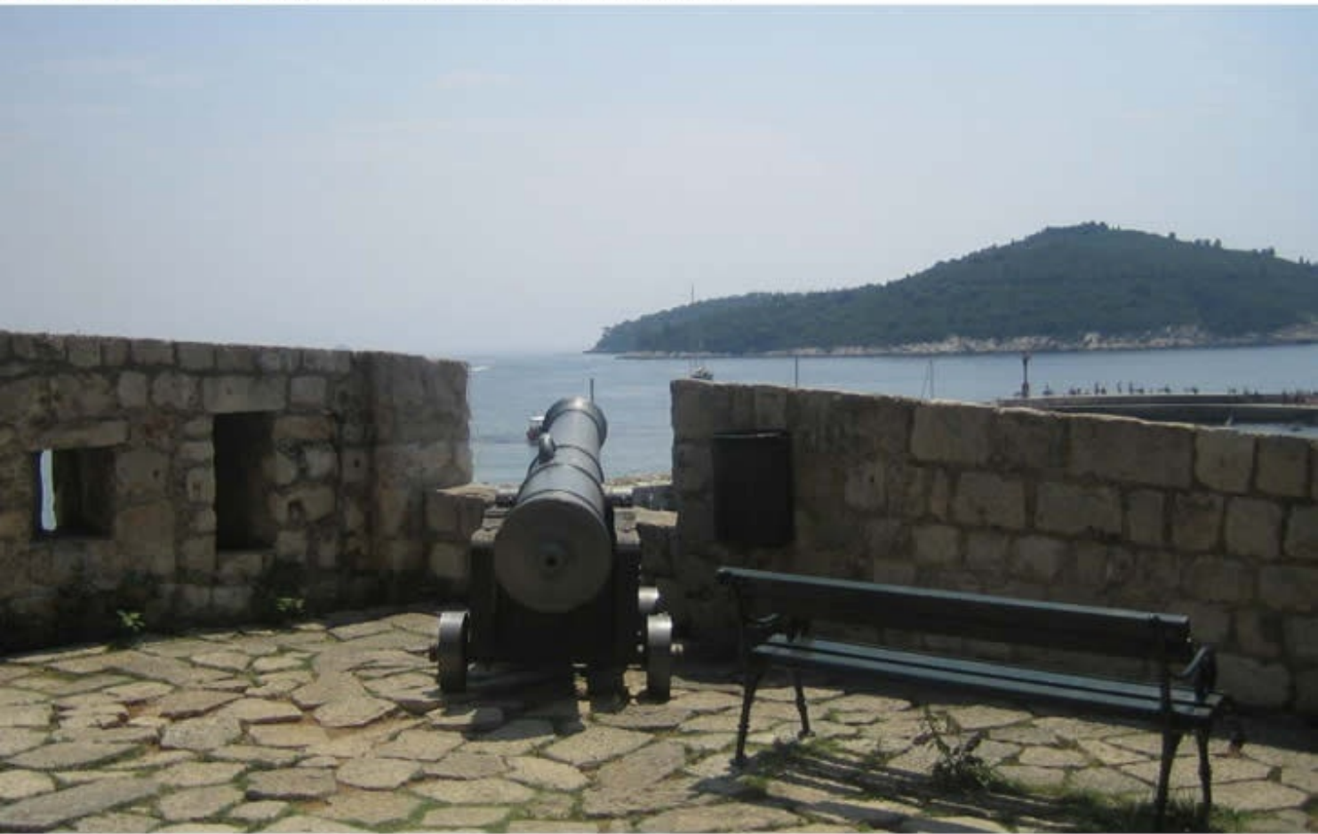
Dubrovnik Old City of Dubrovnik, Croatia