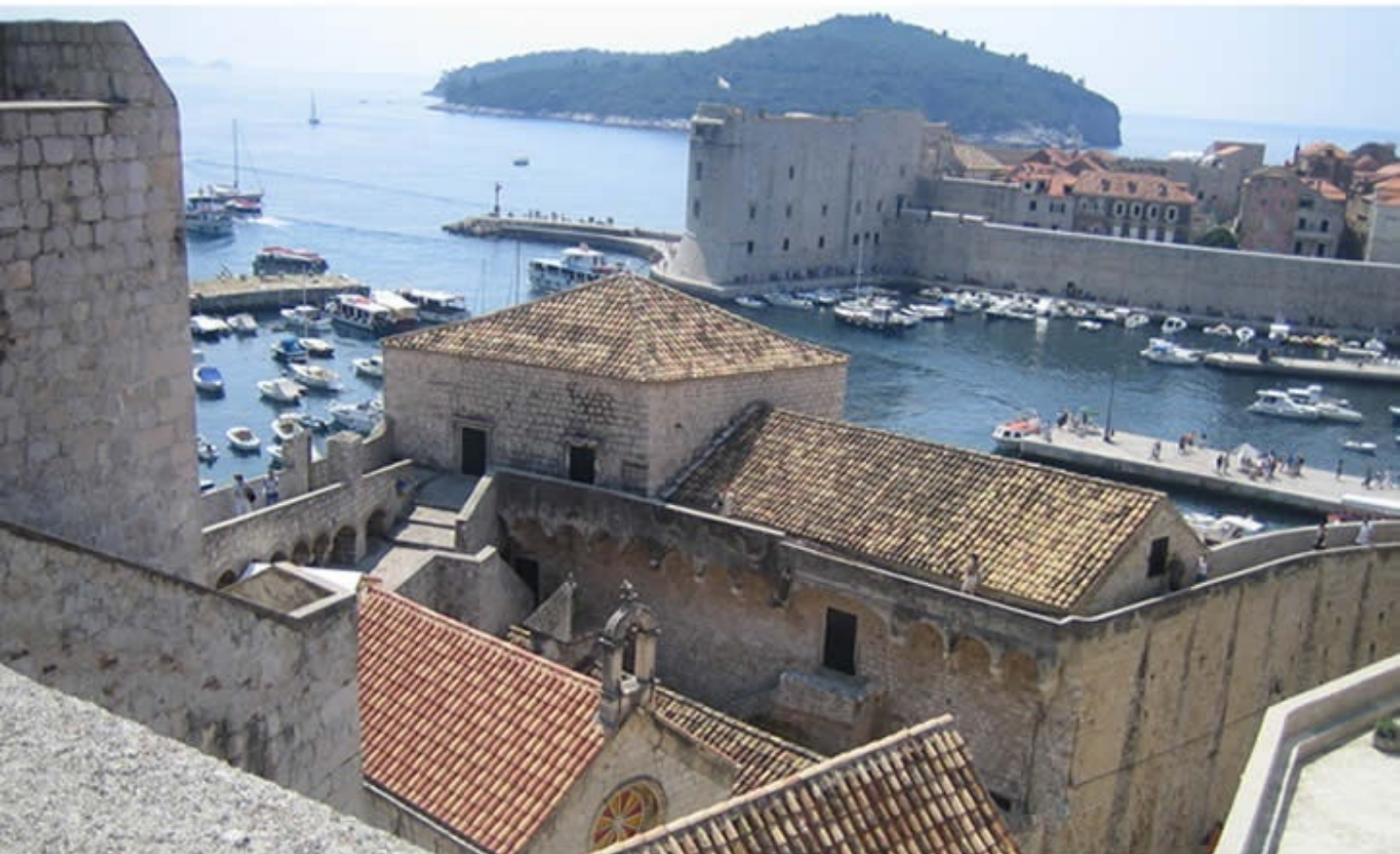
自由都市「ドブロブニク」 Old City of Dubrovnik, Croatia