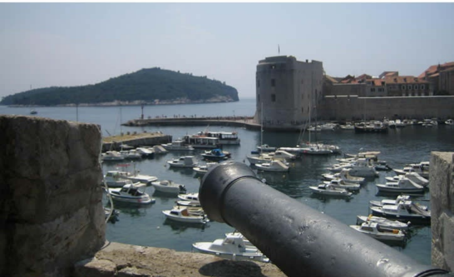
自由都市「ドブロブニク」 Old City of Dubrovnik, Croatia