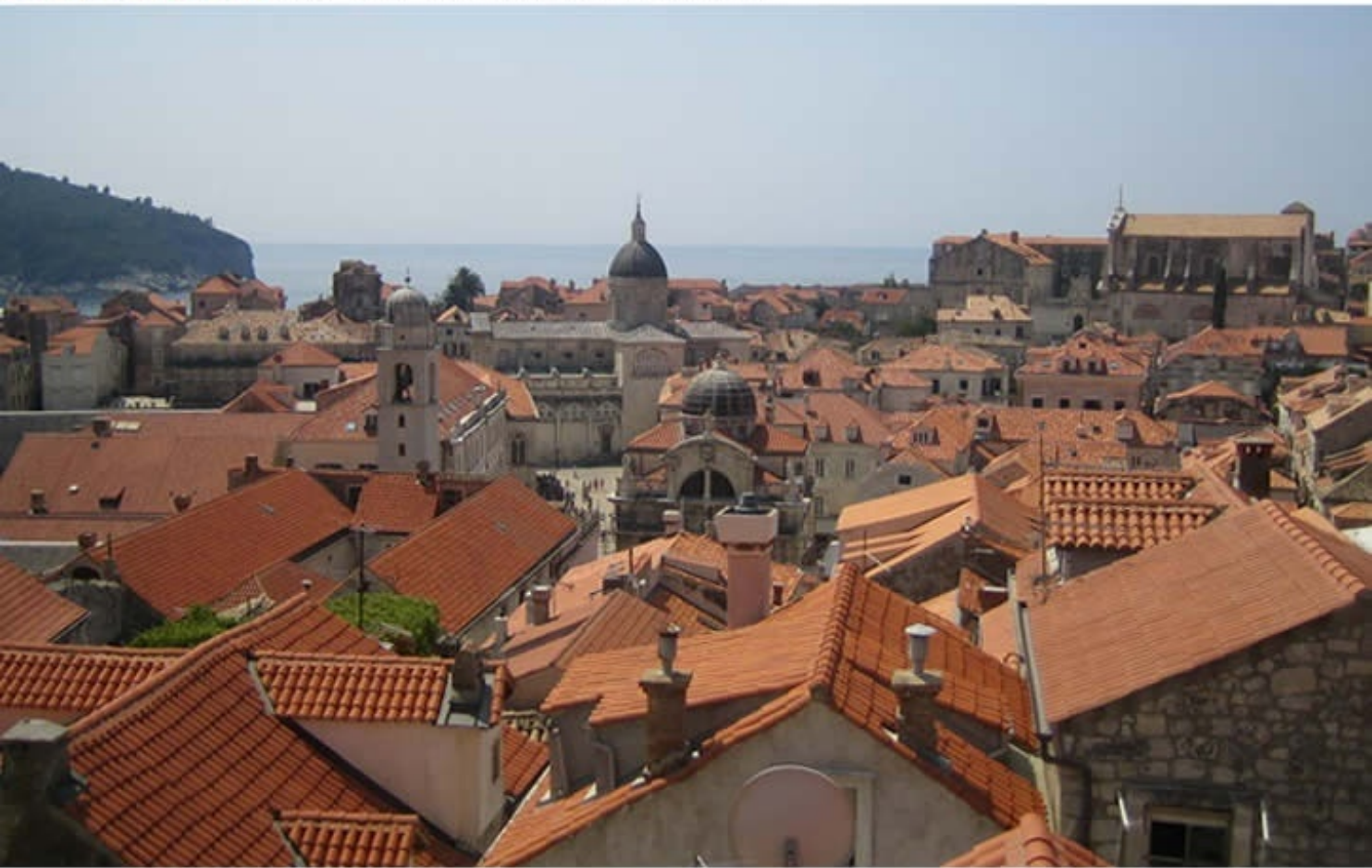
Dubrovnik Old City of Dubrovnik, Croatia