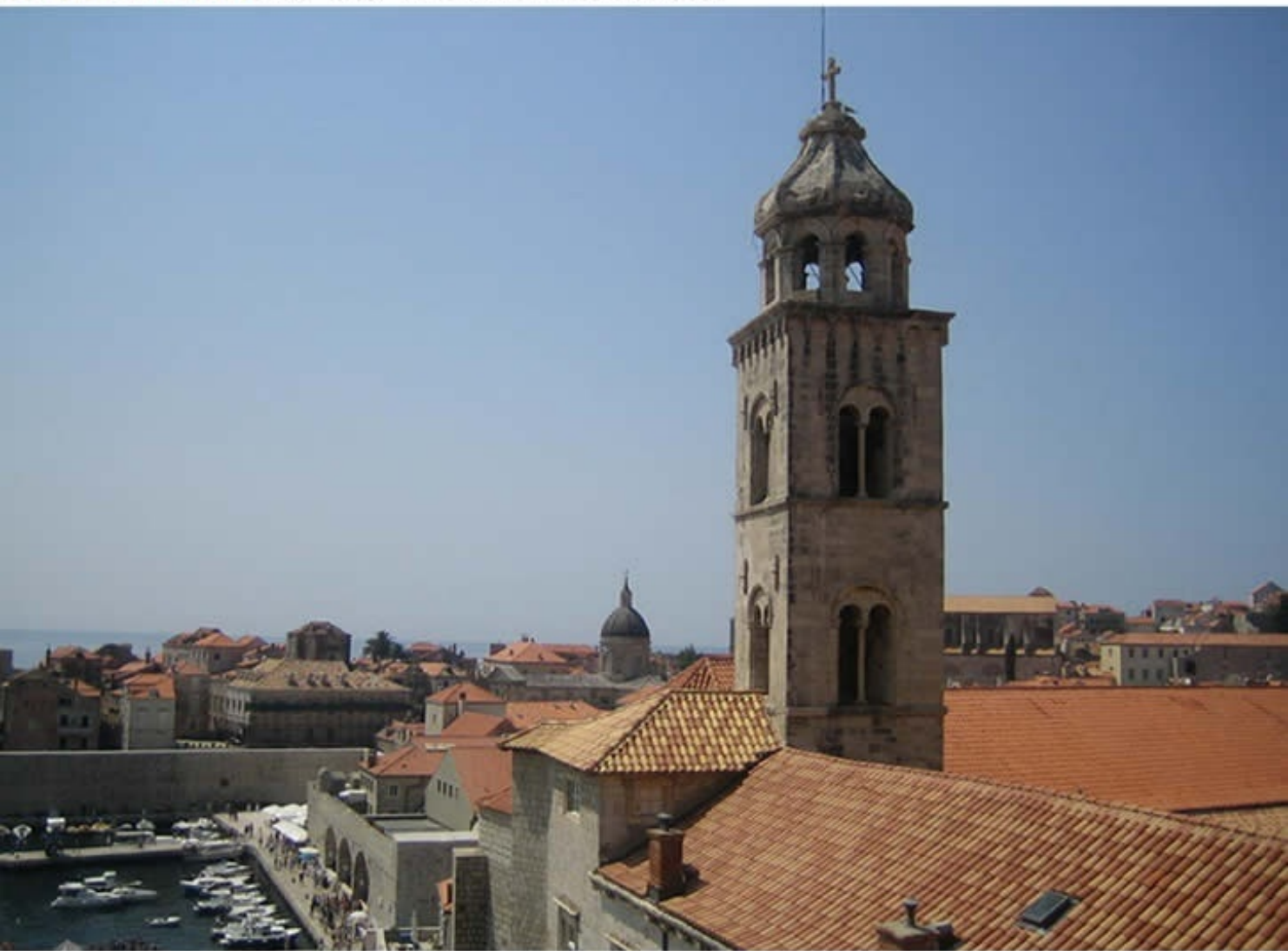
Dubrovnik Old City of Dubrovnik, Croatia