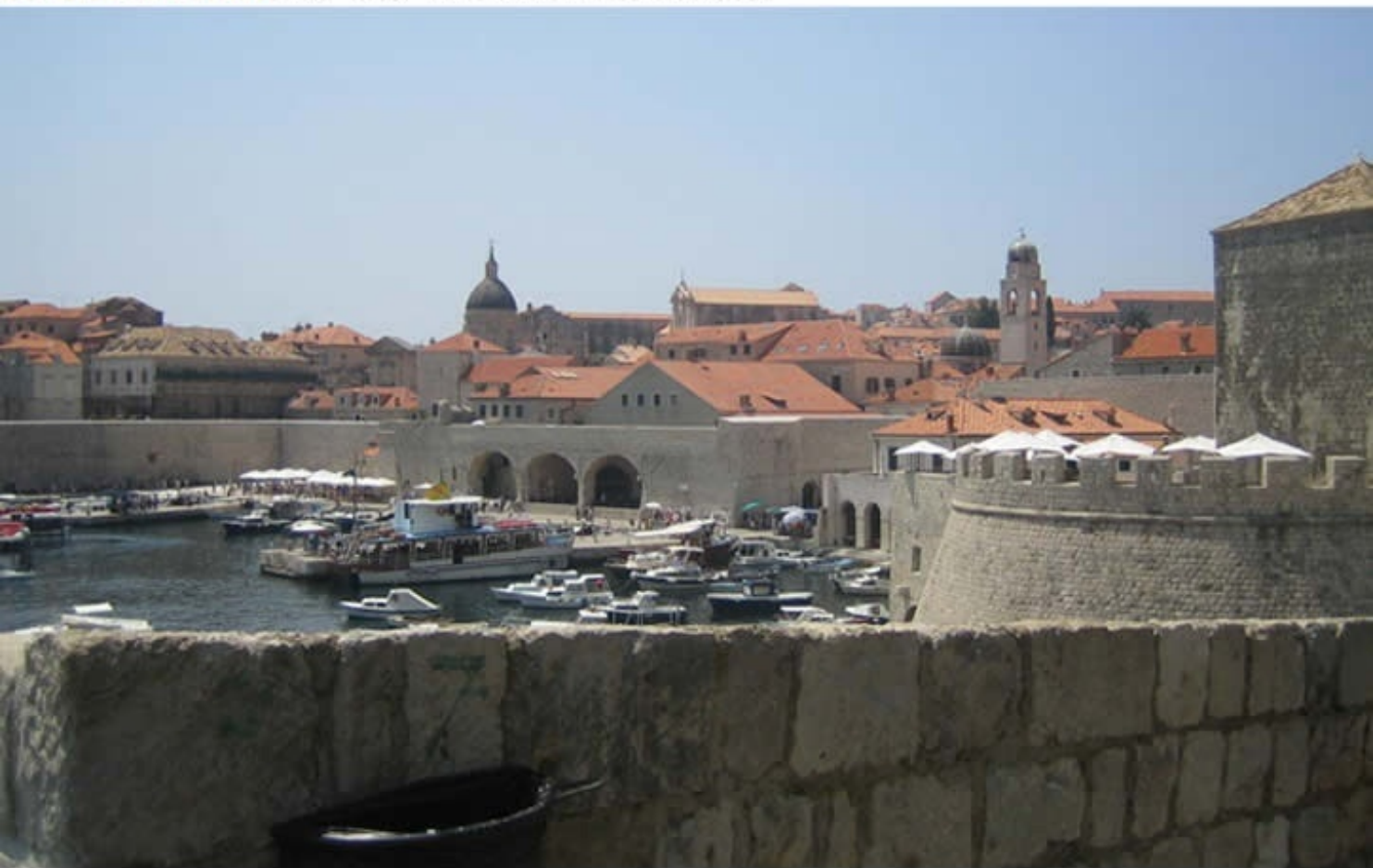
Dubrovnik Old City of Dubrovnik, Croatia