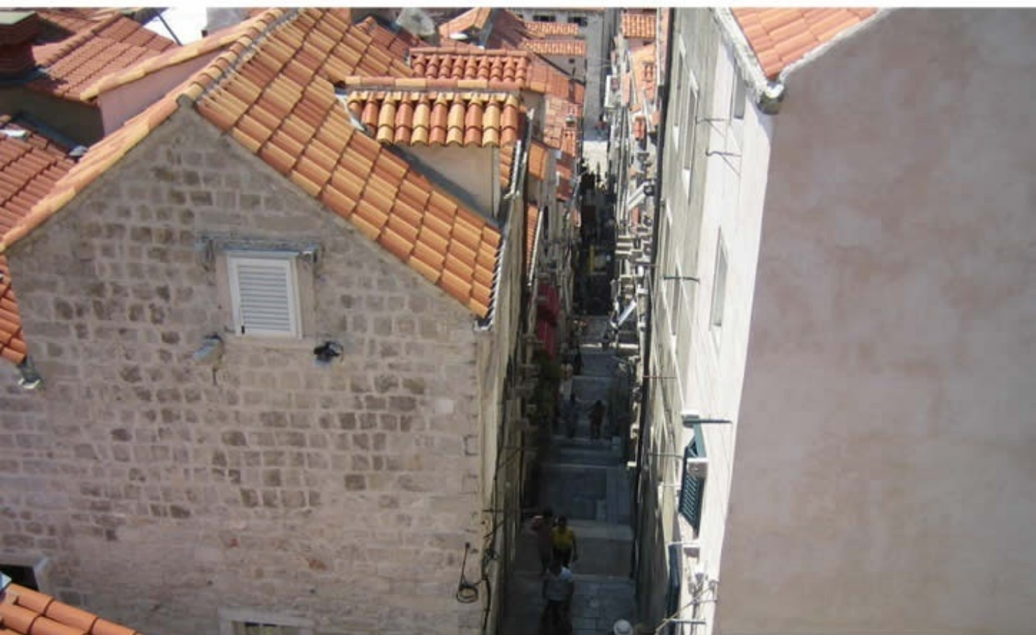
自由都市「ドブロブニク」 Old City of Dubrovnik, Croatia