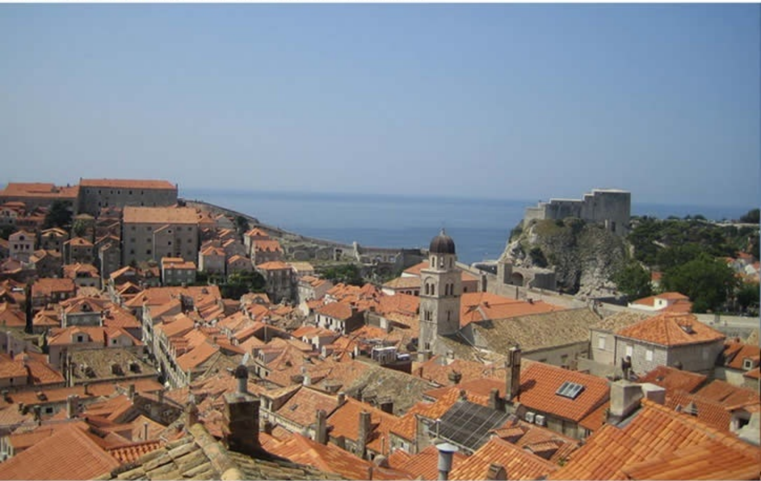
Dubrovnik Old City of Dubrovnik, Croatia