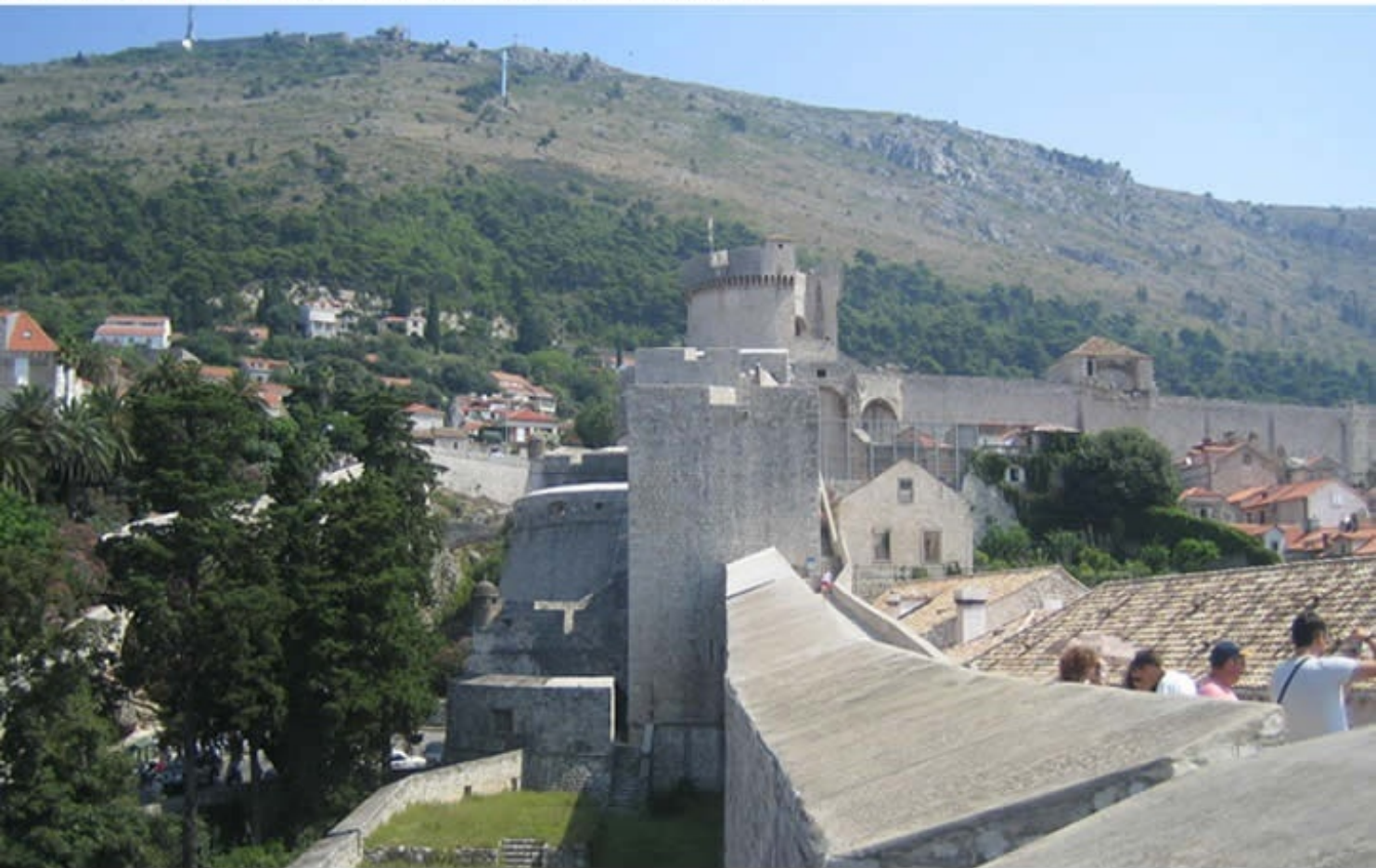
Dubrovnik Old City of Dubrovnik, Croatia