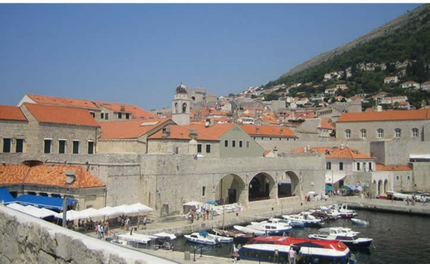
自由都市「ドブロブニク」 Old City of Dubrovnik, Croatia