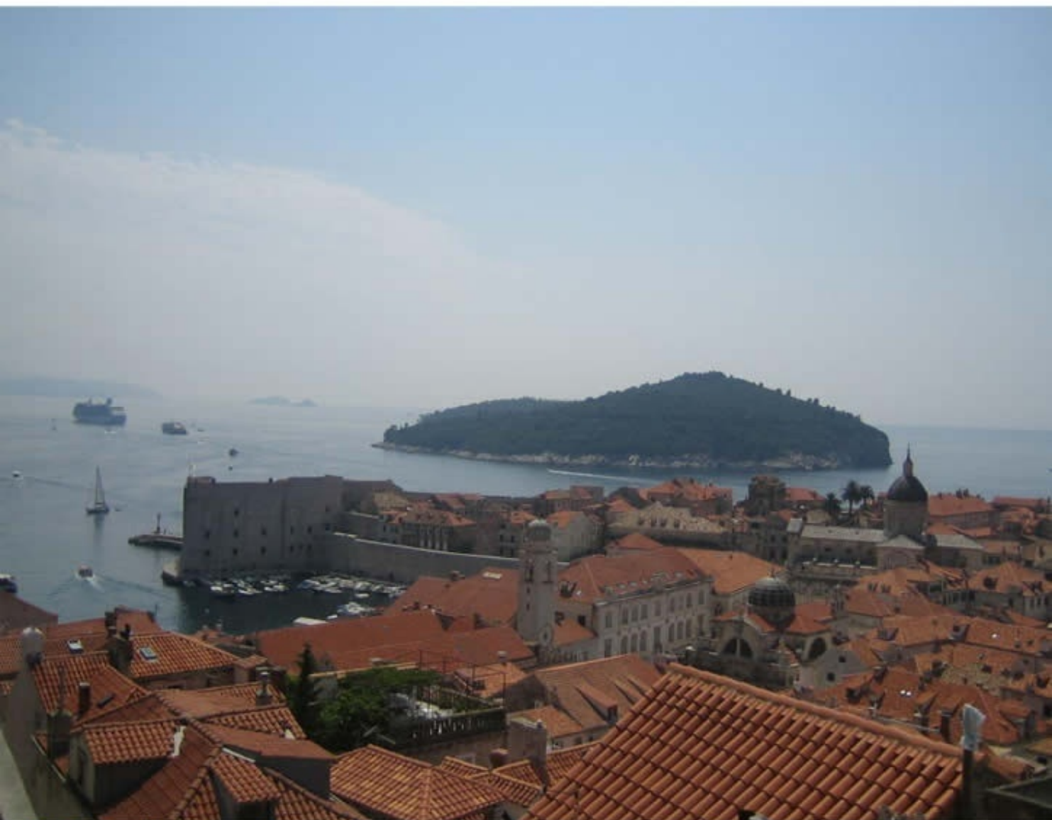
自由都市「ドブロブニク」 Old City of Dubrovnik, Croatia