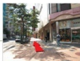
南北線 すすきの駅ラフィラ出口