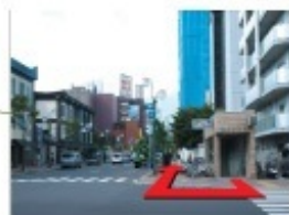
東豊線 豊水すすきの駅7番出口