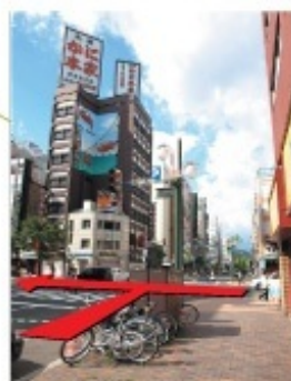
東豊線よりお越しの方は この交差点を左折して下さい。