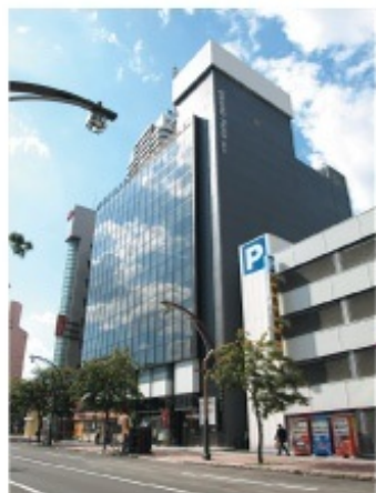
相続手続支援センター北海道支部 GRAND PARK BLD. 5階 (1階にセイコーマートの入ったビル)