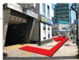
南北線 中島公園駅2番出口