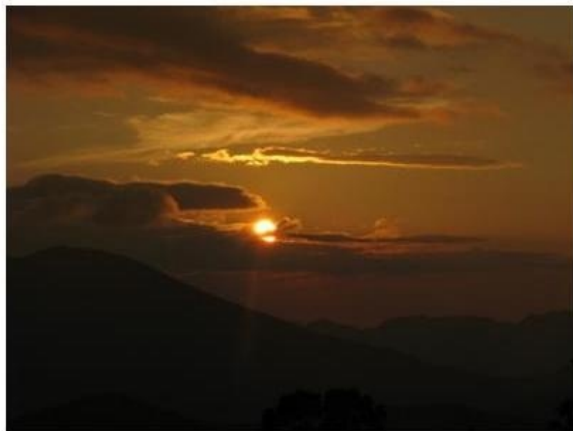
山頂からの日の出 2