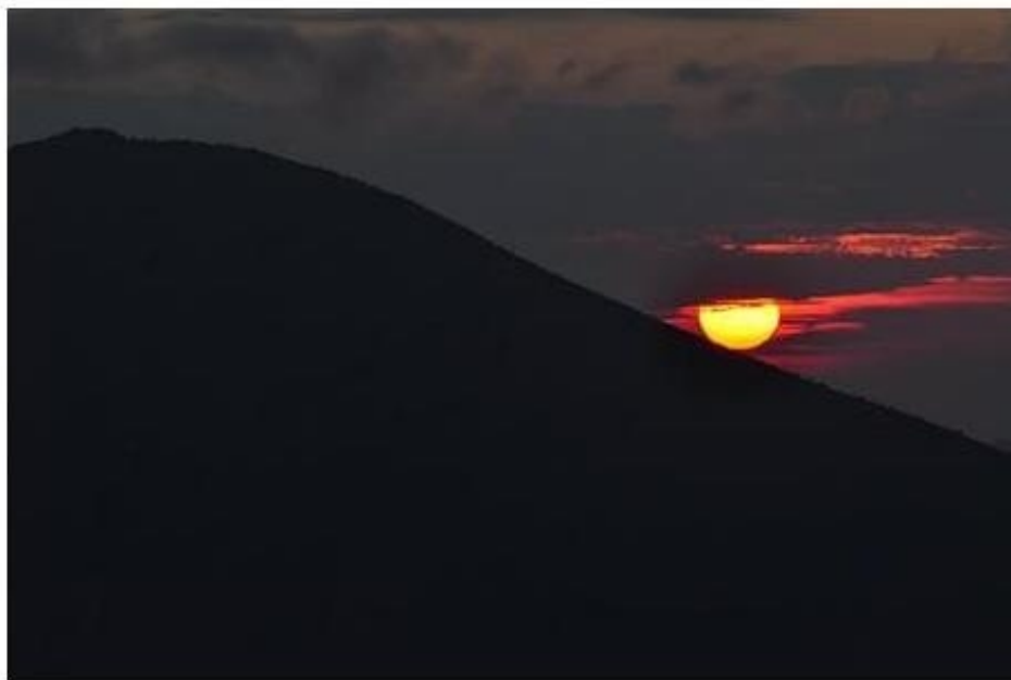
山頂からの日の出