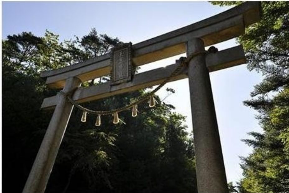
参道入り口の鳥居