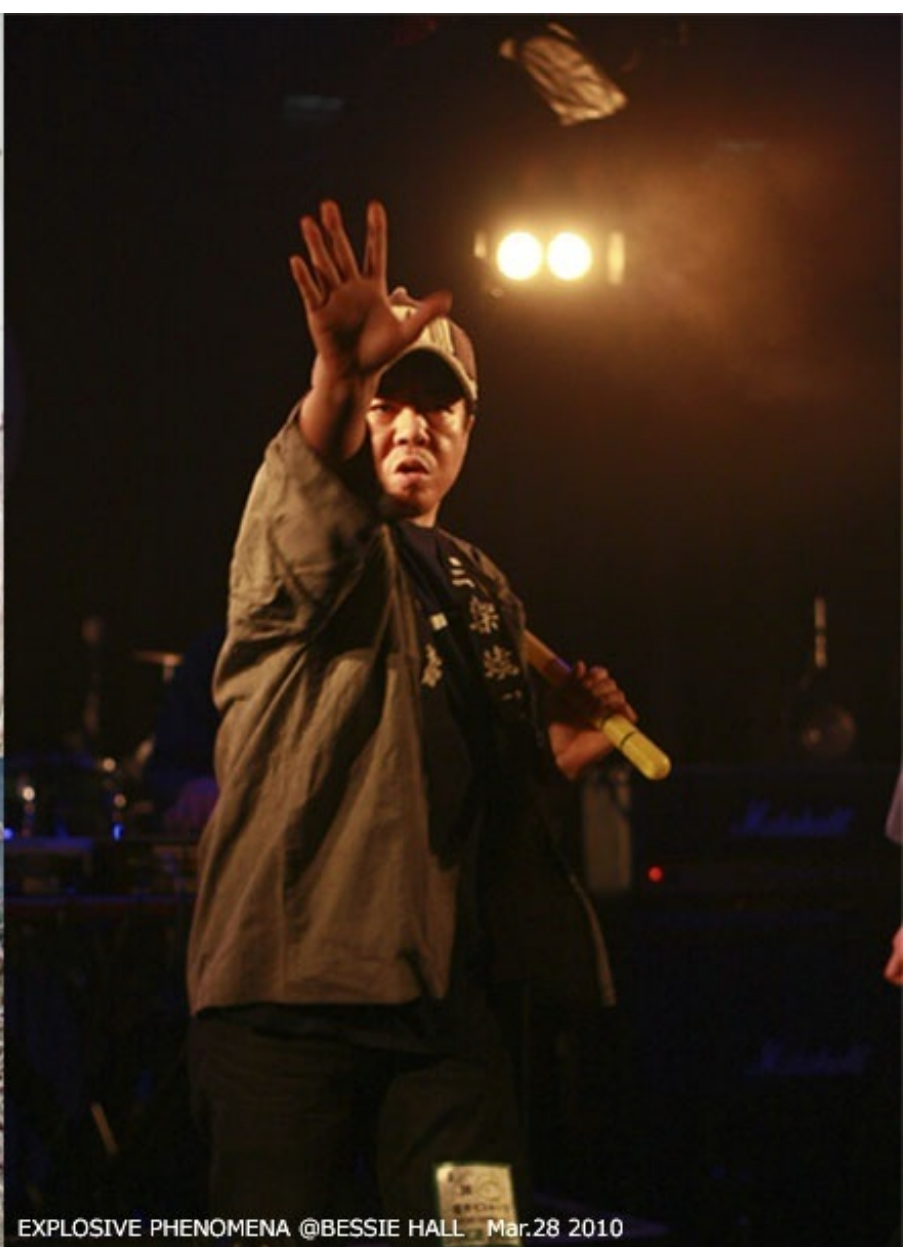
EXPLOSIVE PHENOMENA @BESSIE HALL Mar.28 2010