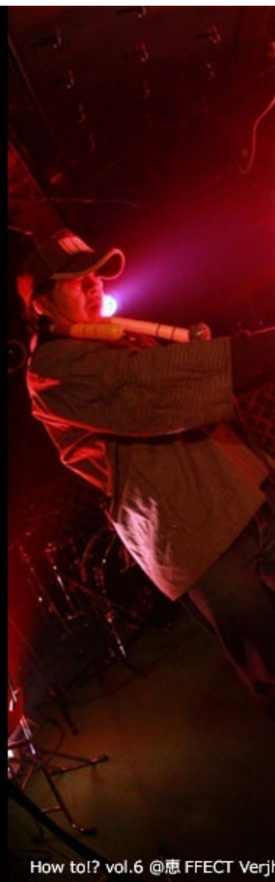
How to!? vol.6 @恵 FFECT Verj

したがって『RoughSketch and 臨界モスキー党』というユニットも『印度のソバ屋』というアルバムも全てその場のノリで始めただけに過ぎないものだったんです。そこで RoughSketch がトラックメイク担当、自分と一戸建とあべちさんは作詞と Np(MIC) 担当という形で程無くしてアルバム制作作業に入る訳です。