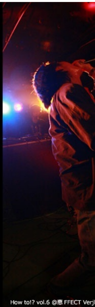
How to!? vol.6 @患 FFECT Verj