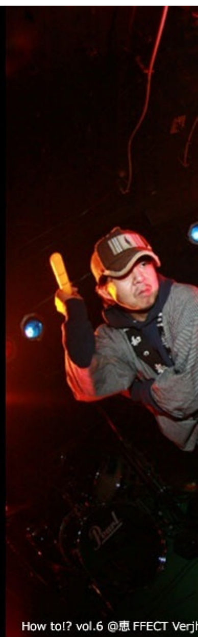
How to!? vol.6 @患 FFECT Verj