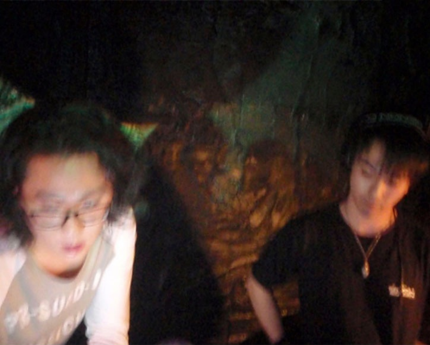
MAKOTO × TANA 侍 JUDGEMENT DAY @PLASTIC THEATER Mar.6 2010