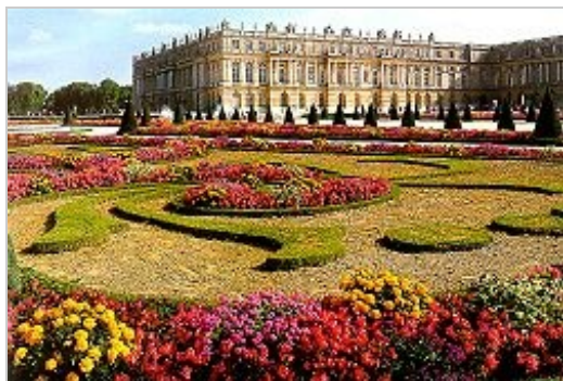
ヴェルサイユ宮殿