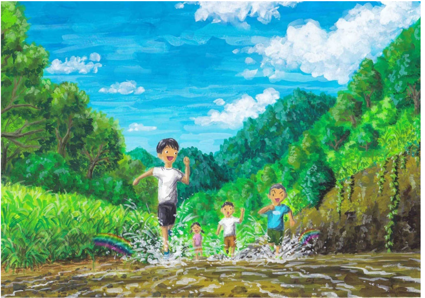
川の浅瀬でみんなで駆けっこ。 水しぶきがあがって虹ができたよ。