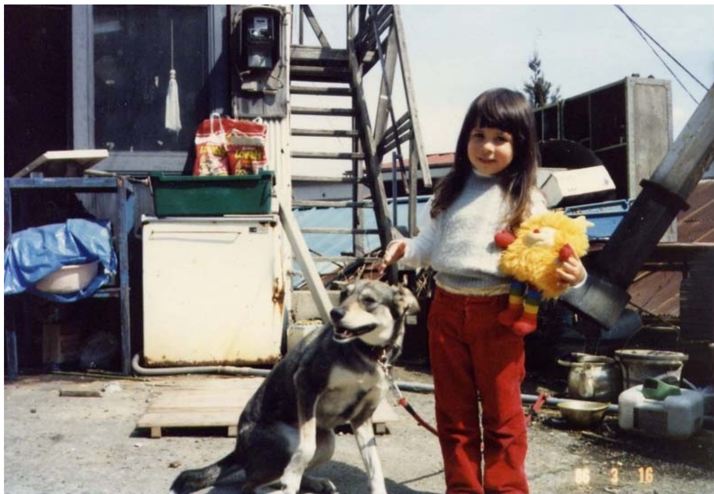
安心した顔をしています。