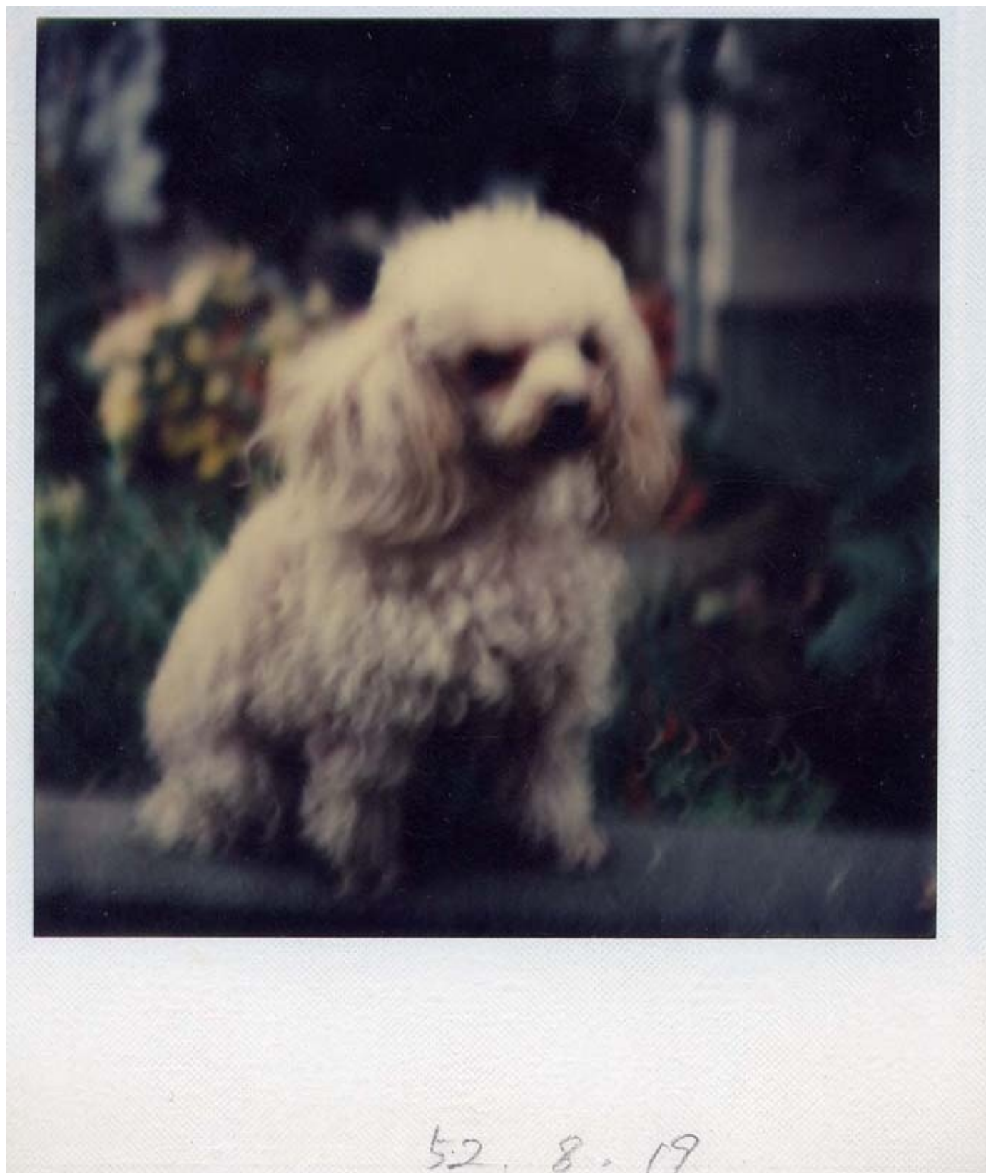
年をとった晩年のチビちゃん。思い出の首輪は、負担になるのではずしました。