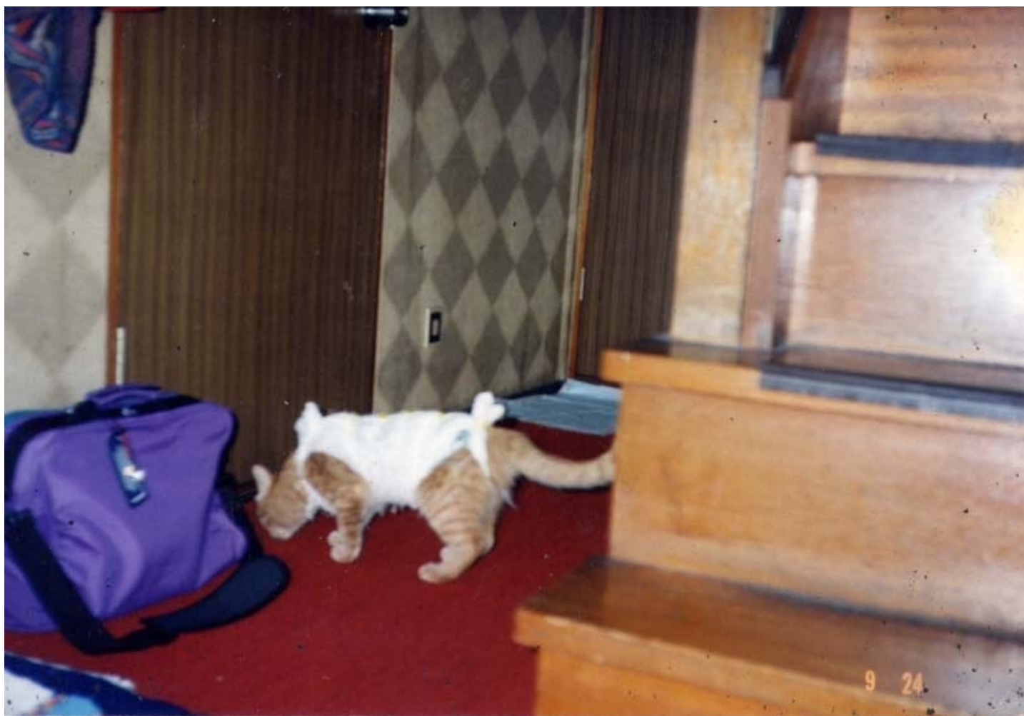
避妊手術をした後の写真、ちょっと痛々しいですね。 こんな姿でも3階窓から飛び降りたりとやんちゃでした。