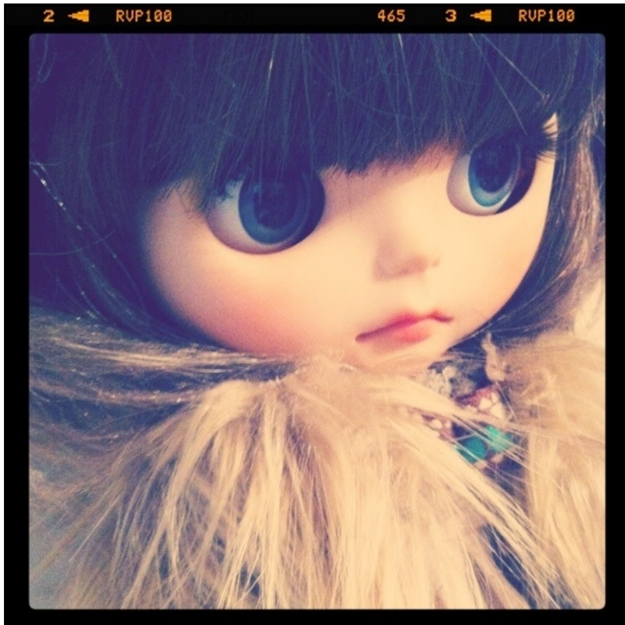
My Blythe への字ぐち。