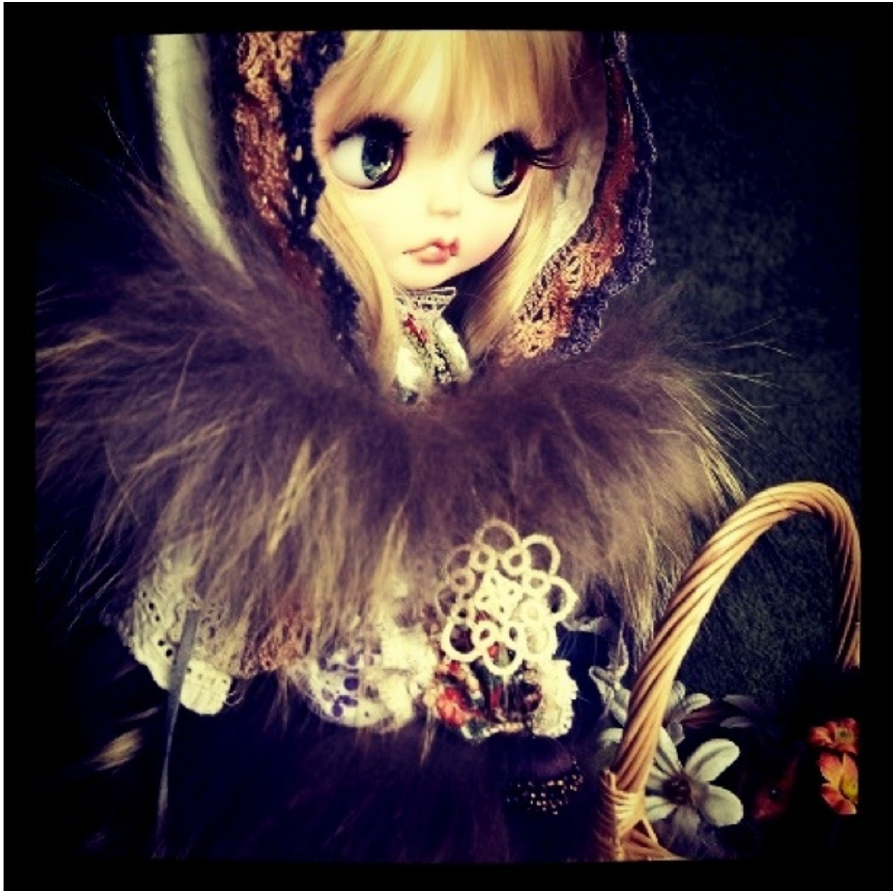
My Custom Blythe ふわふわのお洋服。