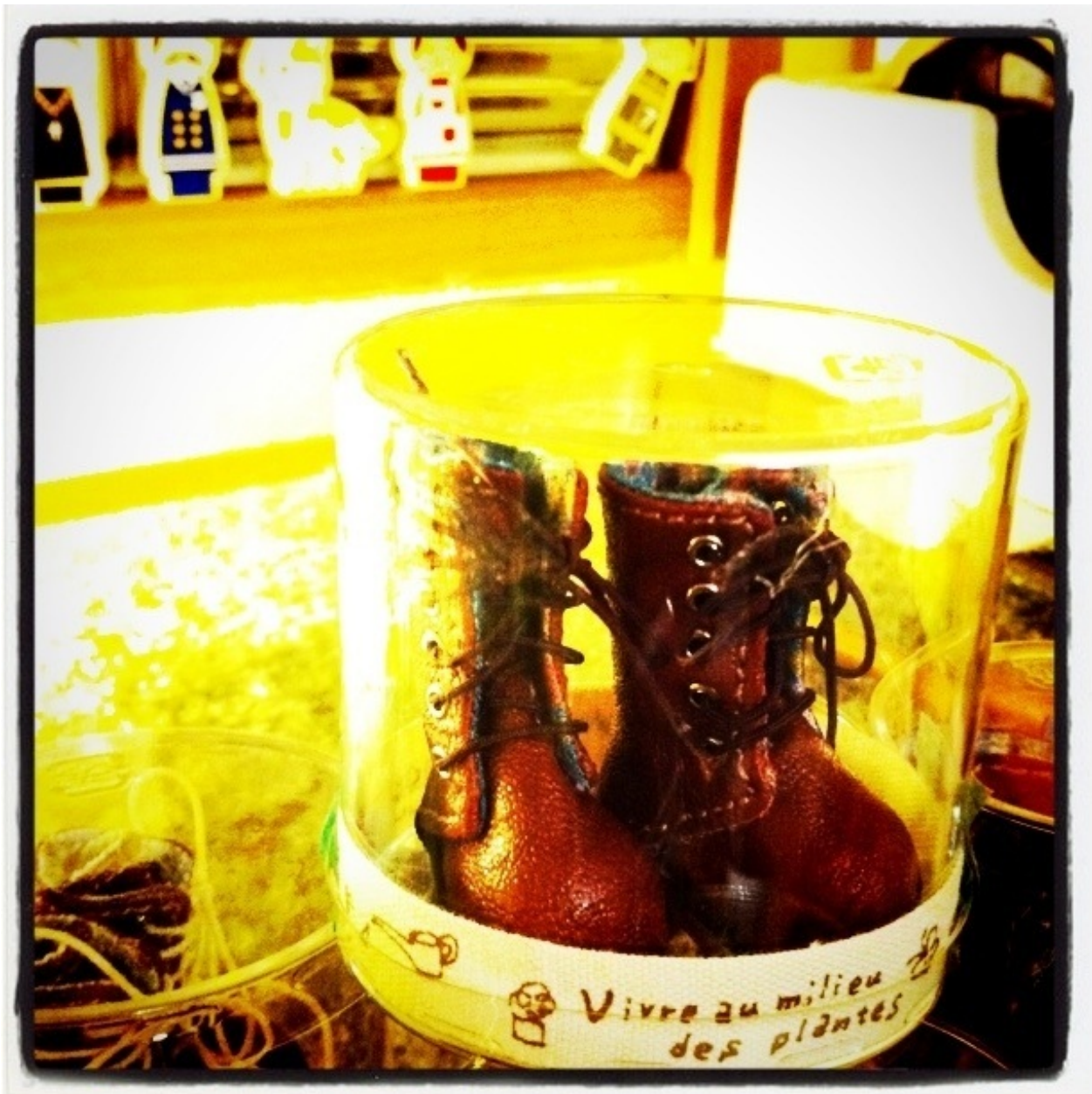
ブライスサイズの靴。 しっかり作ったブーツ。