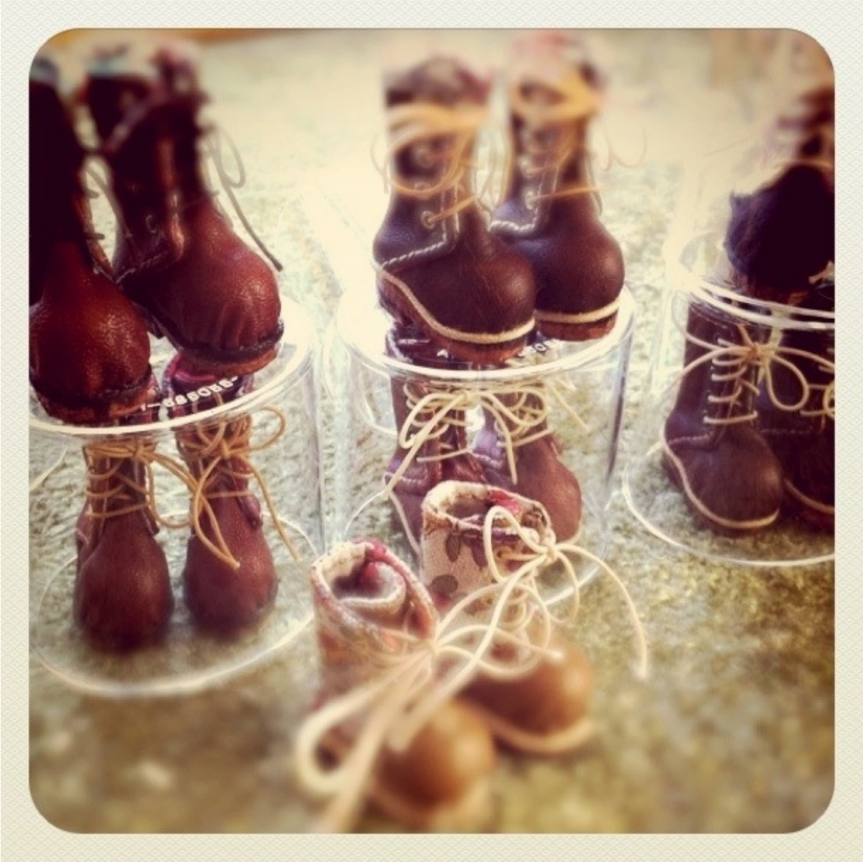
ブライスサイズの小さな靴。 ハンドメイドの人形靴。