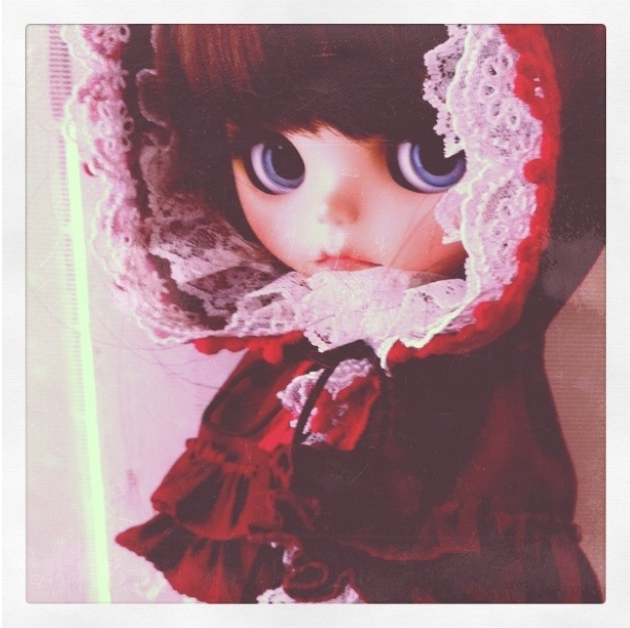
My Custom Blythe 赤ずきんちゃん。