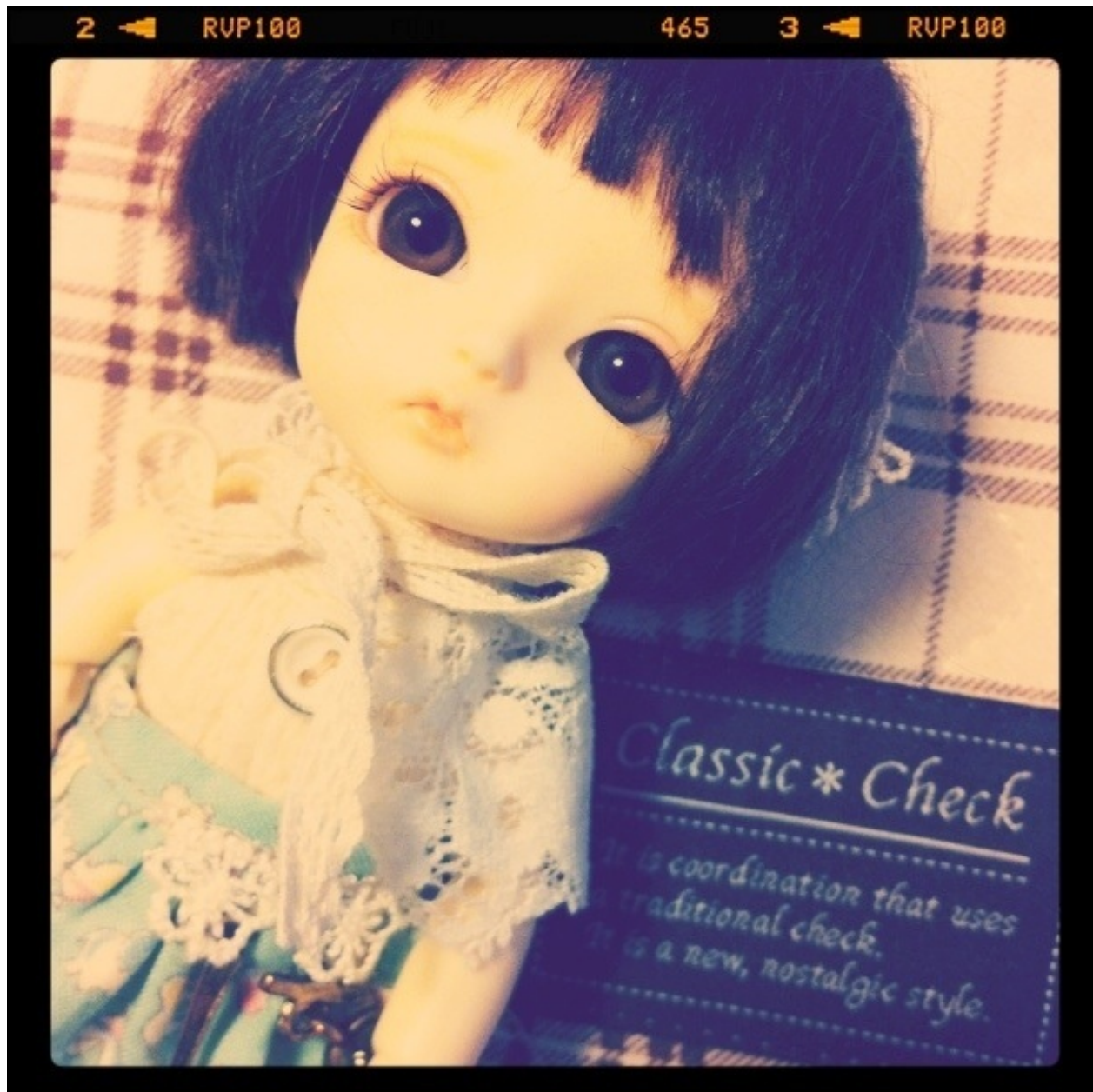
Lati Yellow Benny