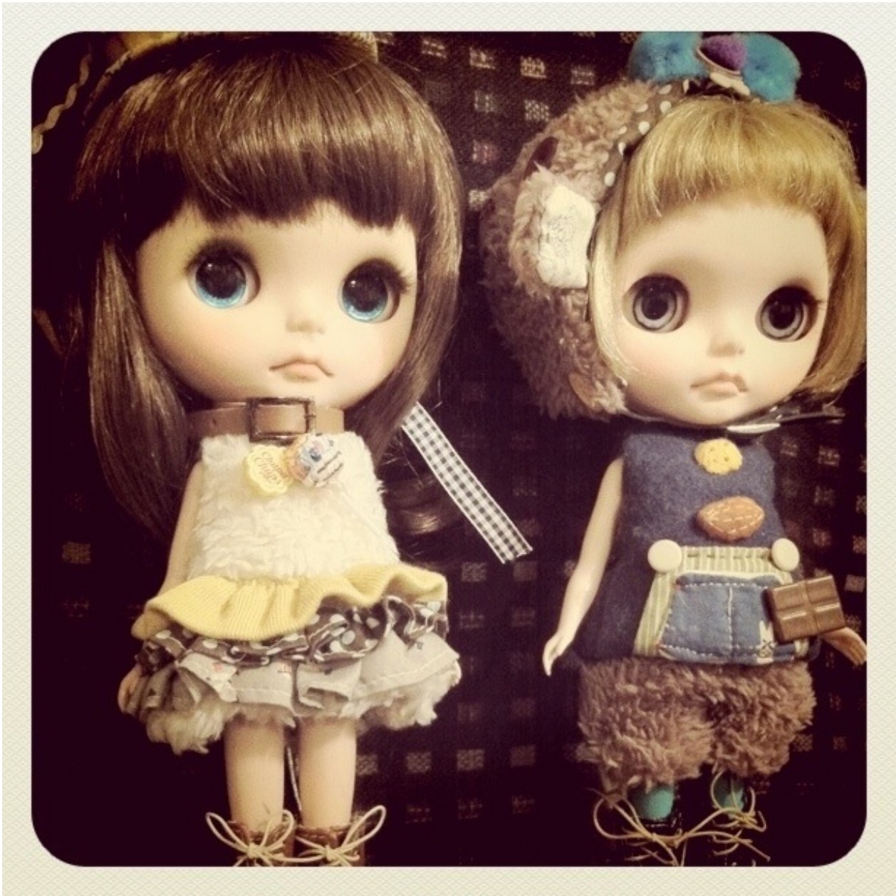
Blythe ふたり はい、気をつけ！