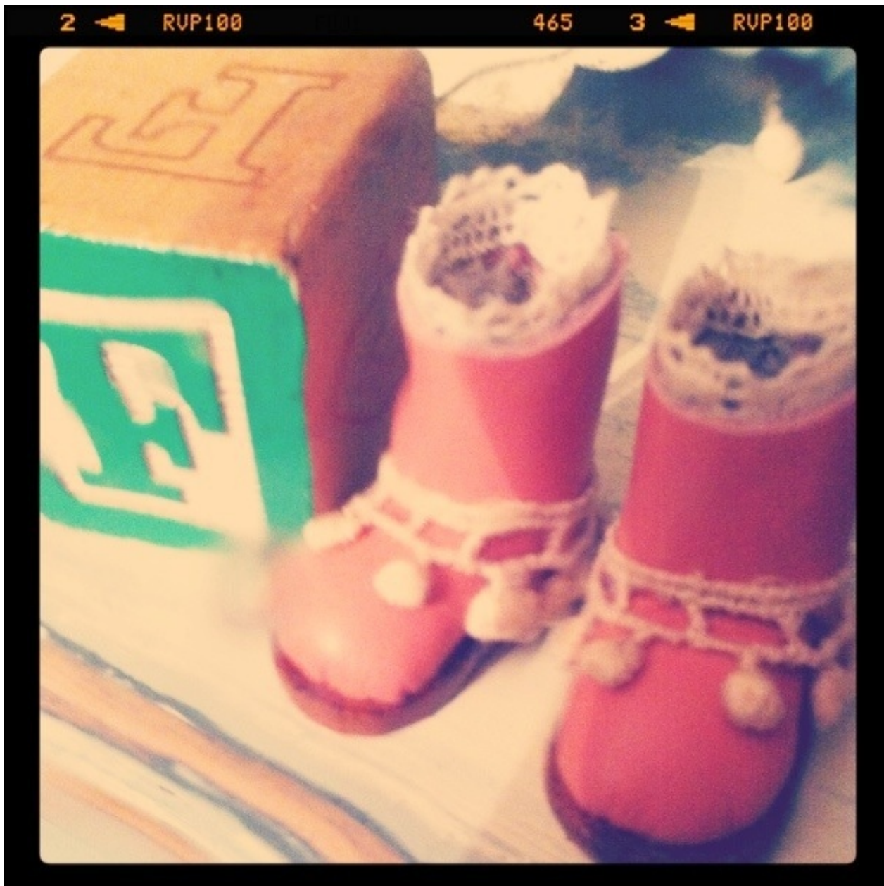
これはちょっと、ブライスより 小さいサイズの靴。