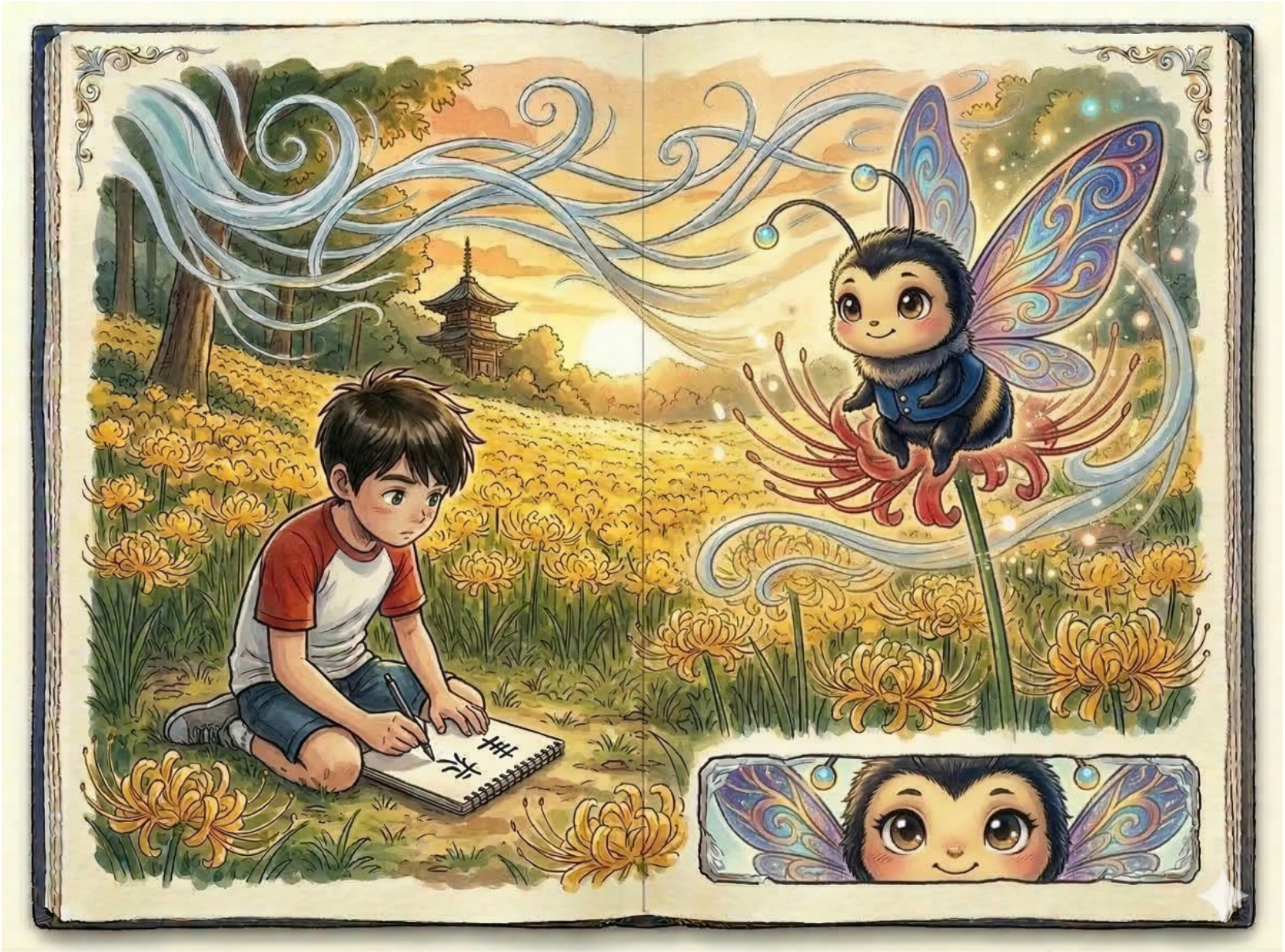
Gemini _ Generated _ Image _ ୮ ୫ ୮ ୫ k d i i ୫ k d i i ୦ . ୧ ୧ ୫ ୫