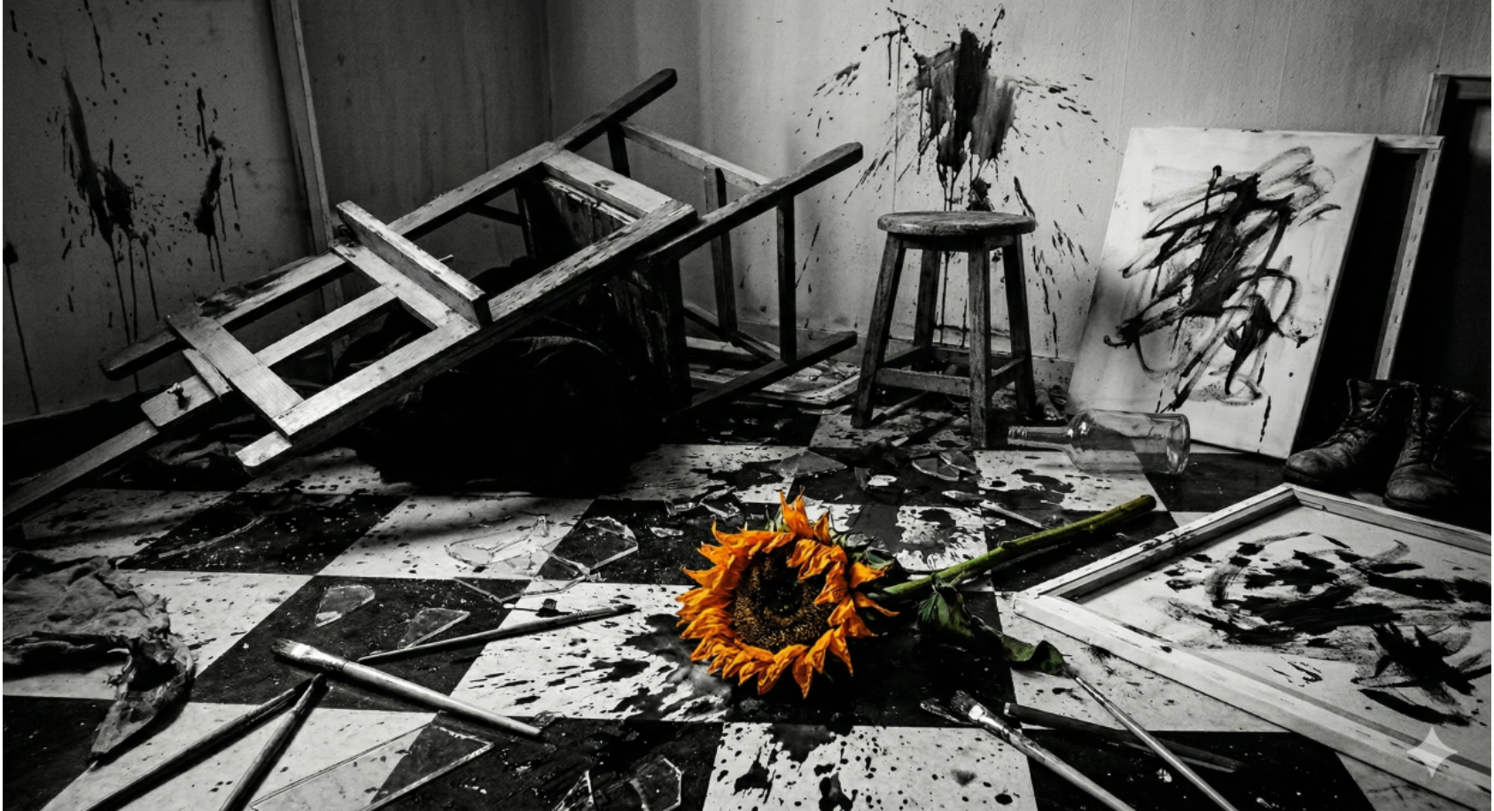
Gemini _ Generated _ Image _ mloizmmloizmmloi . 2. 11 22