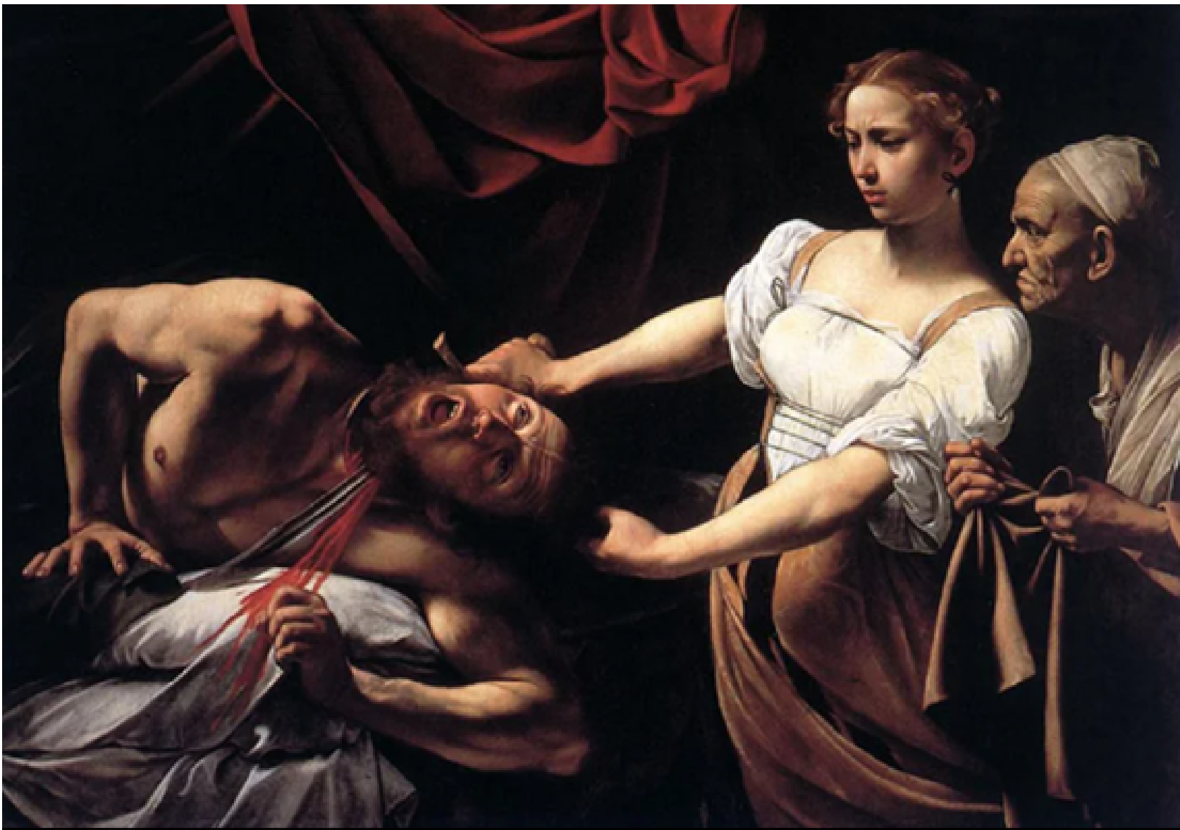
ホロフェルネスの首を斬るユディト白png