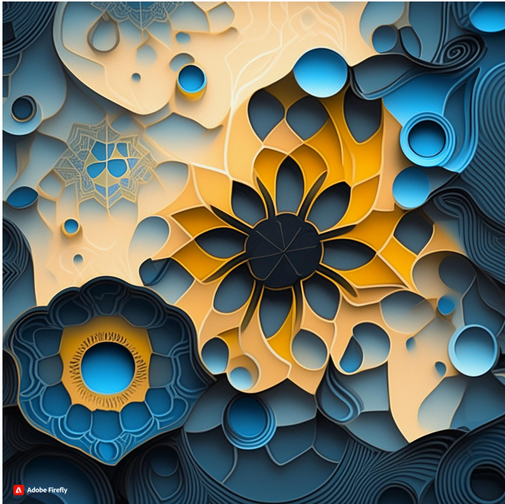
Firefly 幾何学的な抽象画. ((ポップな雰囲気を表現する. 金属的な質感を強調する.)) 60438.jpg