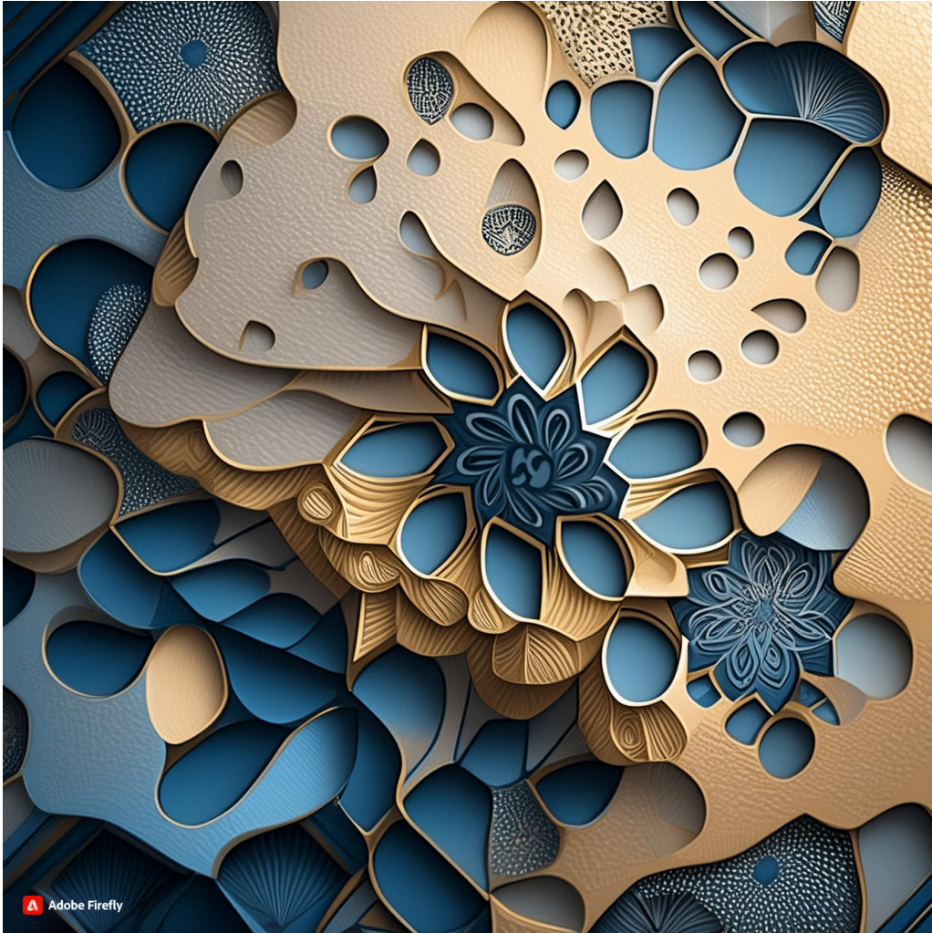
Firefly 幾何学的な抽象画. ( (ポップな雰囲気を表現する. 金属的な質感を強調する. ) ) 91456.jpg