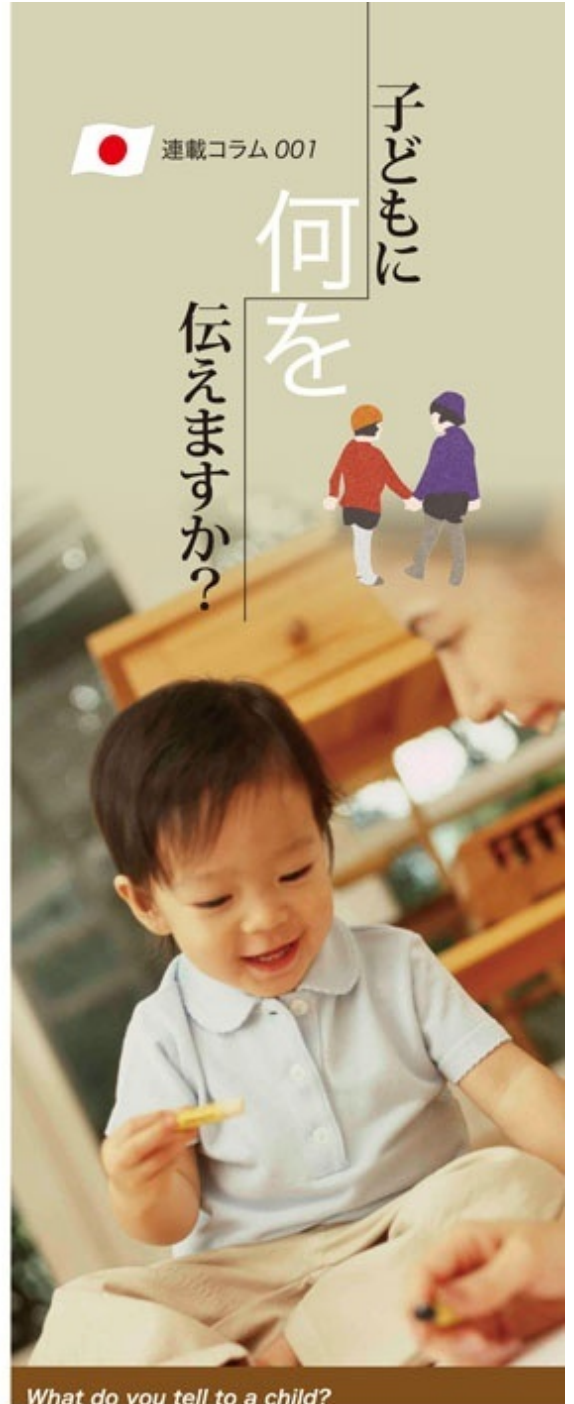
What do you tell to a child?