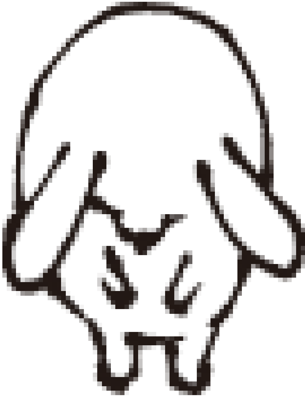
アフロディーテの生まれた場所