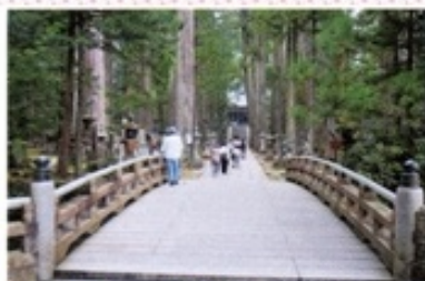
— 御廟橋 聖域(奥の院・弘法大師廟)への入口

高野山はいまでも、空海が生きるとして一日2回奥の院に食事を運んでいるそうだ。詳しい意味はわからないが、今でも空海は生きていて『教え』を伝えているという意味だと勝手に解釈している私… 1人の女性への愛を貫いた男の悲しい物語をスベクタクに描く。有名な黒猫の愛はやはり永遠だと思ふ。