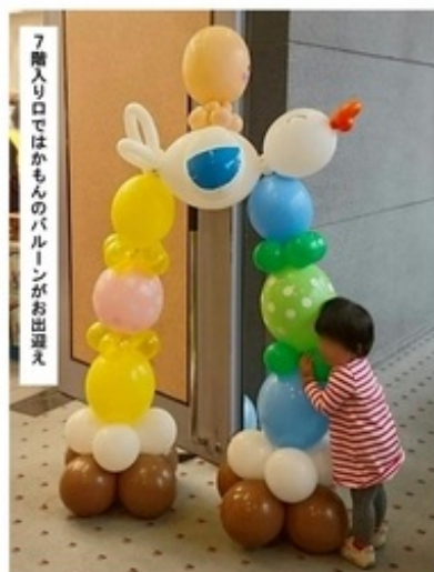
7階入り口ではかまのバルーンがお出迎え

今年は第11回ということで、実行委員はOGを中心に結成し、様々な見直しをしたメッセでしたが、