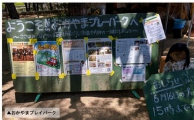
▲おかやまプレイパーク

岡山では日本冒険遊び場づくり協会の総会に出席、全国で冒険遊び場・プレーパークの運営に関わる方々との顔合わせの機会でした。翌日は冒険遊び場づくり全国フォーラム2018×オレンジリボンフォーラム2018共同開催の「みんなの居場所 冒険遊び場の可能性～子ども虐待防止とすこやかな成長のための役割」に参加しました。岡山県や各市の職員や学生、市民活動の担い手が協力して作り上げたフォーラムでは、児童虐待防止の視点での専門家からのお話と、子ども食堂やプレーパークでの取り組みなどの報告とパネルディスカッションが行われました。