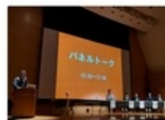
▲オレンジリボンフォーラム2018

岡山では日本冒険遊び場づくり協会の総会に出席、全国で冒険遊び場・プレーパークの運営に関わる方々との顔合わせの機会でした。翌日は冒険遊び場づくり全国フォーラム2018×オレンジリボンフォーラム2018共同開催の「みんなの居場所 冒険遊び場の可能性～子ども虐待防止とすこやかな成長のための役割」に参加しました。岡山県や各市の職員や学生、市民活動の担い手が協力して作り上げたフォーラムでは、児童虐待防止の視点での専門家からのお話と、子ども食堂やプレーパークでの取り組みなどの報告とパネルディスカッションが行われました。