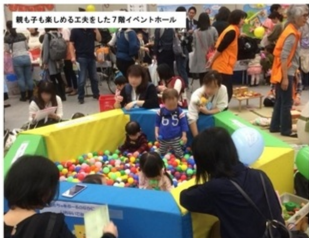
親子も楽しめる工夫をした7階イベントホール

赤ちゃんとゆっくり遊びながら座って情報を持って帰ってほしい、お子さんが遊んでいる傍らで情報も入ったらいいな、情報を感じながら食事ができたら嬉しいな・・・などなど来場者により多くの情報を心地よくもって帰ってほしいという思いは変わらず、より来場者にとっても出展団体にとっても良い環境を模索しました。