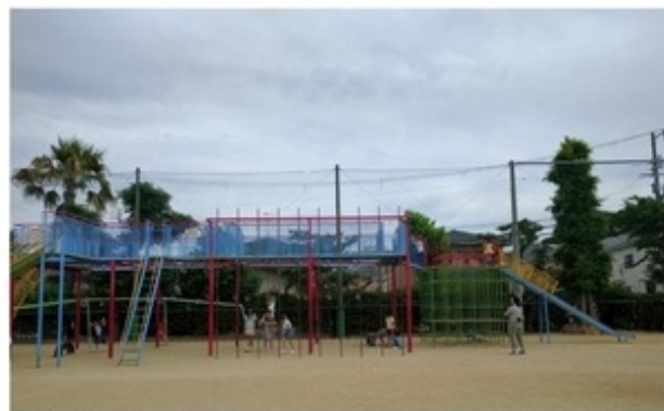
▲宝塚市の小学校の校庭

岡山から兵庫県宝塚市へ。認定NPO法人放課後遊ぼう会主催の放課後子ども教室啓発セミナー「子どもが自ら育つ力が発揮できる場づくり～子どもの遊びに寄り添う大人とは？」と題し、『遊ぶ・暮らす 子どもの放課後にかかわる人のQ&A50 子どもの力になるプレイワーク実践』（プレイワーク研究会～幾島も執筆）をテキストに講義と現場に則したケースワークを行いました。宝塚市の子ども教室は、放課後遊ぼう会、出前児童館、地域主体の居場所の三つの形態があり、午後にはある小学校の放課後遊ぼう会の様子を見せていただきました。学校内でありながらも「自分の責任で自由に遊ぶ」を基本に、大型遊具でリスクな遊び方をしていたり、校庭で一人もくもくと穴掘りをしている子もいれば、異年齢大勢でサッカーをしていたりと、とてもおびのびと過ごせる工夫が随所に見られ、学校内でこのような場づくりをしてきたみなさんの苦勞が感じ取れました。