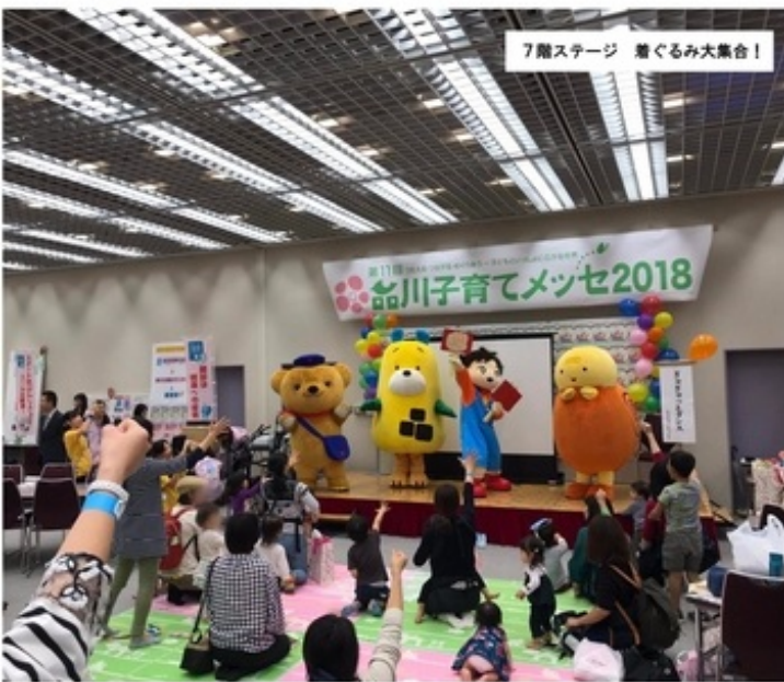
7階ステージ 着ぐるみ大集合！

今年も、子育て中のママで結成された実行委員会と品川区、ふれあいの家ーおばちゃんちの三者の共催で開催できた子育てメッセ。今まで以上に、共催の良さや力が生きたあたたかい場づくりができたように思います。