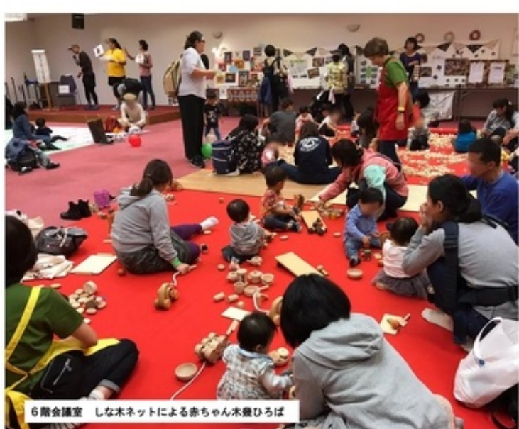
6階会議室 しな木ネットによる赤ちゃん木遊びひろば

変化し続ける現代。一人でも多くの方に役立つ情報を届けたいという変わらぬ思いを形にして届け続けていけるよう、これからも、「共催三者と出展団体とが共に作り上げるメッセ」を目指せたら良いと考えております。