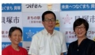
▲貝塚市長、えーるの朝日さんと

大阪の南側貝塚市の波多野前副市長（農水省より外向）が、10年近く前からおばちゃんちの事業展開に関心を持ってくださり、副市長、市職員・議員、NPO職員と大勢の方々が、おばちゃんちに視察に来てくださっていました。そのご縁で今度は私が「子育て支援サークル人材育成研修『子育て・子育てを軸につなげるまちづくり～支援する人・される人の関係を越えて～』」の講師として貝塚市に伺うことになったのです。映像でおばちゃんちの成り立ちを見てから、講義とワークショップを行いました。NPO法人え〜ると自主サークル活動の方が主でしたが、民間会社・市職員の参加もあり、大切なことだと思いました。貝塚市では公民館で活動していた親子の方が中心になり「貝塚子育てネットワーク」が結成され、市民の手による子育ての活動が豊かに育ち、「乳幼児」に留まらず「幼稚園」「小学生」「中高生」「プレイパーク」などの部会ごとの活動が広がっています。その歴史は「うちの子よその子みんなの子 本音の付き合い、だから20年続いている」（ミネルヴァ書房）に詳しくありますが、今年で30周年を迎えるとのこと、ようやく17歳のおばちゃんちとしては励まされる思いです。