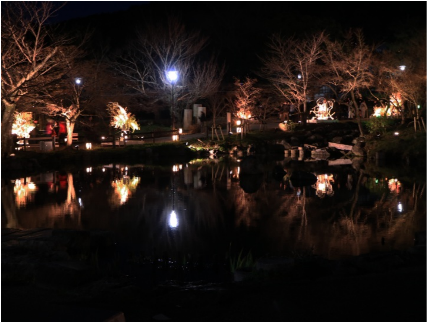
そして池に花 (今日もダジャレが好調です)