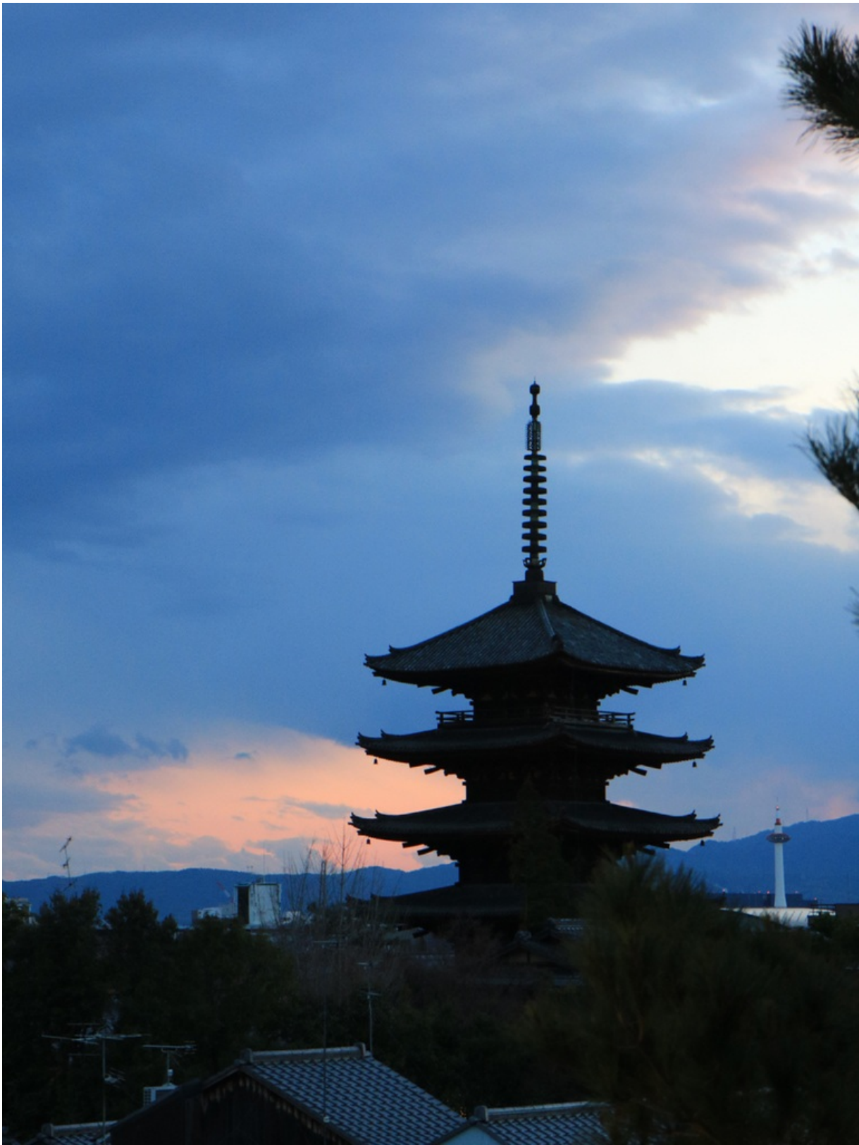
高台寺から八坂の塔を見えています。右手にあるのが京都タワーで、オレンジ色になっているのが西山のあたり。