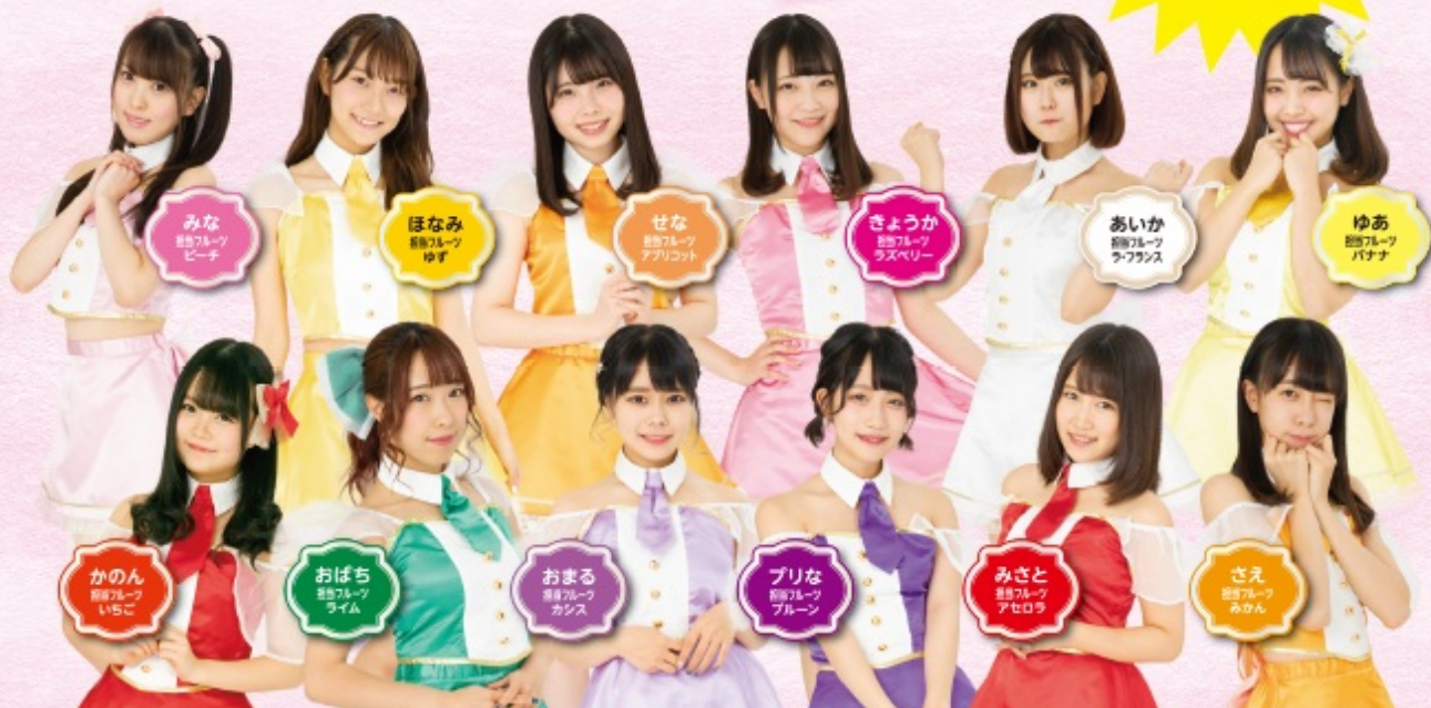
みな お花フルーツ ピーチ