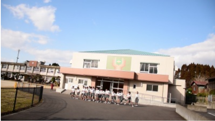
2月21日の3枚（低(1)・中(2)・高(※)）