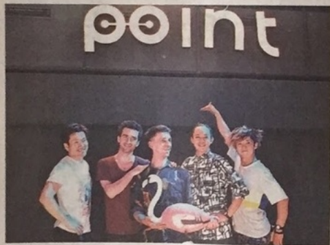
ルーマニアで公演した「んまつーポス」メンバー（右から左へ） ルーマニアで公演した「んまつーポス」メンバー（右から左へ） ルーマニアで公演した「んまつーポス」メンバー（右から左へ）