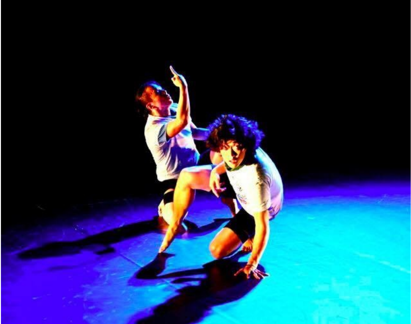
Namstrops X Unlock Dancing Plaza (Japan X Hong Kong)