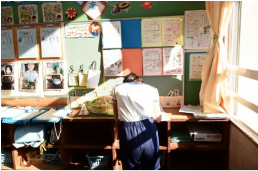
2月9日の3枚（低(2)・中(1)・高(1)）