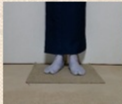
「この丈だと、足首が見えそり なっています。 身丈が短い『つんつるん』は避けたい！」

今回ご紹介した「身丈」「袖丈」 はこの二つのサイズが命。これらは基本的に 「見栄えが良く着る」という目的にはあ りません。 着物は着方によってサイズも変わる ので、何故か着るサイズで自分のサイズ が変わるようになります。 サイズが変わるためにも自分のサイズ でも気持ちの良い着物に仕上がります。 自分のサイズを知って着物選びを楽 にしましょう。