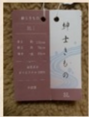
1 プラダ着物に付くタグ 主…身丈、袖丈、袖先の 長さが記載されている ※…且というサイズ表記 あり