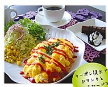
定番オムライス (サラダ・スープ付) 780円

生チョコやチーズケーキが売れています。手作りケーキを毎日6種類を用意していて、ケーキセットやパフェが人気。